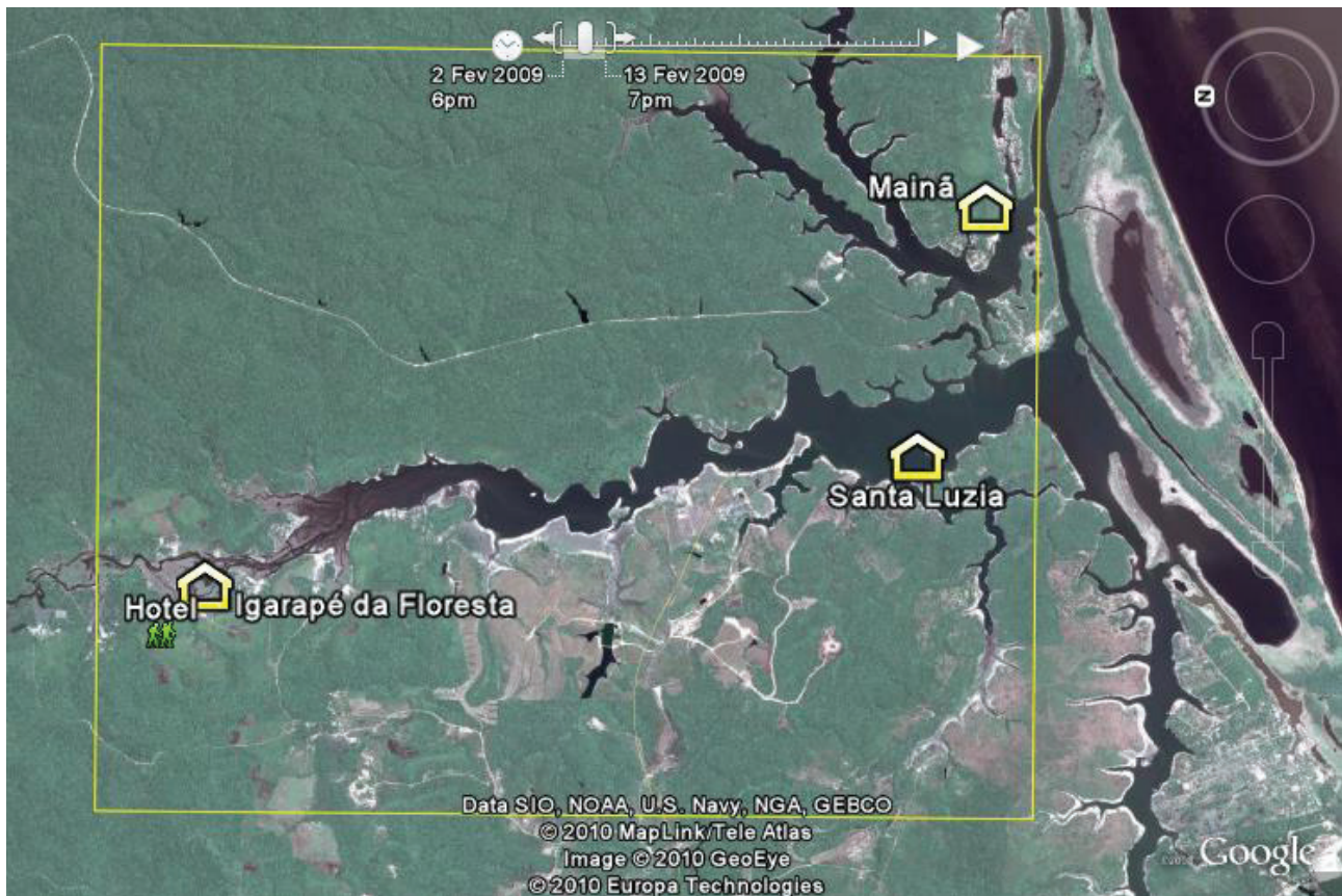
FIGURA 1: Localização das comunidades no rio Puraquequara.

ratória do lugar, visando conhecer o local e a realidade das comunidades, a partir de conversas informais com moradores da região.