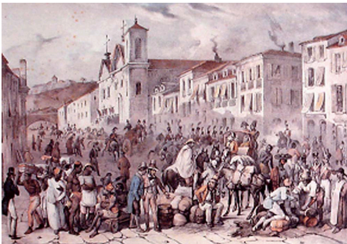
FIGURA 5: Johan M. Rugendas. Rua Direita.

Vale destacar que as obras artísticas ao serem incorporadas no corpo de trabalho das expedições passaram a cumprir uma função, qual seja a de viabilizar a expressão do fenômeno sob outra matriz que não apenas a predominante, a escrita. Isto vale tanto para a expressão pictórica, como para a poética. A referência poética esteve frequentemente em Goethe, mas também em outros literatos. Isto também vale para a pintura, muitas delas pouco importantes do ponto de vista da produção artística em si. Algumas expedições, por sua vez, contaram com pintores especialmente contratados para a função de traduzir os fenômenos e a realidade sócio-cultural dos locais visitados, como foi o caso do pintor Rugendas, assim como Taunay, que participaram da expedição organizada pelo barão Georg Heinrich Von Langsdorff.