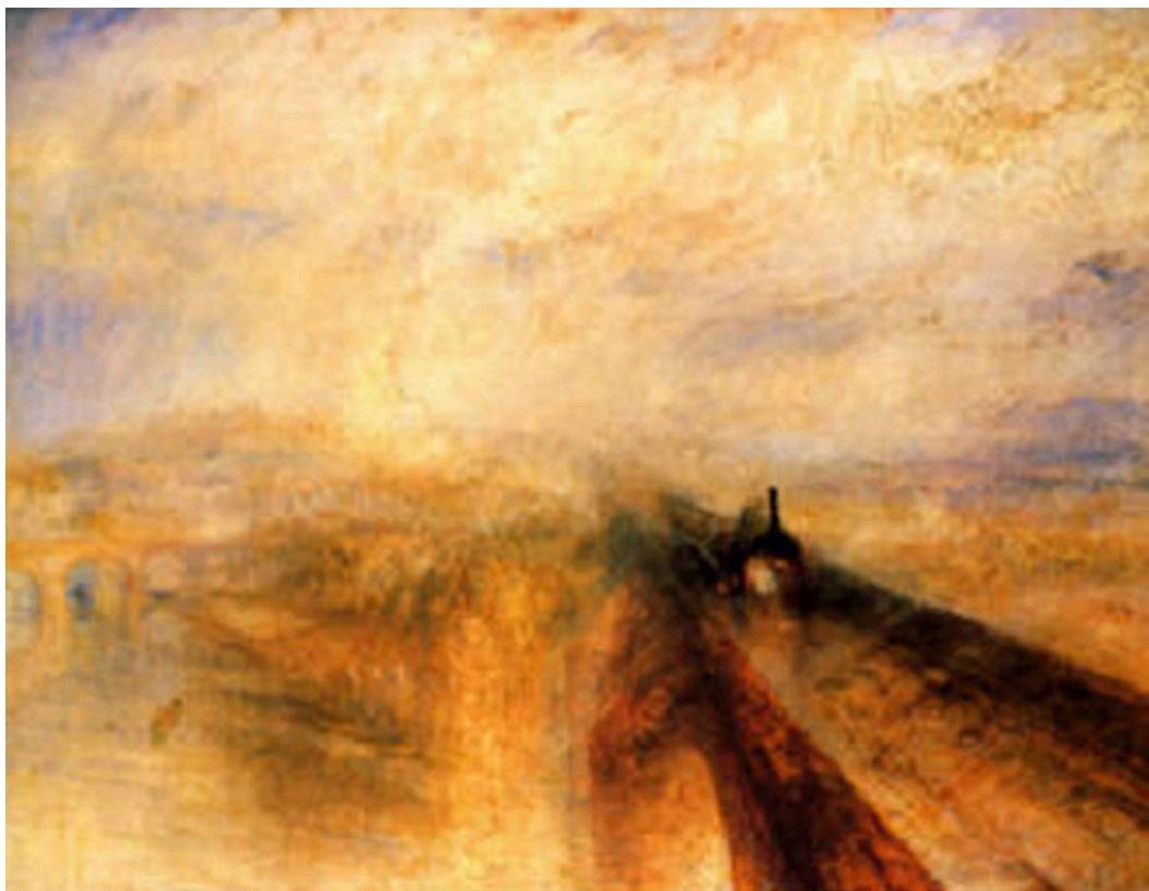
FIGURA 3. Willian Turner, Chuva, vapor e velocidade , 1844.