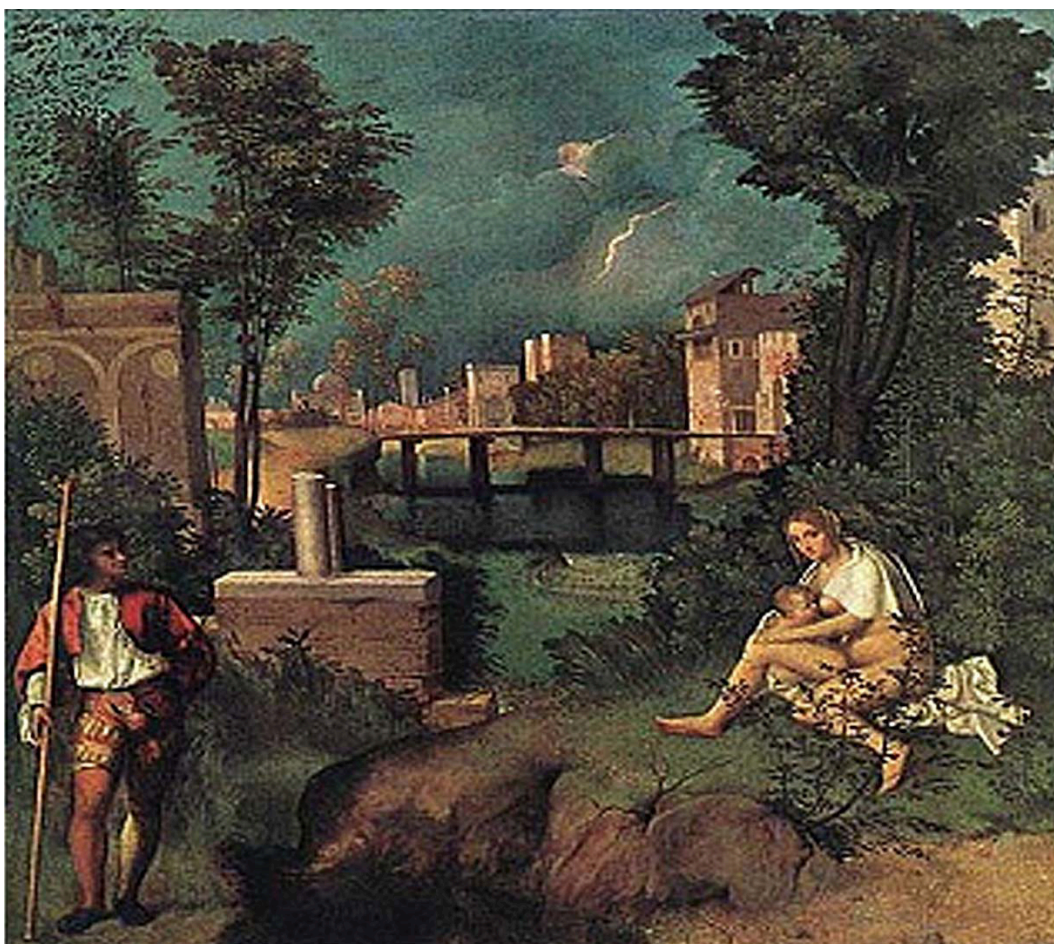
FIGURA 1. Veneziano Giorgione, A Tempestade , 1505.

interativo entre seres de carne e osso, inspirados nos deuses gregos. Nesta obra de 1518, Ticiano traz os deuses gregos para a condição de humanos, remetendo-nos a uma nova relação entre o homem e a natureza.