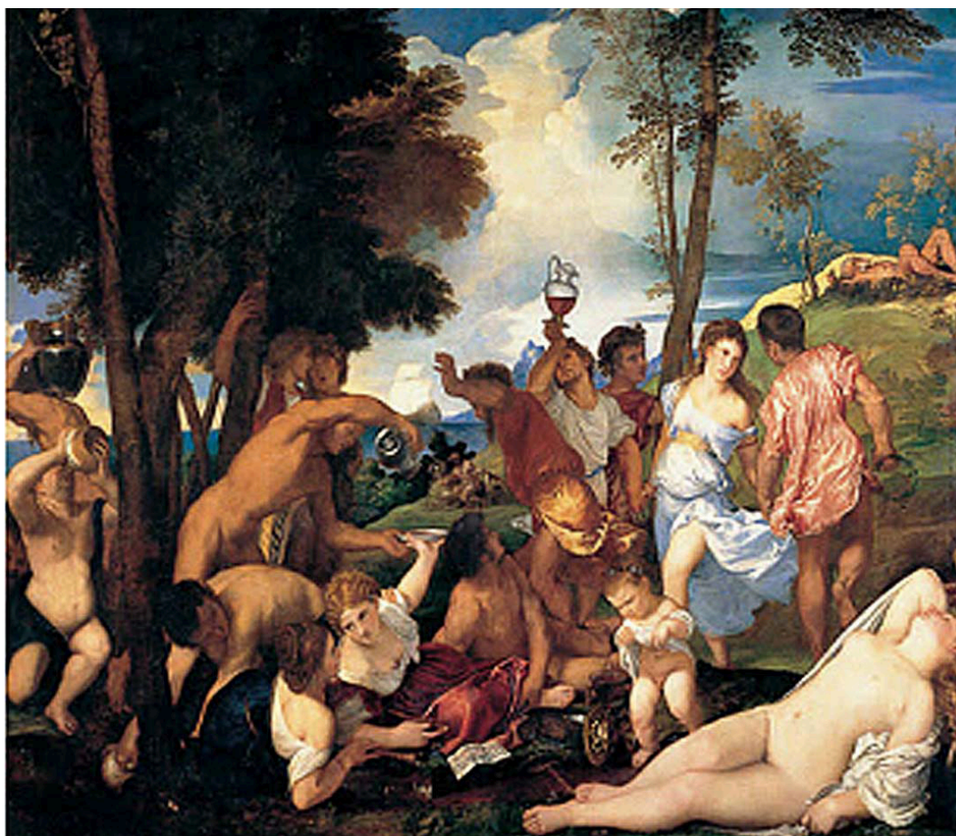
FIGURA 2. Ticiano, Bacanal , 1518.