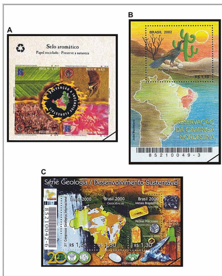
Figura 3. Blocos do eixo temático Meio Ambiente; “Fonte: Empresa Brasileira de Correios e Telégrafos”.

(Figura 3C). Todos os elementos reproduzidos no bloco de selos encontram-se sobrepostos a paisagens naturais e industriais focalizando os recursos hídricos e a extração mineral. Simbolizando as Geociências, o mapa geológico do Brasil, cuja informação básica é essencial para um planejamento integrado com vistas ao desenvolvimento sustentável da nação. O ouro e o nióbio representam os mais significativos metais brasileiros. Entre as pedras preciosas, figuram o diamante, a opala, a brasilianita, o topázio imperial, a esmeralda, a água-marinha e a turmalina bicolor escolhidas por representarem a beleza, a exclusividade e a importância dos minerais brasileiros (CORREIOS, 2000b).