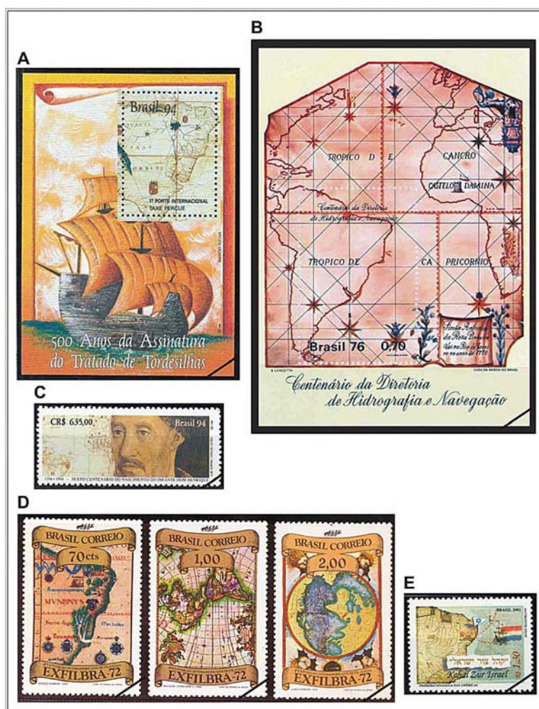
Figura 1. Blocos e selos do eixo temático Cartografia/Mapas Antigos; “Fonte: Empresa Brasileira de Correios e Telégrafos”.

O conjunto de selos representados na Figura 1D comemora a 4ª Exposição Interamericana de Filatelia, tendo sido expedido em 26/08/1972. Esse conjunto é composto por três mapas antigos, sendo que o primeiro representa a América do Sul em 1558, de autoria de Diogo Homem; o segundo apresenta um mapa político das Américas do Sul, Central e do Norte, de autoria de Nicolau Visscher C., de 1652; e o terceiro, um mapa de Lopo Homem (1519), representando a Europa, África e Oceano Atlântico (ADONIAS, 1993).