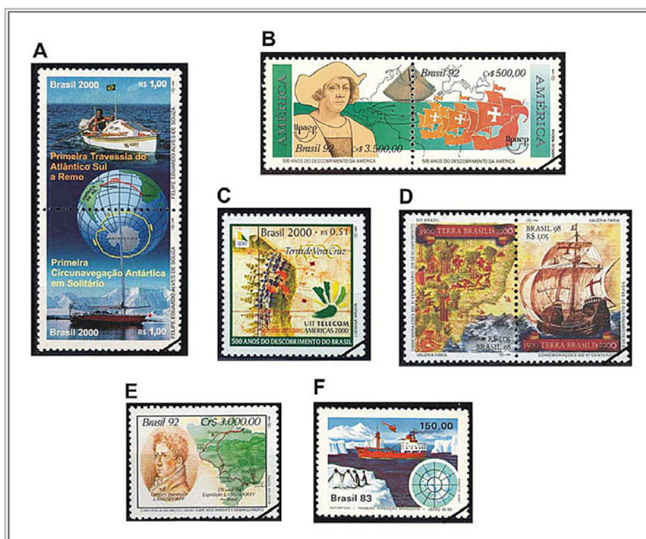
Figura 2. Selos do eixo temático Expedições; “Fonte: Empresa Brasileira de Correios e Telégrafos”.

Este tema é composto por oito selos que apresentam como traço comum à comemoração de importantes expedições empreendidas em diversos continentes, em momentos distintos da história. O primeiro selo deste eixo-temático representa duas notáveis conquistas do navegador brasileiro Amyr Klink: a primeira travessia do Atlântico Sul a remo e a primeira circunavegação Antártica em solitário (Figura 2A). Com emissão em 27/05/2000, o selo representa ambos os feitos históricos com a imagem do globo terrestre com as rotas percorridas pelo