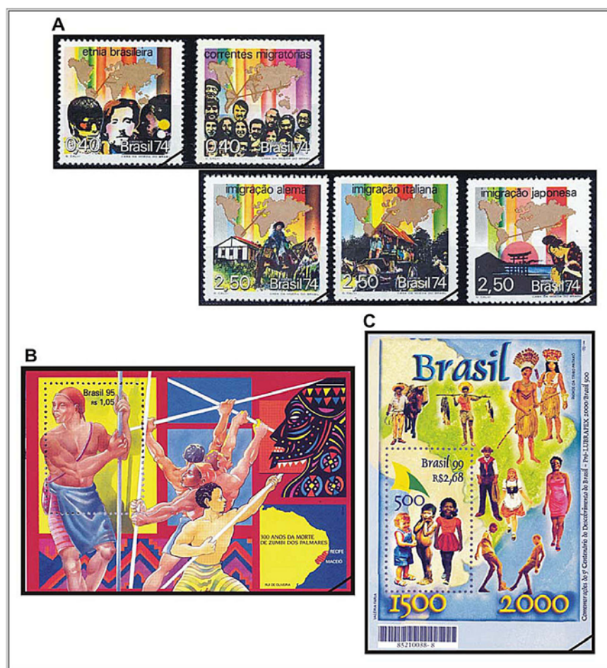
Figura 5. Blocos e selos do eixo temático Migrações e Etnia; “Fonte: Empresa Brasileira de Correios e Telégrafos”.

O último eixo-temático trata de questões associadas à formação do povo brasileiro, do qual fazem parte as correntes migratórias e a composição étnica brasileira. A primeira série, emitida em 03/05/1974, trata da formação da etnia brasileira e da imigração internacional (Figura 5A). O selo “Etnia Brasileira” indica a diversidade étnica do Brasil, representada pelas imagens do índio, branco e negro, colocadas sobre um mapa-múndi, com linhas representando os fluxos migratórios oriundos da Europa, África e América Latina. O Selo “Correntes Migratórias” é composto por um grupo de faces, com feições distintas, sobrepostas a um mapa-múndi, com linhas representando os fluxos migratórios internacionais oriundos de diversas partes do mundo. Nos selos destinados às imigrações alemãs, italianas e