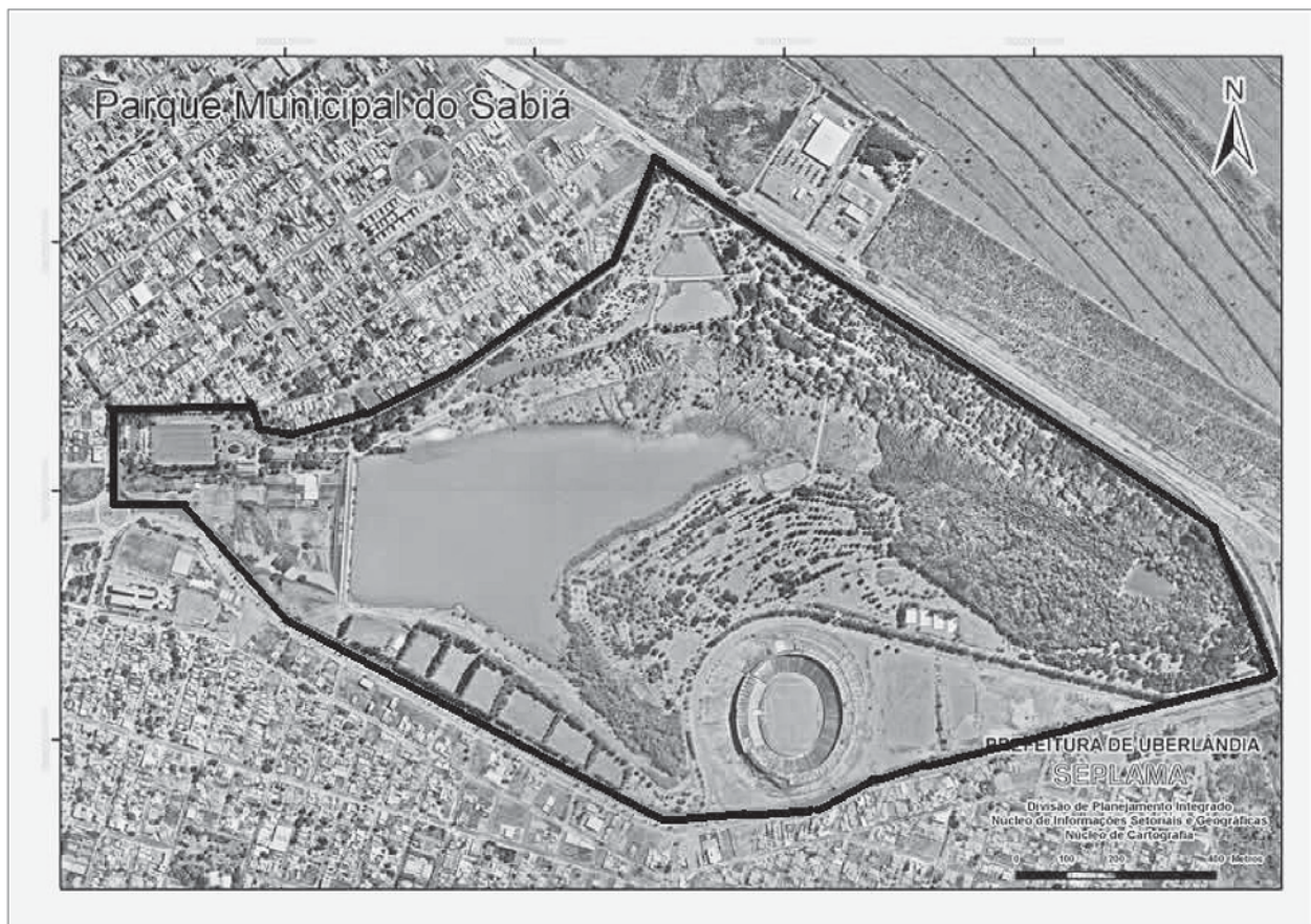
Figura 2. Parque do Sabiá – Uberlândia/MG