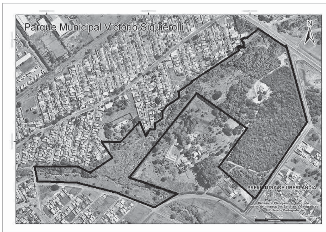
Figura 3. Parque Municipal Victório Siquierolli – Uberlândia/MG

Desta maneira, as Unidades de Conservação em áreas urbanas, além dos parques urbanos e das praças, constituem-se em áreas verdes para a conservação dos recursos naturais e espaços livres para o lazer, desde que haja um sério compromisso com o zoneamento da unidade para que a recreação não comprometa o equilíbrio dos ecossistemas, já fragilizados por todo o contexto urbano. O planejamento urbano deve sempre prever a existência de locais destinados ao descanso e ao contato com o meio ambiente, permitindo a integração completa entre sociedade e natureza.