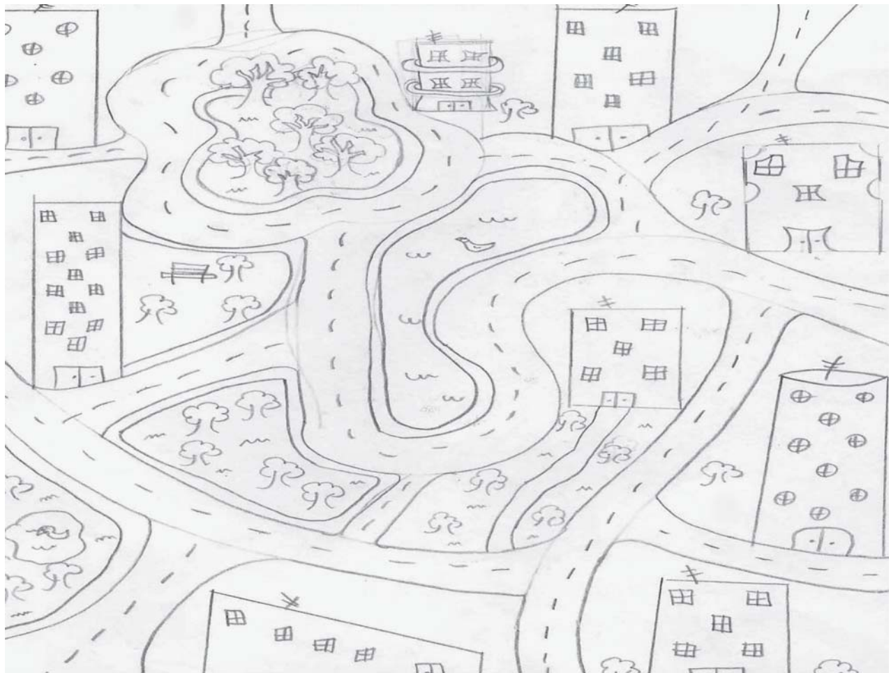
Figura 02: Exemplo de Mapa Mental com Paisagem Modificada Fonte: HASSLER, 2006.

representações da Paisagem Modificada/ Construída sobre a Paisagem Natural, uma vez que do Universo de Análise de 40 (quarenta) componentes apenas 04 (quatro) representaram a Paisagem Natural em seus Mapas Mentais, enquanto que 36 (trinta e seis) representaram a Paisagem Modificada/ Construída.