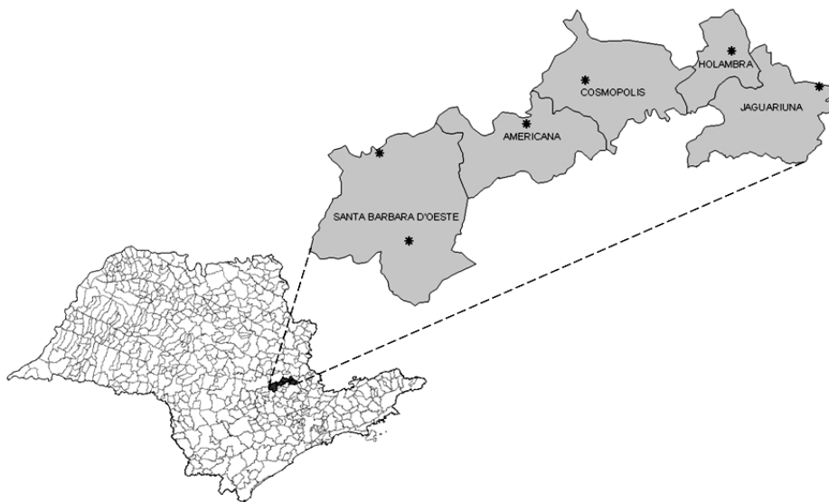
Figura 1 - Localização da área de estudo.

Em termos de circulação secundária, a área de estudo encontra-se em um setor controlado por massas tropicais, mas com influência de sistemas extratropicais, que conferem o ritmo de variação sazonal. Participam aí alguns sistemas atmosféricos essenciais: Tropical Atlântico (Ta), Polar Atlântico (Pa), Tropical Continental (Tc) e Equatorial Continental (Ec), os dois últimos mais ativos no verão. A maior participação de sistemas extratropicais é essencial para a definição de anos mais úmidos e vice-versa (MONTEIRO, 1973.).