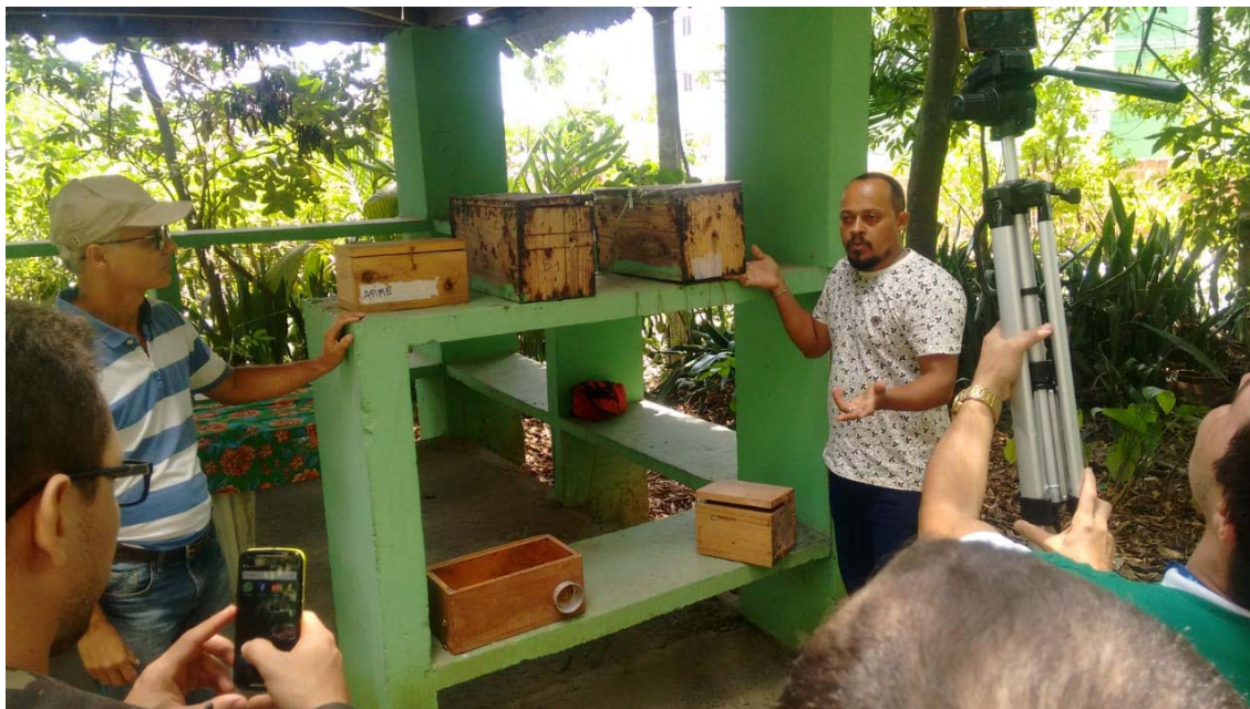
Figura 2 – Atividade de educação ambiental realizada com agentes da Associação Pernambucana de Apicultores e Meliponicultores (APIME) mostrando a importância do cultivo de mel com abelhas sem ferrão nativas da Mata Atlântica.