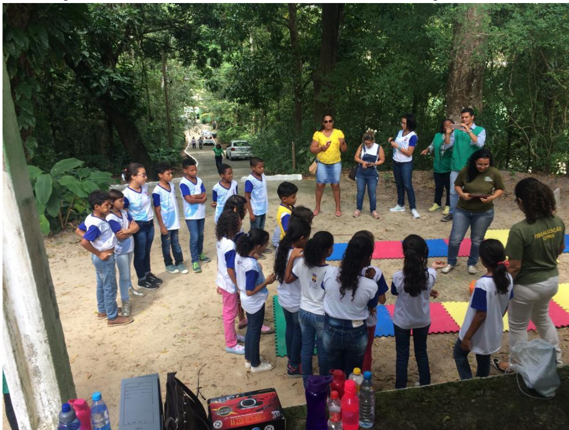
Figura 1 – Atividade de educação ambiental na Mata do Passarinho. Circuito Ambiental realizado por técnicos da CPRH com alunos da escola da Rede Municipal de Olinda.