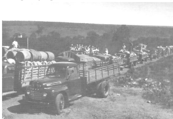
Figura 1. Motoristas em manifestação na Ponte do Vau contra cobrança de pedágio pela Cia. Mineira de Auto-Viação (1948).