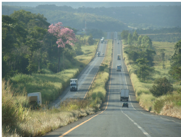
Figura 3. BR-050 nas proximidades de Uberlândia

Fonte: Foto de Selma Marsson (07.mai.2010)