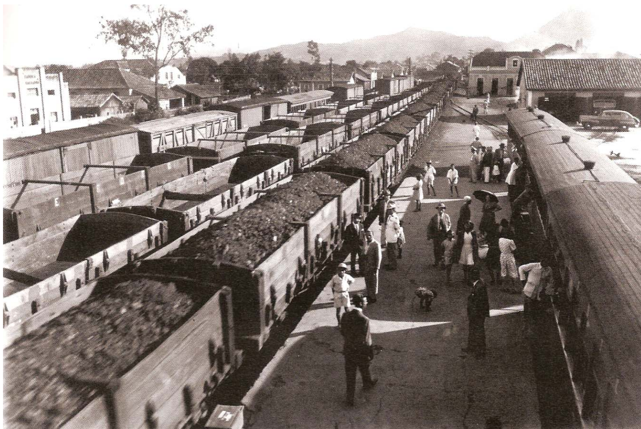
Figura 2: Carbón transportado en el recorrido de Lauro Müller a los puertos.

En el año 1890, surge la primera empresa de explotación en la región de Criciúma, conocida como Lage e Irmãos (MILIOLI, 1995). El transporte de carbón comercializado era hecho por carros de bueyes hasta un lugar llamado Pontão, en las proximidades de Jaguaruna, y desde ahí seguía por vía fluvial y lacustre (TEIXEIRA, 2004) por los cursos generales del río Tubarão, seguido en canoas hasta Laguna, donde el carbón de piedra era llevado hasta los centros de consumo. Línea Férrea Dona Thereza Christina, actualmente conocida como Ferrovia Trezeza Cristina, fue concluida el 1 de septiembre de 1884 (TEIXEIRA, 2004), por la empresa James Perry & Co e impulsó el transporte de Lauro Müller a los puertos de Laguna (CPRM, 2008; BRAZIL 1987) e Imbituba, conforme ilustra la Figura 2.