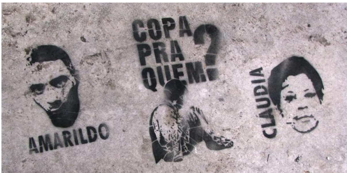
Figura 10 Estêncil de retrato e nomes no Rio em 2014.