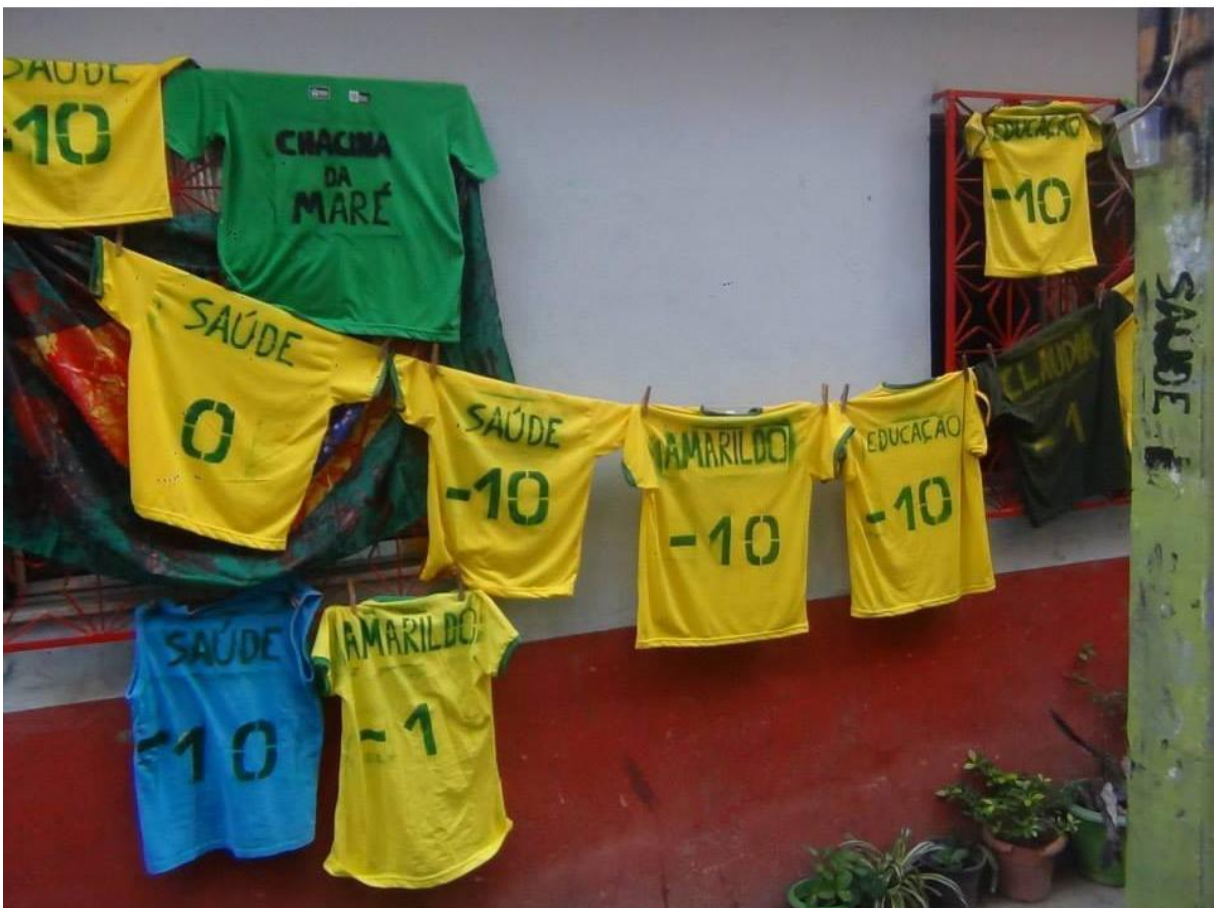
Figure 8 Estêncil anti-Copa em ruas e roupas, incluindo nomes e temas.

Conforme ilustrado na Figura 8, uma técnica do estêncil utilizada na decoração anti-Copa na Maré no 14 de junho de 2014 foi a gravação de nomes. Tais