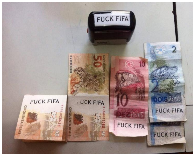
Figura 3 Parafernália anti-Copa; selos de tinta, dinheiro carimbado.

Embora a arte contra a ditadura de Cildo Meireles, Antonio Manuel e outros tenham se tornado canônicas na arte contemporânea brasileira, entre 2013 e 2014 esses procedimentos foram retomados nos protestos e campanhas em torno da Copa do Mundo de 2014 com certas especificidades, conforme ilustrado nas Figuras 3 e 4, durante um momento nacional e global complexo de grandes mudanças e protestos. 8