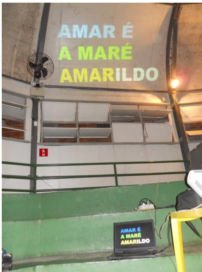
9 Projeção digital por Coletivo Projeção em um centro comunitário da Maré, durante a entrada da Força de Pacificação do Exército, de 4 a 5 de abril de 2014.

um centro comunitário na Maré, durante a entrada da Força de Pacificação do Exército.