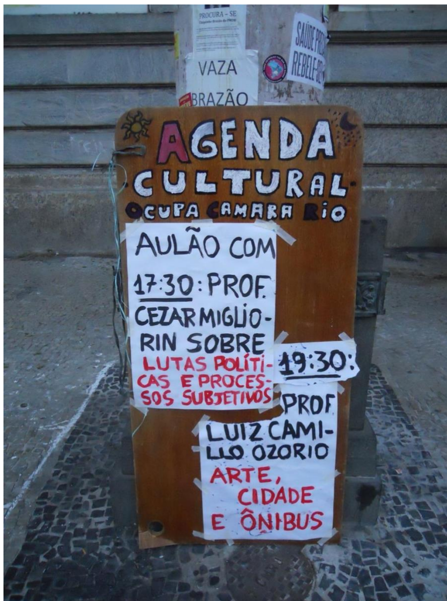
Figura 1: Cartaz para as aulas públicas na Ocupa Camera, na Câmara Municipal do Rio de Janeiro, setembro de 2013.

Na palestra, Osorio demonstrou que havia certas influências desses trabalhos, nas práticas de arte-ativismo naquele momento em 2013. Os primeiros exemplos das intervenções de frase ilustradas nesse artigo demonstram uma trajetória, mudando das tradições culturais populares, decorando as ruas para a Copa do Mundo da FIFA, em direção a uma nova versão, realizada em 2014, as chamadas 'decorações de rua anti-Copa'.