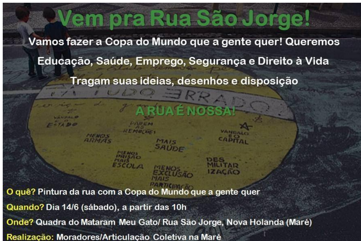
Figura 5: Filipeta postada pelo Facebook do Jornal O Cidadão, 6 de junho, 2014.

Olhando para frente, simultaneamente, chamou à criação de mais decorações de rua anti-Copa e outras atividades de protestos por vir, num contexto e momento específico.