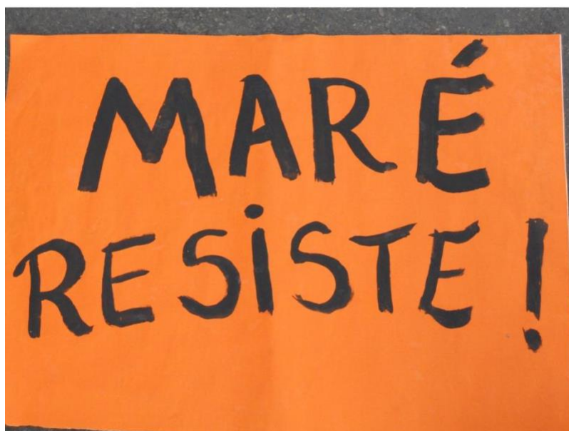
Figura 7 Cartazes de protestos contra Força de Pacificação do Exército na Maré e a Copa do Mundo de 2014, no dia 5 de abril de 2014.