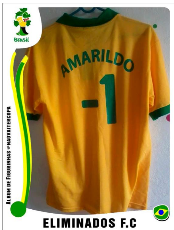
Figura 4 Parafernália anti-Copa; camisa de futebol, adesivo de futebol, meme.

nome de um morador comum de uma favela, 'Amarildo' Dias de Souza. Acrescentando aqui o sentido mais transgressivo, esse nome foi acoplado ao número '-1', representando sua morte nas mãos da polícia numa favela pacificada no Rio. O caso de Amarildo ocorreu em 13 de julho de 2013. Tratou-se do desaparecimento, tortura e morte de um pedreiro de 43 anos, nas mãos de policiais da UPP em uma favela 'pacificada' chamada Rocinha. 9