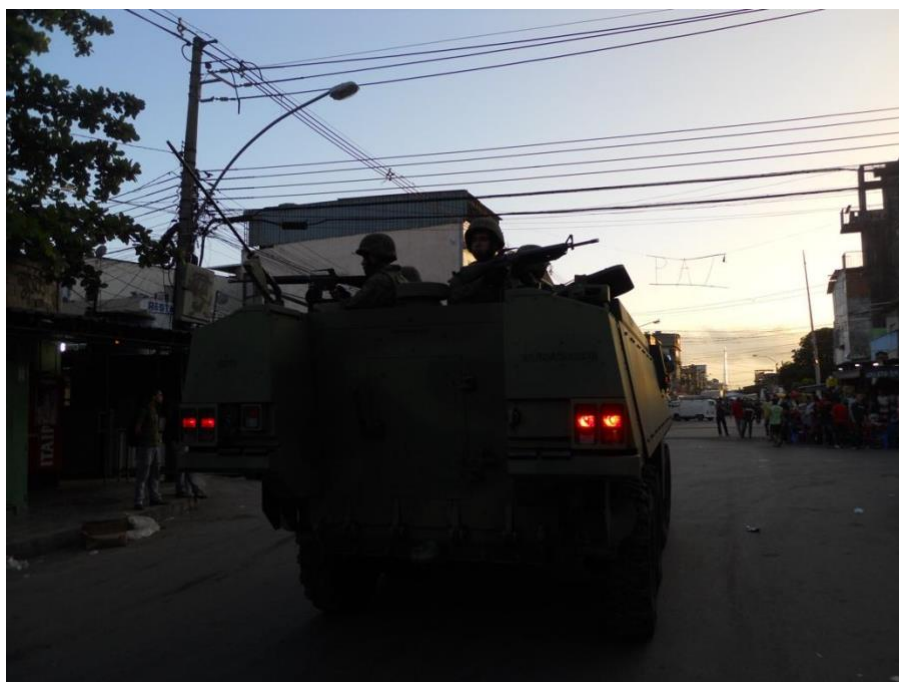
Figura 6 Entrada da Força de Pacificação do Exército na Maré, no dia 5 de abril 2014.

a Copa do Mundo de 2014, que deveria começar três meses depois, em junho de 2014. O segundo era garantir a segurança da área para que a UPP (Unidade de Policiamento Pacificador) pudesse ser implantada permanentemente na Maré logo depois. O nome oficial para esta operação foi Força de Pacificação do Exército , e foi o ponto de partida para a implantação da ‘pacificação’ das favelas da Maré.