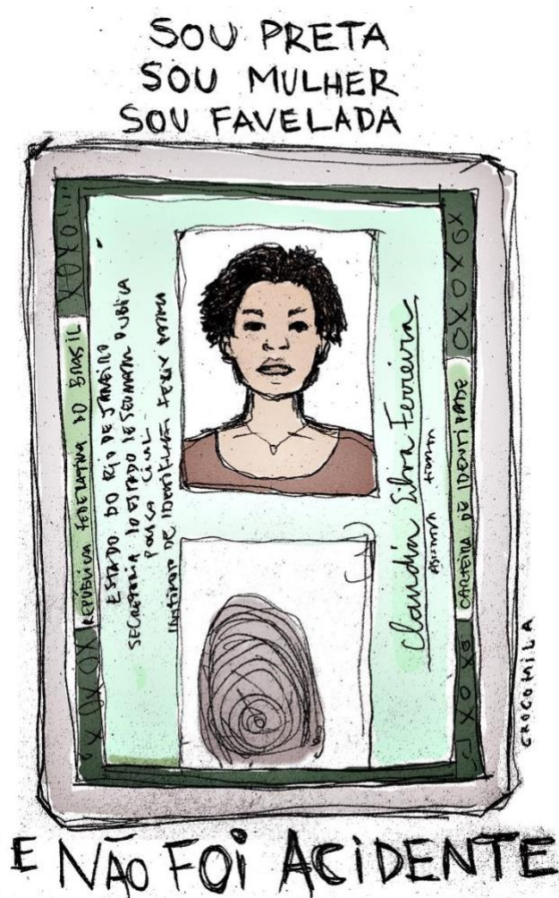
Figura 11 Retrato da carteira de identidade da campanha 100 Times Claudia.

assinatura (formas imagéticas e escritas associadas à identidade pessoal), pode ser visto também a seguinte frase: 'Sou negra, sou mulher, sou favelada, e não foi um acidente.' A frase conecta uma pessoa com outras, enfatizando as três categorias, referidas interseccionalmente, em argumentos de violência estrutural (Crenshaw, 2017).