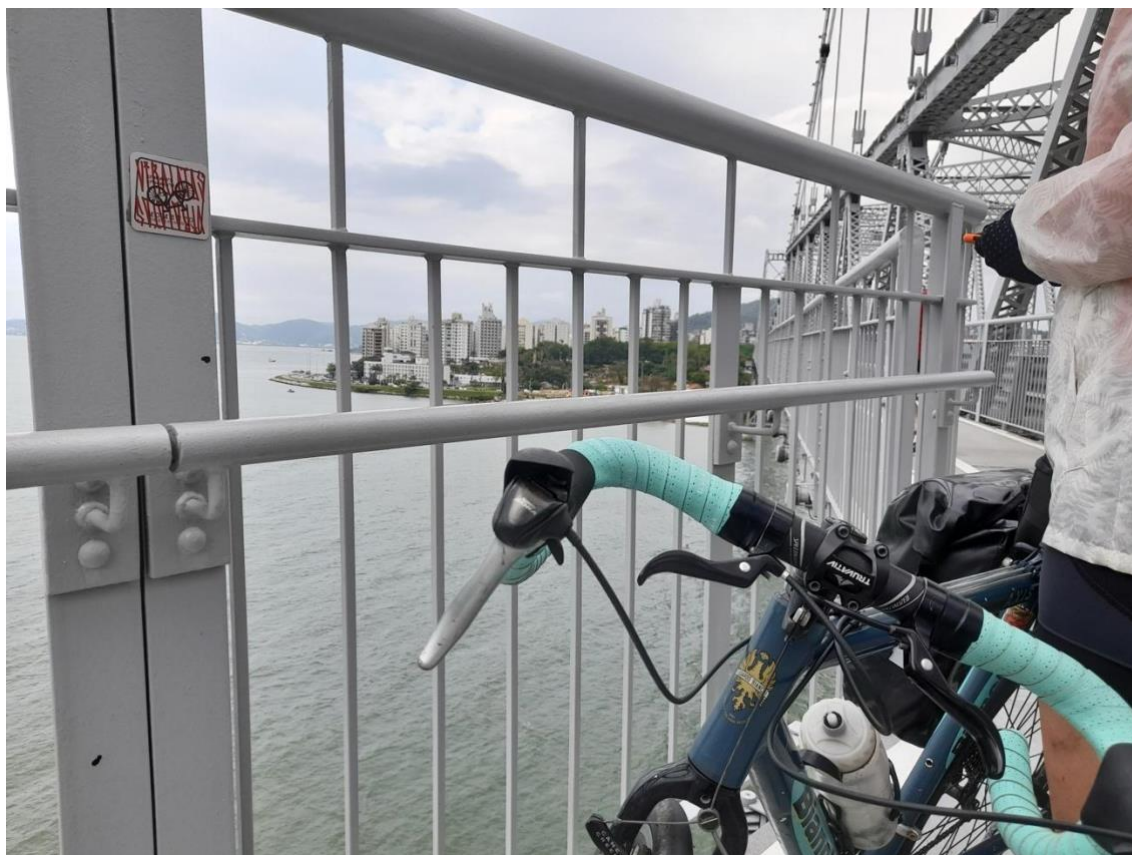
Figura 7. Ponte Hercílio Luz, entrada para a Ilha de Florianópolis, SC.

distantes. O tato, o gosto e o cheiro são mais bem apreciados em um lugar ainda mais adensado, pois as texturas, os sabores e os cheiros requerem maior imersão no ambiente.