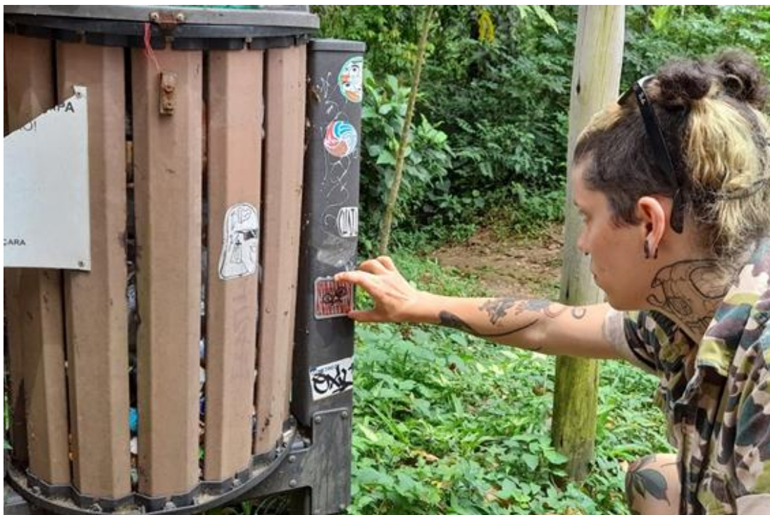
Figura 3. Entrada da trilha para a Praia Brava, Vila Trindade, Paraty-RJ.

Ao ampliar seu território espacial, demarcando lugares com urina ou placas, o deslocamento de ambas as matilhas de vira-latas nos revela uma variável bastante pertinente: a distância, que, conforme Tuan (2013), é uma variável que resulta da combinação entre um percurso do lugar x até o y . A distância pode ser medida com métricas espaciais, mas também pelo tempo empregado para se chegar de um ponto a outro. Além disso, a força para o deslocamento está carregada de intenção e planejamento, que “cria uma estrutura espaçotemporal de ‘aqui é agora’, ‘lá é então’” (Tuan, 2013, p. 159). São possibilidades de se criar projeções temporais entre o espaço futuro, a ser conquistado, dentro de um dado planejamento de deslocamento.