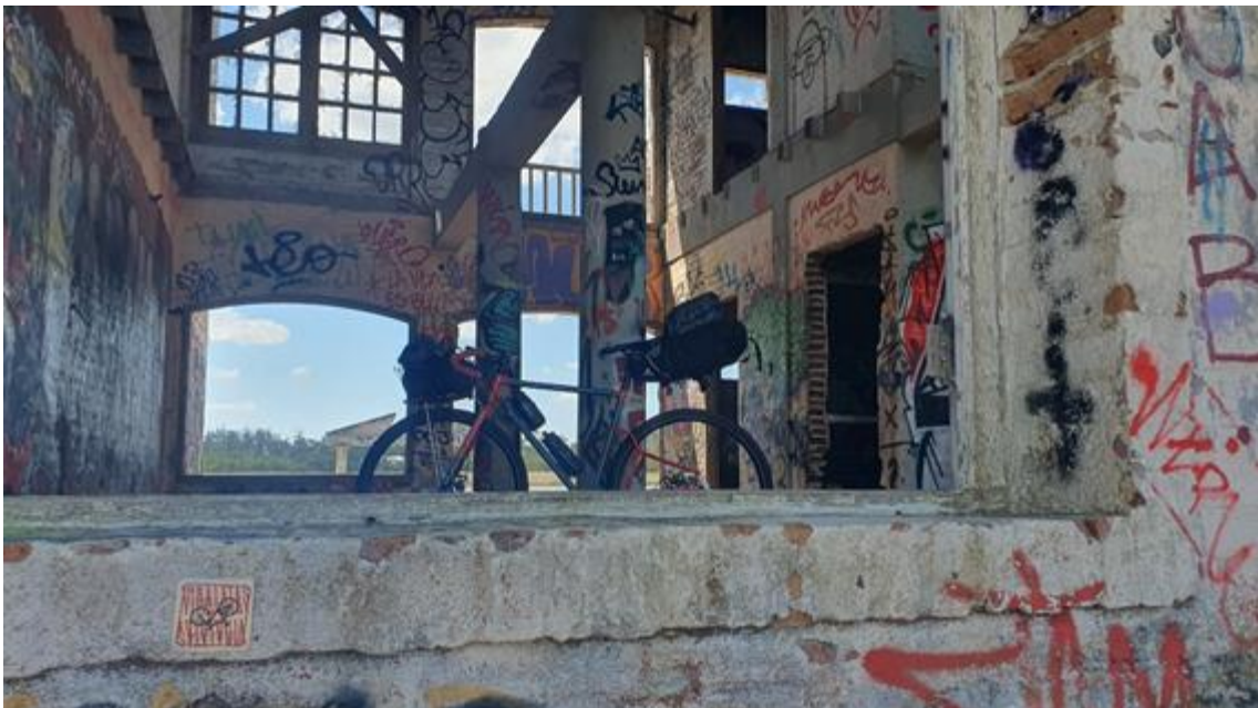
Figura 6. Jose Ignacio, Maldonado, Uruguai.

Ter o corpo disponível para desorientar-se e aberto e vivenciar o ambiente contribui para acender reações do sujeito e, portanto, ativa seu protagonismo. O sujeito ativo contrapõe a cidade enquanto produto-imagem. “Para os errantes, a cidade deixa de ser uma simples mercadoria imagética quando ela é vivida, e essa experiência inscreve-se no seu corpo” (Jacques, 2012, p. 303). O sujeito, ao praticar percursos em forma-trajeto desviantes do traçado naturalizado pelas linhas/vias de transporte, gasta tempo observando lugares desconhecidos, o que é um tipo de operação que reedita/ressignifica a relação com o percurso cotidiano e contribui para a desespetacularização das paisagens turísticas e das já conhecidas.