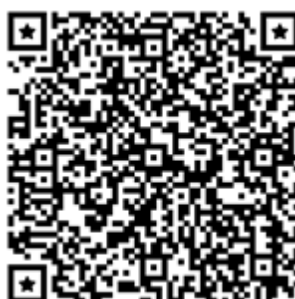
Figura 4. QR Code com link para acesso ao mapa virtual de Momento Histórico Tombado, que pode ser acessado pelo celular. Acesso: https://www.google.com/maps/d/edit?mid=1bYuRgrqIF9lxmqOGnNKEQJ-fF4xswT82&usp=sharing

Ao ampliar seu território espacial, demarcando lugares com urina ou placas, o deslocamento de ambas as matilhas de vira-latas nos revela uma variável bastante pertinente: a distância, que, conforme Tuan (2013), é uma variável que resulta da combinação entre um percurso do lugar x até o y . A distância pode ser medida com métricas espaciais, mas também pelo tempo empregado para se chegar de um ponto a outro. Além disso, a força para o deslocamento está carregada de intenção e planejamento, que “cria uma estrutura espaçotemporal de ‘aqui é agora’, ‘lá é então’” (Tuan, 2013, p. 159). São possibilidades de se criar projeções temporais entre o espaço futuro, a ser conquistado, dentro de um dado planejamento de deslocamento.