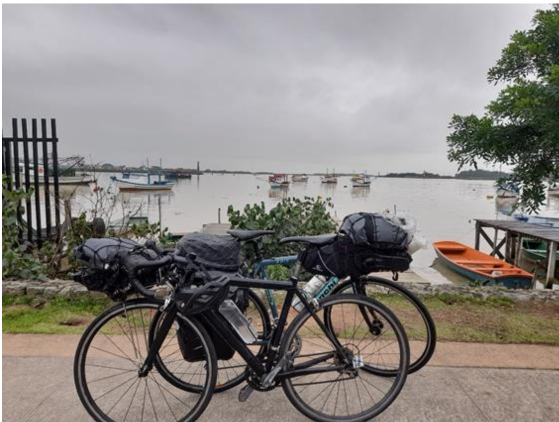
Figura 1. Trajeto na orla entre o Farol Navegantes e o Molhe de Itajaí, SC.

A/Os ViraLatas encaixam as bicicletas entre suas pernas, hibridizam-se com tal meio de transporte, tensionam as correntes e giram adiante, embalam os pedais ansiando, por colocar seus corpos em experiências de ampla qualidade sensorial. A escolha da bicicleta se justifica na própria lentidão, necessária para que a/o pedalante mergulhe no tempo do trajeto, aprecie as transformações das paisagens sensoriais de diversas ordens.