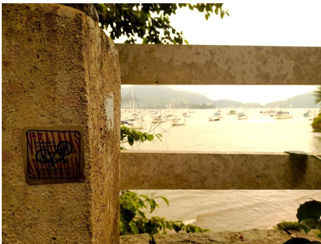
Figura 2. Placa de alumínio colada em porto de Ubatuba-SP.

Tais táticas são parcialmente apropriadas pelos ciclistas ViraLatas : se para os caninos tal presença ausente acontece por meio da pregnância do cheiro de urina, para os ViraLatas ciclistas, essa marcação corresponde à colagem da placa de alumínio (Figuras 2 e 3) e a organização dos endereçamentos em um mapa (Figura 4), que será abordado mais adiante.