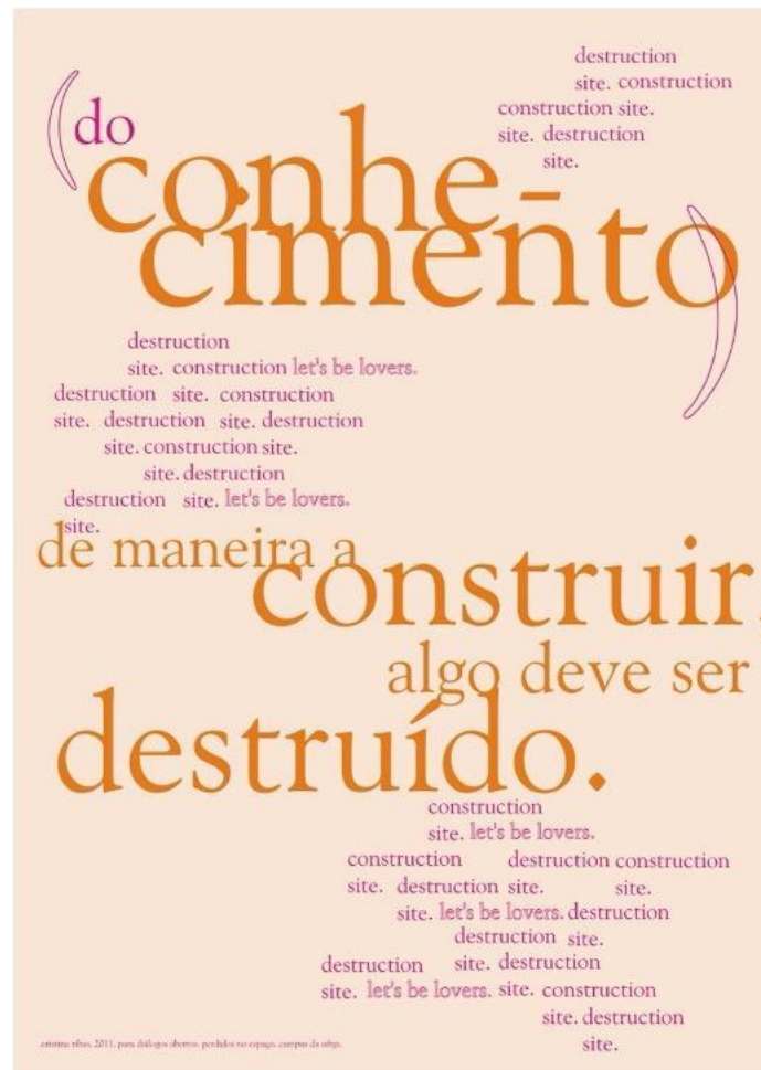
Figura 2. - Cristina T. Ribas, 2011. Cartaz “Conhecimento/destruição”. Produzido entre a residência artística no British Council, 2009 (Londres) e o projeto Perdidos no Espaço/Diálogos Abertos, 2011, IA/UFRGS (Porto Alegre).

A cartografia destrutiva aqui se vale das imagens dialéticas criadas por Benjamin, mas procura afirmar aquilo que ele lá não arriscou (porque era preciso exacerbar o vazio da destruição). Há criação na destruição? Que modulações da destruição são capazes de derruir aquele vazio, e sustentar vínculos, existências múltiplas, defender mundos mais justos, e em relação ética com seus territórios? A ideia de uma cartografia destrutiva é também um ponto de afirmação retórico a ser sustentado – como enunciado que não se pode abandonar. Isabelle Stengers escreve na obra No tempo das catástrofes que “o capitalismo está sempre propagando uma operação de destruição” (Stengers, 2015, p. 92), ela dialoga, sem dúvida, com as imagens que Benjamin testemunhava antes e durante as guerras e diante do fascismo. Sem ser programática, antes de seguir, é preciso dizer: as cartografias destrutivas são uma forma de dar conta de realizar pedagogias críticas em sua capacidade de atualizar os problemas com os quais precisamos lidar, trabalho crescente de discernir as forças destrutivas que esvaziam de outras forças, de finalidades divergentes.