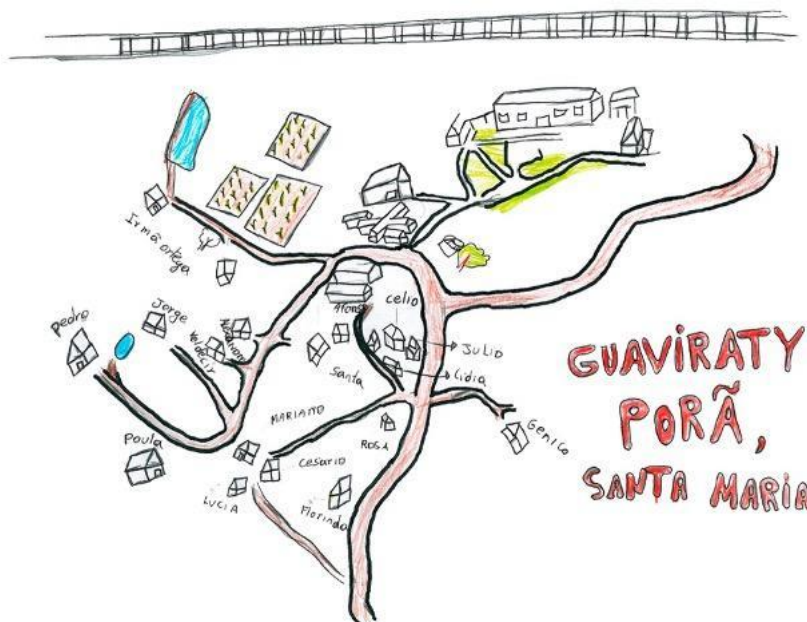
Figura 7. Indígenas da Aldeia Gaviraty Porã. Tekoa Gaviraty Porã , Projeto Saberes Indígenas na Escola, UFRGS, Porto Alegre, 2014.