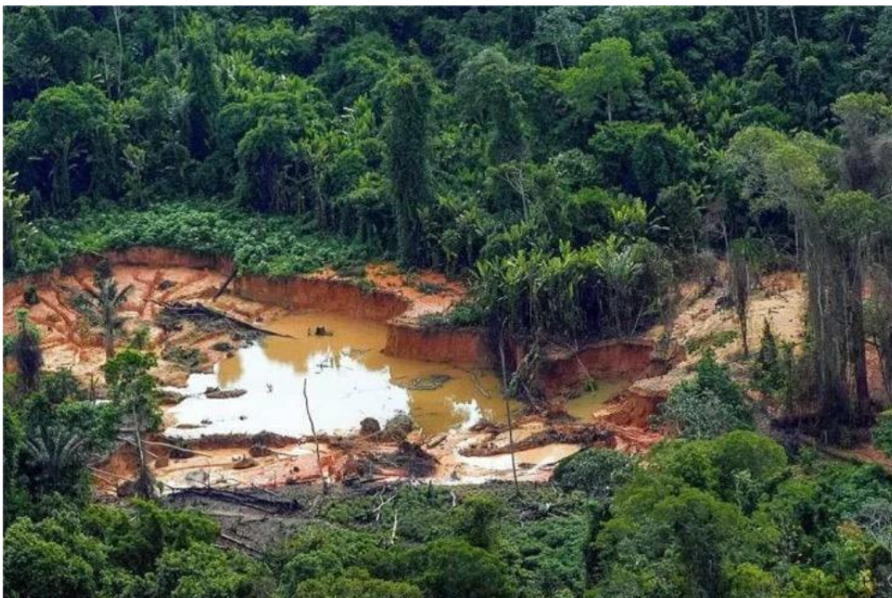
Figura 8. Garimpo de ouro, TI Yanomami, região amazônica.