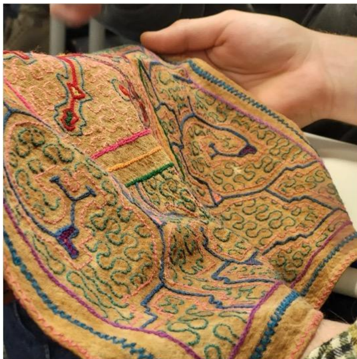
Figura 9. Pano bordado da etnia Shipibo-Conibo, que funciona como um mapa mas também como rezas para curas xamânicas Pano bordado Andino, que funciona como um mapa. O pano-mapa é usado em oficinas de cartografia crítica, foi comprado em uma aldeia na Amazônia Peruana. Foto: Godofredo Pereira, na ocasião da oficina no Royal College of Arts, Londres, 2023.

Desenhar a percepção sobre o território e suas forças, olhar com aquele olhar que vê “duas coisas” - o passado e o futuro, se mover à medida em que se constituem nossos modos, nossas percepções, sem repetir os mundos destrutivos que nos são impostos. Se mover desenhando, produzindo novos signos destas concatenações que nos incutem. E dar a ver aquilo que o poder estatal e violento quer obliterar, dar a ver os afetos que nos tomam. Gestos gerativos, cartografias gerativas. A cartografia destrutiva percebe os pontos de tensão em determinadas coordenadas botando consistência em processos estéticos que, somados às vitalidades, possam resistir à sua maneira a distintos modos de extrativismos e submissão da vida. 23