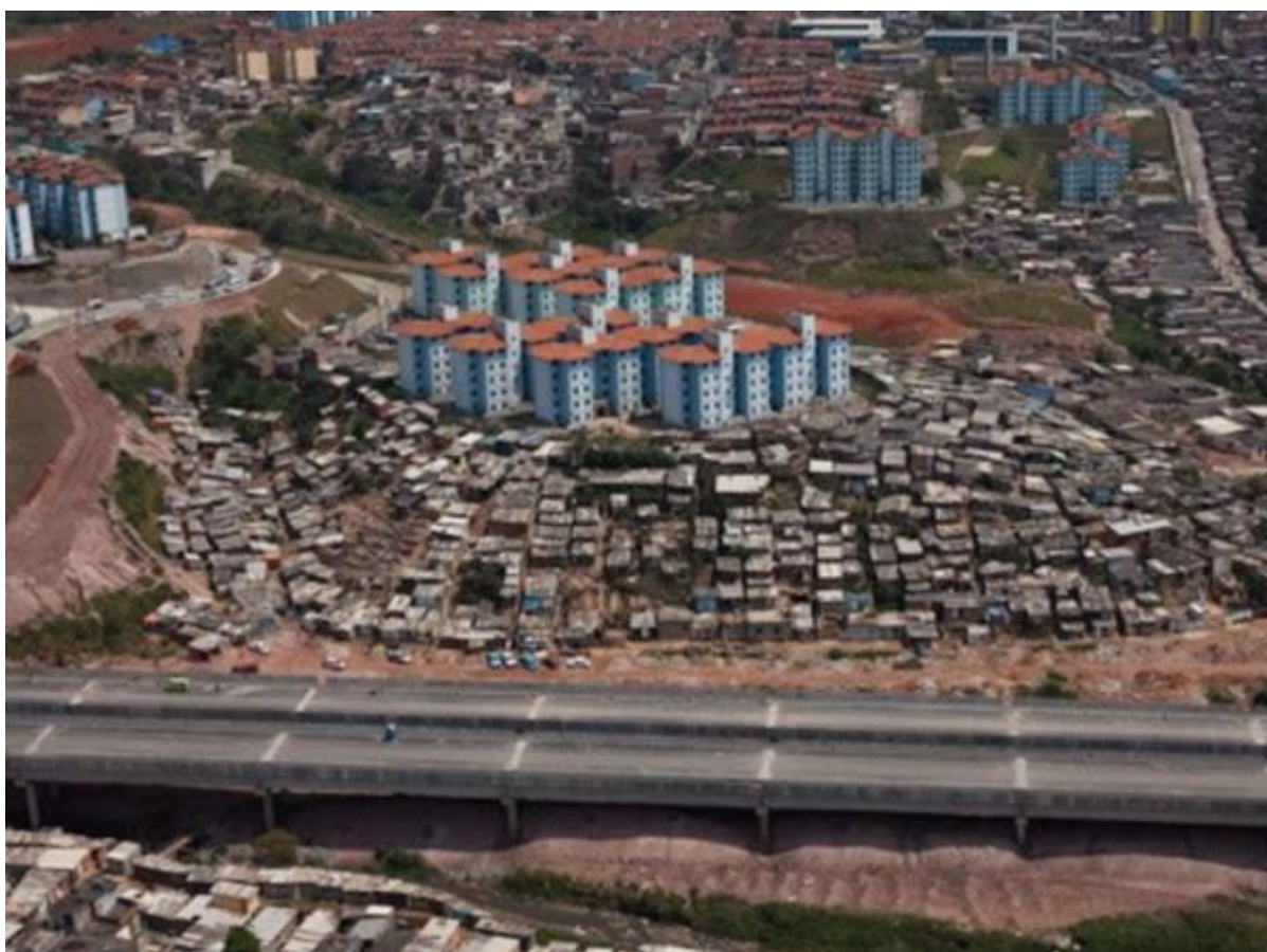
Figura 2: Novos prédios na favela do Jardim São Francisco.