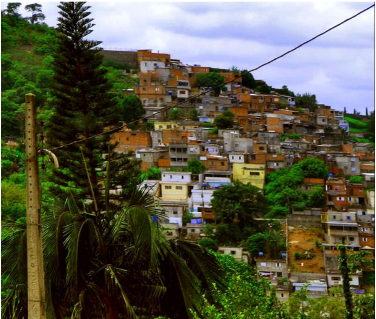
Figura 1: Favela em São Paulo.