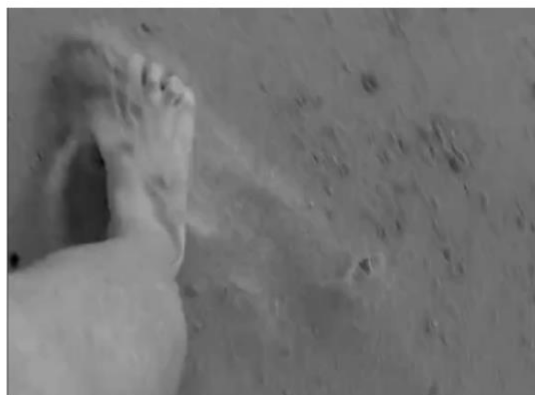
Figura 6: Claudia Paim, Corpo Paisagem#Sur , 2013, videoperformance, frames do vídeo.