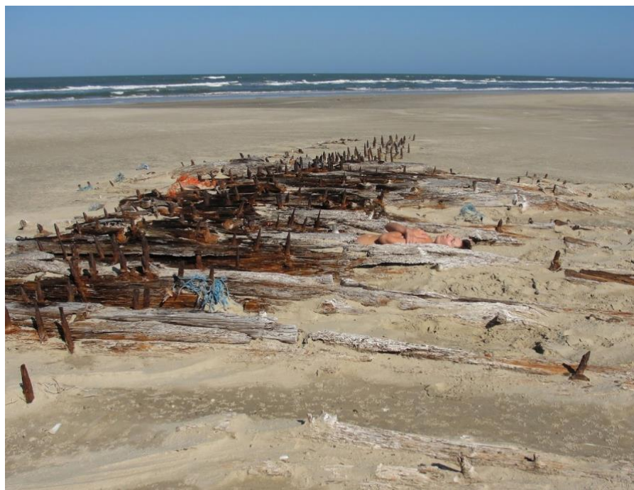
Fig. 7. Claudia Paim, corp paisagem#amalgamas , 2014, fotoperformance.