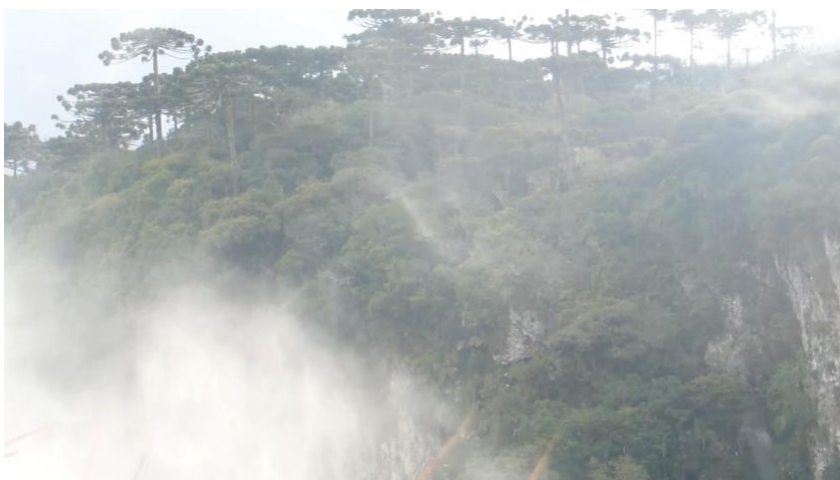
Figura 3. Claudia Paim, Corpo imerso sul , frames do vídeo, 2014.