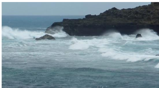
Figuras 4 e 5: Claudia Paim. Corpo imerso norte , 2014, vídeo cor, 2'40".