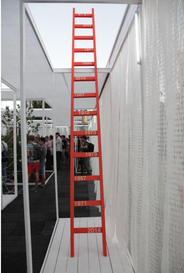
Figura 7. "Escala" de Manuela Flores (2014).