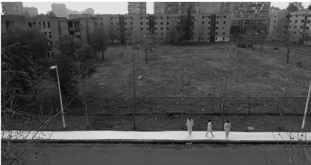
Figura 10. “Cien metros de silencio” de Colectivo Ejercicios Impermanentes (2017).