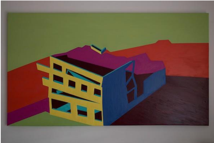
Figura 4. Obra en proceso de Tamara Contreras Landeros.