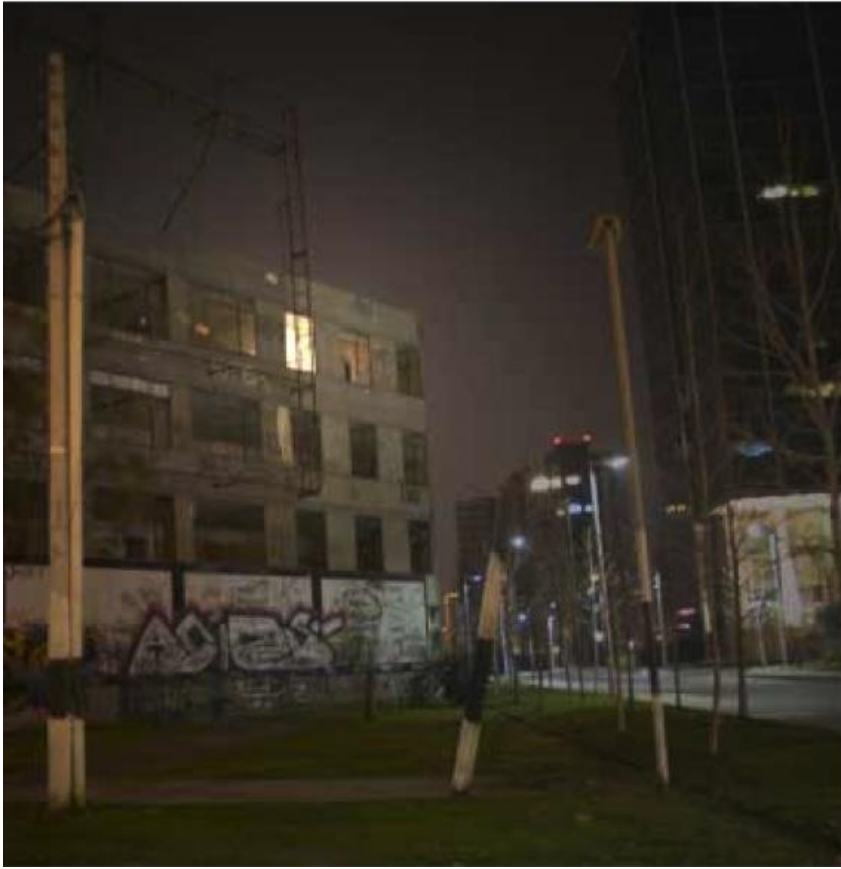
Figura 1. Intervención en Villa San Luis de Lucrecia Conget (2008).