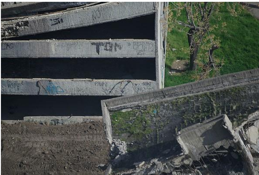
Figura 5. Villa San Luis.