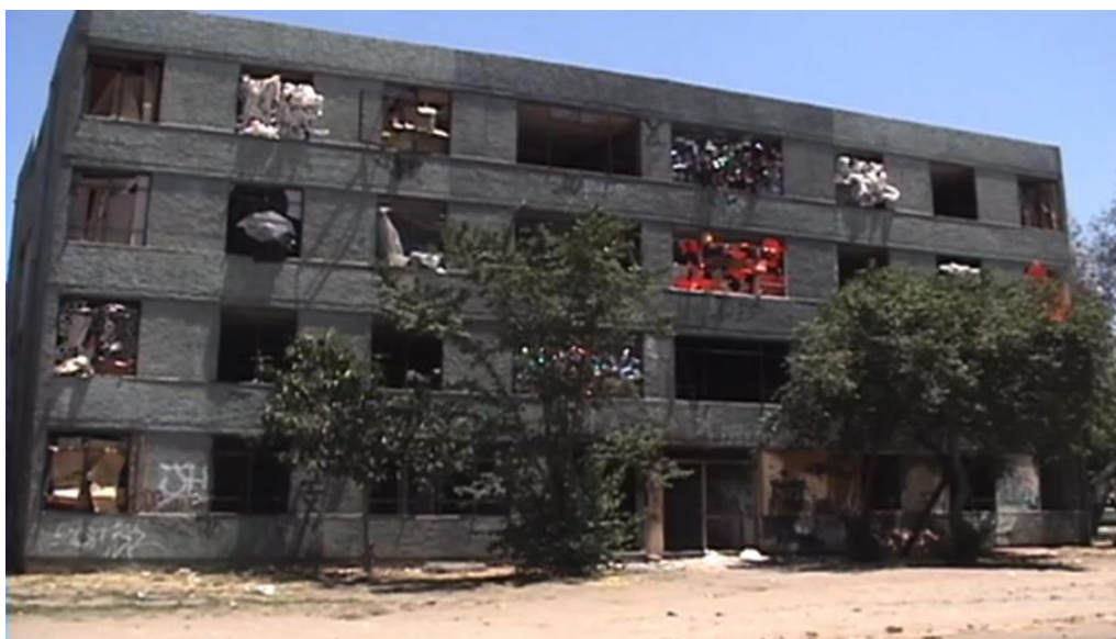
Figura 11. Fotograma de “Villa San Luis” de Valentina Utz en colaboración con Matías Klenner (2009).

aloja, de esta forma, un tipo particular de desperdicio, agrupado por criterios formales o funcionales: una serie de botellas plásticas ordenadas por color, unos retazos de cajas de cartón, una colección de bolsas de basura, fragmentos de plástico naranja (Fig. 11). Estas operaciones intentan llamar la atención acerca de lo que la artista nombra como “el cambio de barrio”: en uno de los suelos más costosos de la ciudad, apropiado por la dinámica de las grandes empresas, hubo un proyecto de vivienda que resiste convertido en vertedero ilegal . Así, en esta acción observable desde la vía pública, los recursos sensibles del arte permiten poner en escena otros usos posibles de un terreno que ha sido apoderado por el mercado inmobiliario: formas de un habitar popular que hoy se encuentra relegado a la noche, la sombra y la clandestinidad.