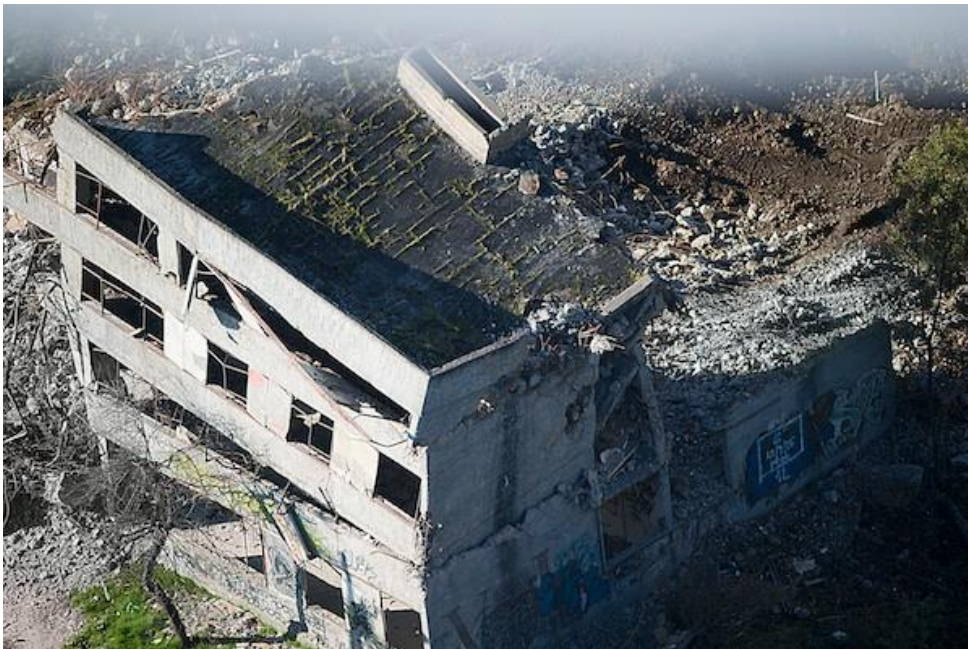
Figura 3. Villa San Luis.

Por su parte, los trabajos - aún en construcción- de Tamara Contreras utilizan la expresión abstracta para problematizar la visibilidad y la legibilidad de la Villa San Luis. La artista, activamente involucrada en la Fundación de defensa de la Villa, inició sus indagaciones en torno a este sitio mientras cursaba la carrera de artes visuales, generando un significativo archivo fotográfico que documenta minuciosamente los últimos años de ocupación de los inmuebles por parte de los pobladores, ofreciendo un lugar privilegiado al registro de la vida cotidiana de sus habitantes. Parte de estas fotografías fueron expuestas en el Museo de la Memoria y en la exposición “El derrumbe de un sueño” (2018, Espacio O), y pronto serán publicadas en formato de libro. Formada inicialmente en la pintura abstracta, Tamara ha encontrado un modo de proyectar estas inquietudes en torno a la Villa desde dicho lenguaje visual: una vibrante paleta de colores recrea estas icónicas fotografías del sitio, ofreciendo nuevos ángulos de mirada para una estructura que, como un destino inevitable, nos remite al desplome de los emblemáticos blocks (Figs. 3, 4, 5 y 6).