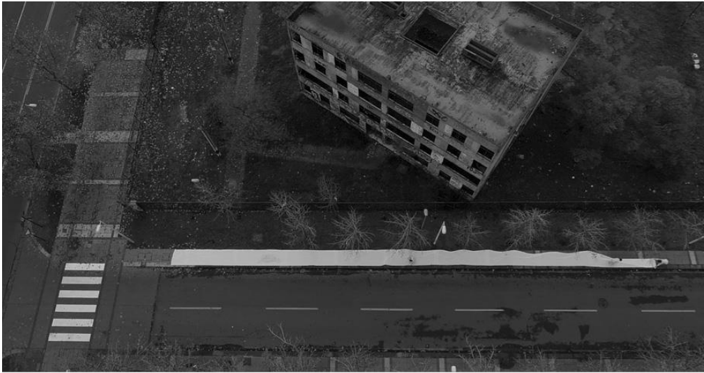
Figura 9. “Cien metros de silencio” de Colectivo Ejercicios Impermanentes (2017).