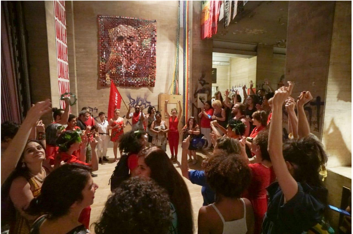
Figura 1. - Galeria ReOcupa em dia de ativação da mostra “O que não é floresta é prisão política”,2019.

No mainstream das artes visuais há uma carência das práticas que envolvem o fazer coletivo. Concorrem para isso fatores tanto intrínsecos ao fazer do artista quanto alheios ao universo da arte. Nós da comissão Executiva Atual da Galeria ReOcupa, como partícipes de um processo de criação em grupo, composto por artistas visuais que não necessariamente conviviam anteriormente, podemos nomear alguns desses fatores que são muito presentes no meio artístico ainda que não digam respeito essencialmente ao “fazer arte”. Um primeiro é a identificação (desnecessária, mas talvez intransponível) que se faz entre capacidade criadora e cristalização de subjetividades individualistas totalizantes. Outro fator é a pouquíssima prática de cidadania participativa que caracteriza nossa sociedade como um todo. Outro ainda é o imbricamento entre o assunto “arte” e o verniz social que ele normalmente carrega. Num ambiente de diferenças econômicas tão discrepantes como na cidade de São Paulo, é de se esperar um abismo maior entre a arte e a realidade social do seu entorno. Postas estas considerações, a existência da galeria ReOcupa é um acontecimento valioso para todos aqueles que buscam modos mais equânimes de troca entre a arte e a sociedade. ( Figura 1)