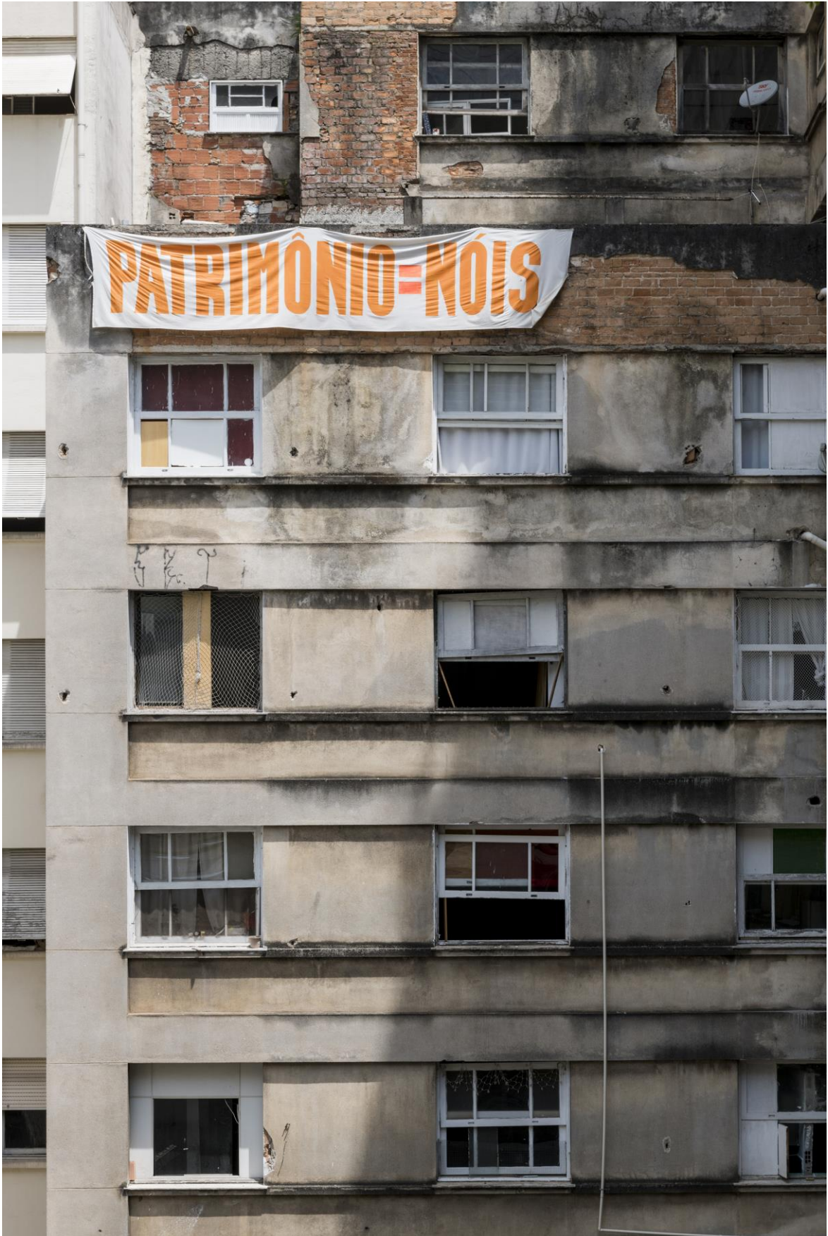
Figura 4. - "Patrimônio=nóis", Erica Ferrari, 2019. Faixa sobre a fachada da Ocupação 9 de julho por ocasião da mostra "O que não é floresta é prisão política".