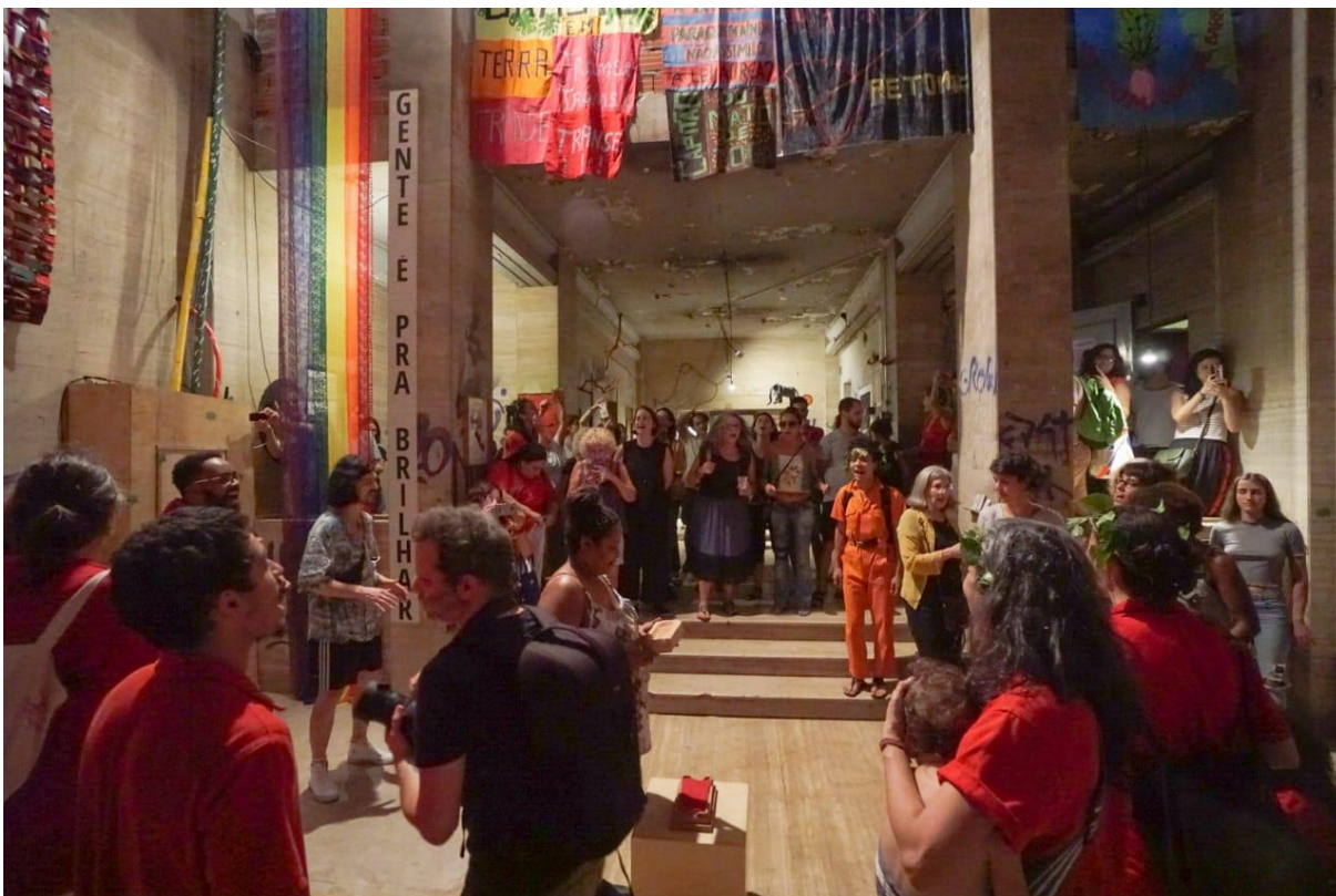
Figura 5. - Instalação da obra "Tijolo-Totem", Teat(r)o Oficina Uzyna Uzona, 2019 - deslocamento de um tijolo do edifício do Teatro Oficina para dentro da Galeria ReOcupa.