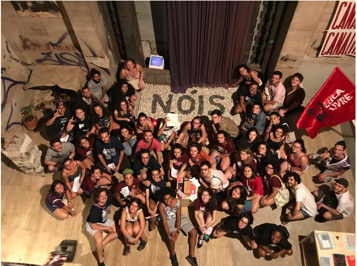
Figura 3. - Visita mediada em grupo na mostra “O que não é floresta é prisão política”,2019.

O fim da mostra coincidiu com o agravamento da pandemia da Covid-19, em março de 2020. Havia a previsão de um leilão de suas obras que foi interrompido com a eclosão do distanciamento. Outras ações dos artistas envolvidos na mostra e a condução do dia a dia da galeria foi reorientada para ações midiáticas nas redes. Algumas ações realizadas nas ruas e repercutidas nas redes e outras mais internas de colaboração entre os artistas e as ações do MSTC no combate aos efeitos da pandemia na população de baixa renda.