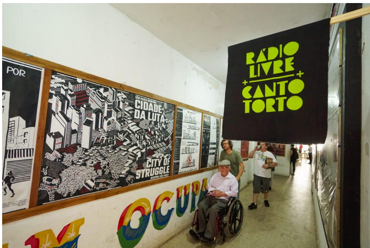
Figura 6. - Ocupação 9 de Julho – Corredor de acesso.