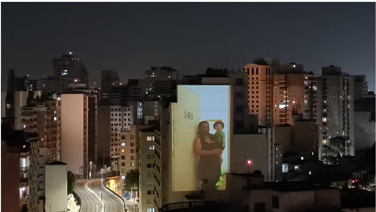
Figura 8. - "De Portas Abertas", desdobramento da instalação criada para a ReOcupa, Lucas Bambozzi ,2019.