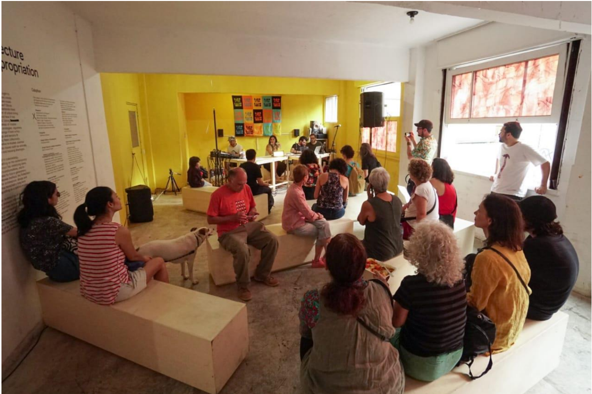
Figura 7. - Apresentação ao Vivo da Radio Livre CantoTorto.