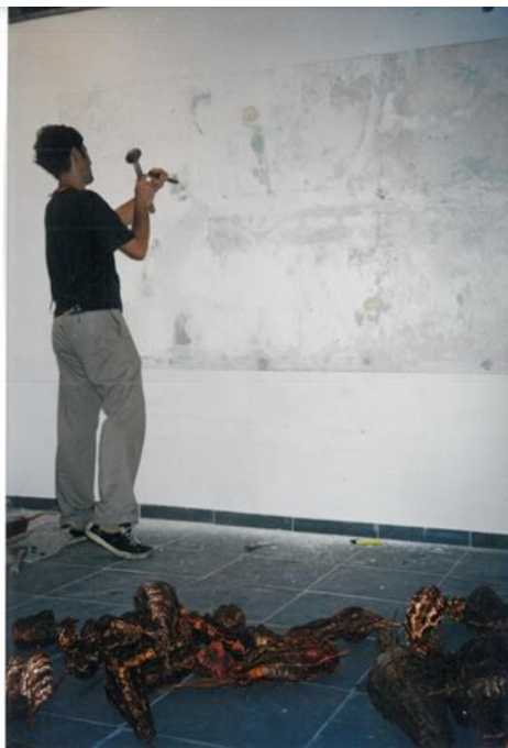
Figura 1 - João Modé, sem título, 2001, intervenção em “Orlândia”, parede descascada, prego, cabos elétricos, lâmpada e fio de veludo, aproximadamente 150 x 280cm. Arquivo do artista.

Ao visitar a casa me senti totalmente inserida naquele contexto e optei por interferir em uma das paredes com a qual mais identificava o meu trabalho, não somente pelos elementos estruturais, mas também pelo seu formato retangular. Estes foram dados determinantes para eu trabalhar considerando um plano pictórico e, em seguida, associar este espaço ao tempo em que a casa serviu como bar e show. O título Palco foi inevitável (MUGLIA, 2019 apud EILERS, 2019, p. 85, v.2).