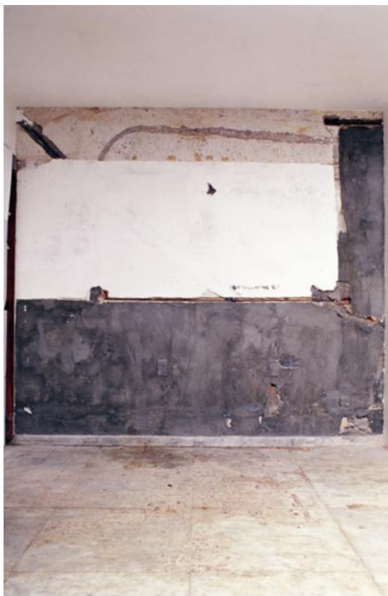
Figura 2 - Ana Múglia, "O Palco", 2001, intervenção sobre parede, tamanhos variáveis.