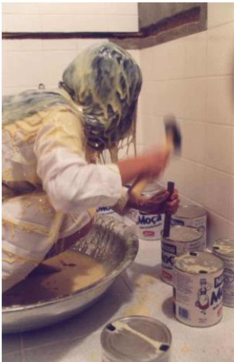
Figura 4 - Márcia X, “Pancake”, 2001, Performance.

performance “Pancake” (2001), que se transformou em um dos marcos da trajetória da artista e foi reexibida em diversas ocasiões. Só entre 2001 e 2002, Márcia repetiu o gesto de se jogar uma dúzia de latas de leite condensado e peneirar sacos de confeito sobre a cabeça, pelo menos seis vezes, incluído o “Panorama da Arte Brasileira”, no MAM/SP, a “Bienal do Mercosul” e o “Panorama da Arte Brasileira”, no MAM/BA (X, 2002).