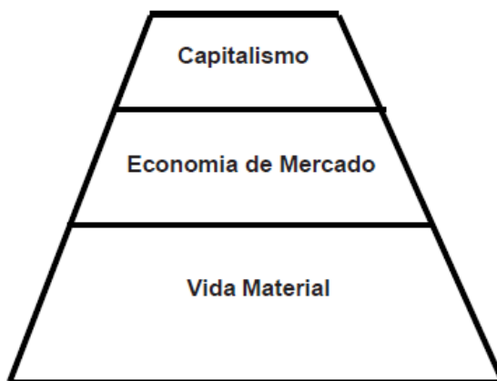
Figura 1 – A tripartição da sociedade capitalista segundo Braudel