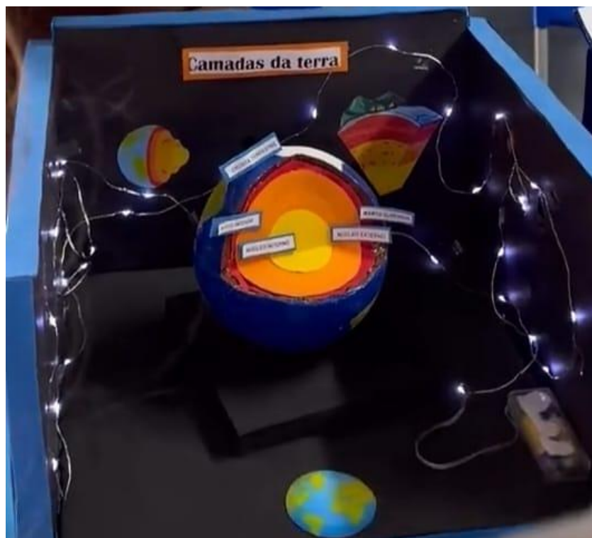
Figura 2 – Maquete da estrutura interna da Terra.