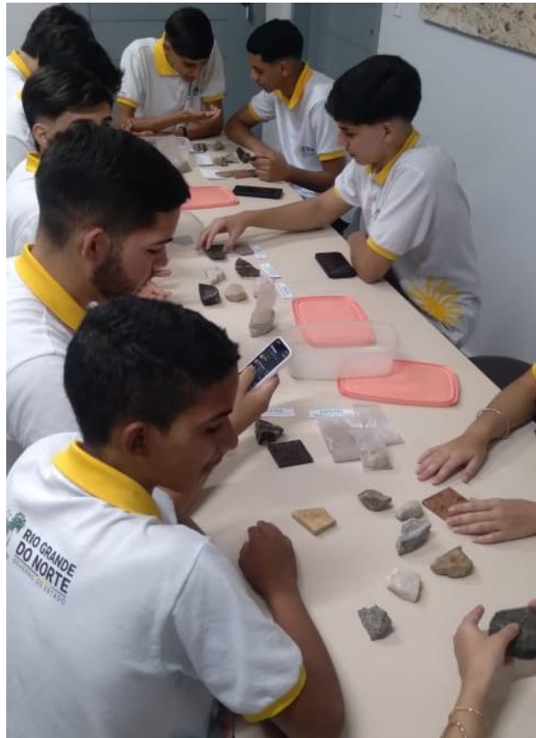
Figura 6 – Estudantes participando da oficina de rochas, no Museu de Minérios do RN.

aprendem que uma simples pedra de praia conta a história de montanhas antigas, oceanos que secaram ou vulcões que entraram em erupção há eras.