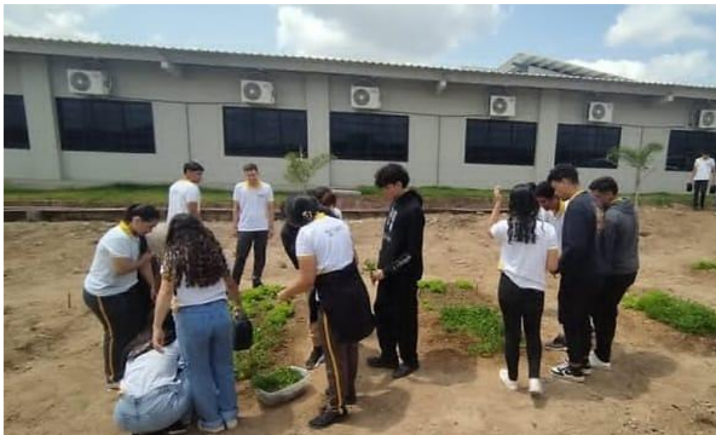
Figura 4 – Estudantes fazendo a colheita na horta escolar.