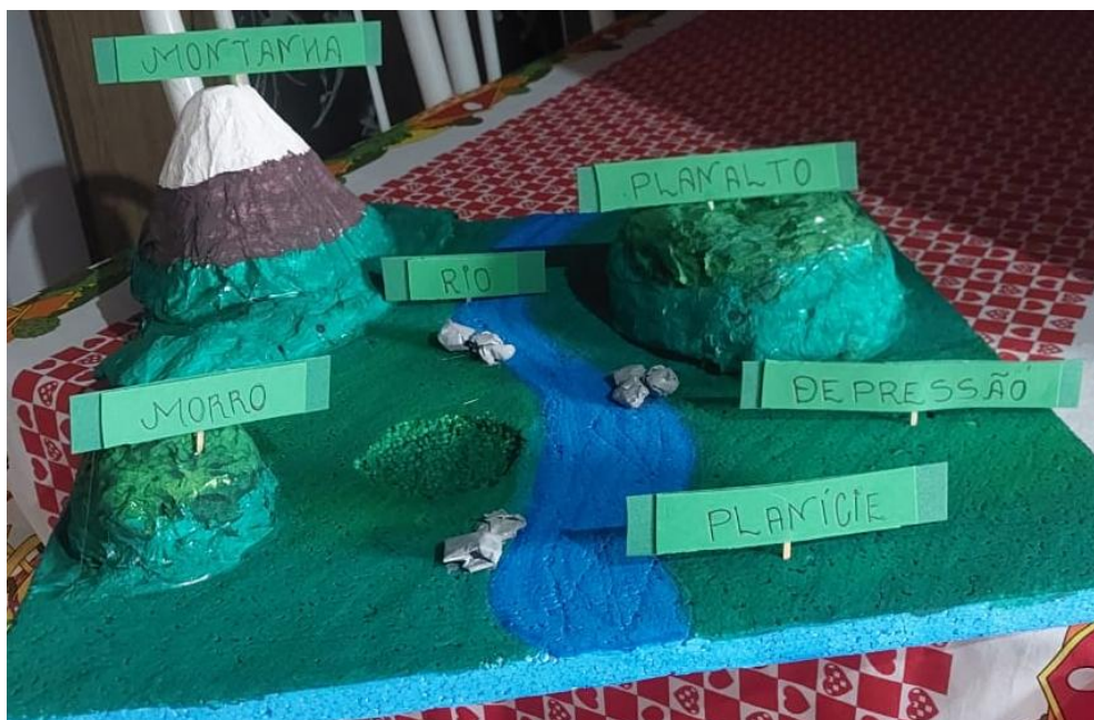
Figura 3 – Maquete das formas de relevo continental.