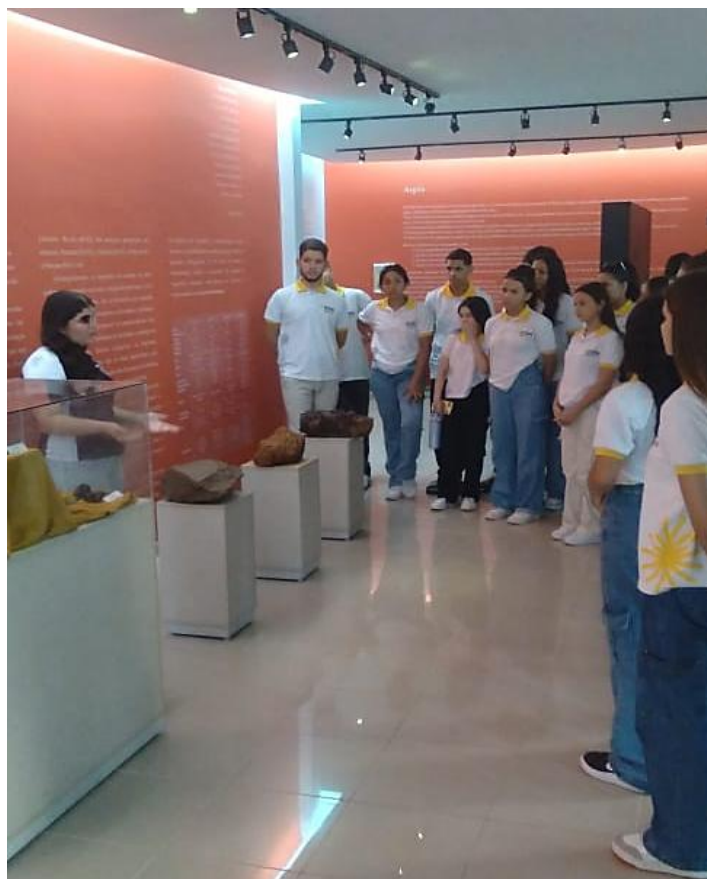
Figura 5 – Visita guiada ao Museu de Minérios do Rio Grande do Norte.

Grande do Norte se destacar no cenário mundial. Além dessas, ainda visitamos outras salas, onde pudemos ver fragmentos de ferro, ouro, calcário e diversos outros tipos de amostras de rochas ígneas (granitos e basalto), metamórficas (gnaisses, xistos, quartzitos) e sedimentares (calcário, conglomerado, arenito e argilito).