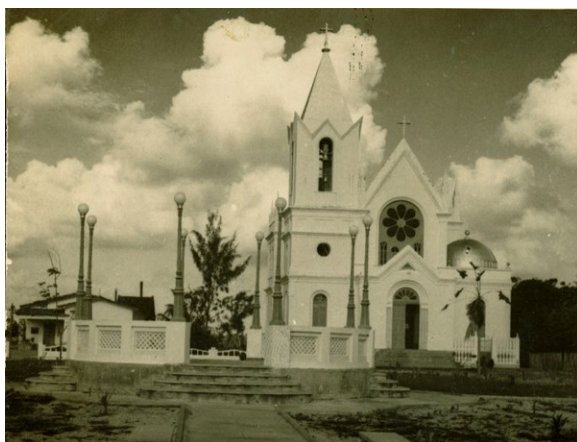
Figura 3a: Igreja Matriz de São Boa Ventura, Canavieiras-BA, [19...].

geralmente, compostos de colunatas (sequência de colunas), frontões (conjunto arquitetônico de forma triangular que decora normalmente o topo da fachada principal de um edifício) e escadarias (SOUZA, 2012).