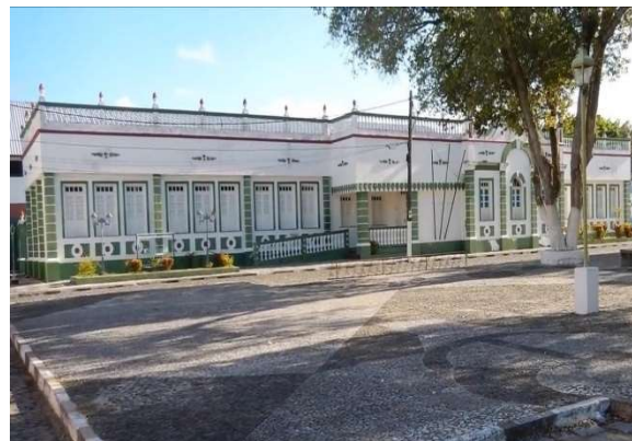
Figura 6b: Secretaria Municipal de Educação, Canavieiras-BA, 2019.

É possível perceber nas Figuras 6a e 6b que no entorno do prédio o padrão do calçamento da praça continua o mesmo e que a árvore não foi removida, ela se desenvolveu, seu crescimento é perceptível. Mas nesse ponto pode-se destacar que tanto a função quanto a forma do prédio nessa paisagem foram modificados, onde agora funciona um espaço público destinado a gerir todo o sistema de ensino de Canavieiras.