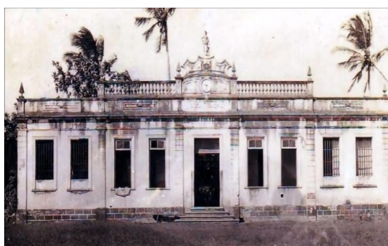
Figura 4a: Cadeia Municipal, Canavieiras-BA, [19...].

A biblioteca está localizada na Praça da Bandeira e seu prédio inicialmente tinha outra função, era a Cadeia Municipal. Schommer e França Filho (2011) contam que assim como a Igreja Matriz de São Boa Ventura o prédio da Cadeia Municipal (Figura 4a) foi construído em estilo neoclássico. Inicialmente, o projeto era para a construção de câmara e cadeia, como era o costume da época, mas o projeto elaborado pelo Engenheiro Morales de los Ríos foi adaptado para ser apenas cadeia.