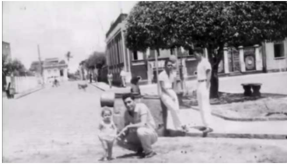
Figura 7a: Praça 15 de novembro, Canavieiras-BA, [19...].