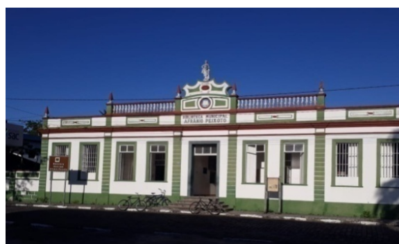
Figura 4b: Biblioteca Municipal, Canavieiras-BA, 2019.