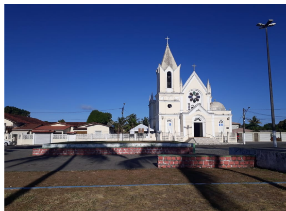
Figura 3b: Igreja Matriz de São Boa Ventura, Canavieiras-BA, 2019.

Na Figura 3a se vê a Igreja em uma foto tirada no mesmo século de sua construção. Percebe-se a presença de um coreto em frente a ela. Na Figura 3b verifica-se que a estrutura da Igreja permanece a mesma, bem como a sua função, porém, o coreto já não existe mais.