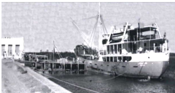
Figura 10a: Cargueiro Camacan, Porto de Canavieiras-BA, [19...].

O 8º e último ponto é o Porto de Canavieiras (Figuras 10a e 10b), localizado no Sítio Histórico Paulo Souto, um dos principais pontos turísticos do município. Durante o século XX esse Porto recebia diversos navios, entre outras embarcações, como pode ser observado na Figura 10ª. Com o tempo essa atividade foi ficando cada vez mais escassa e atualmente navios já não aportam mais em Canavieiras, mas há o tráfego de embarcações menores, como barcos pesqueiros, canoas, lanchas para transporte e lazer.