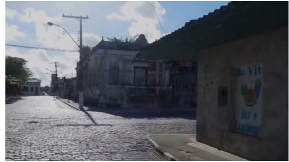
Figura 7b: Lanchonete Mc Vitta, Canavieiras-BA, 2019.

Verifica-se nesse ponto de parada um espaço público, importante local de encontro e lazer gratuito dos moradores do município, que hoje não existe mais. No lugar da praça foi construído um ponto comercial, no qual funciona uma lanchonete (Figura 8b) frequentada apenas por clientes desse estabelecimento, ou seja, pessoas com poder aquisitivo para consumir na lanchonete, podendo assim usufruir deste espaço.