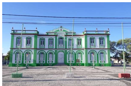
Figura 5b: Paço Municipal, Canavieiras-BA, 2019.

Ao se observar a fotografia do Paço Municipal no século XX (Figura 5a) em comparação com a fotografia do Paço Municipal atualmente (Figura 5b) percebem-se modificações em seu entorno: o calçamento, a retirada de algumas árvores, novo sistema de iluminação, e suportes para hastear bandeiras; em suma, a infraestrutura foi modificada para se adequar aos modelos atuais, mas o prédio conserva mesma forma e função. Construído para abrigar o poder público municipal, representa um lugar de grande importância para a cidade de Canavieiras e seus habitantes, pois é onde trabalha o prefeito da cidade, representante eleito pela população do município.