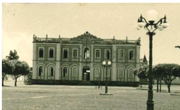
Figura 5a: Paço Municipal, Canavieiras-BA, [19...].

O 3º ponto da aula de campo será no Paço Municipal (Figuras 5a e 5b), localizado na Praça da Bandeira, funcionando até os dias atuais. De acordo com Schommer e França Filho (2011), a planta do prédio também foi elaborada pelo engenheiro Morales de los Ríos, em estilo neoclássico, mas o projeto foi refeito e adaptado à realidade econômica do município. A construção foi autorizada pela Lei Municipal nº 52, de 14 de setembro de 1898 e a obra foi oficialmente concluída em 30 de novembro de 1899.