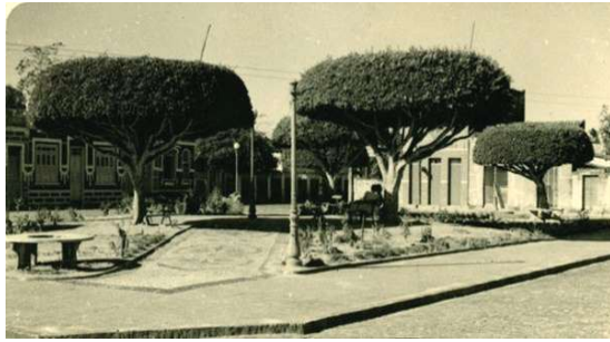
Figura 9a: Praça Dr. João Pessoa Canavieiras-BA, [19...]. Fonte: IBGE (2017).