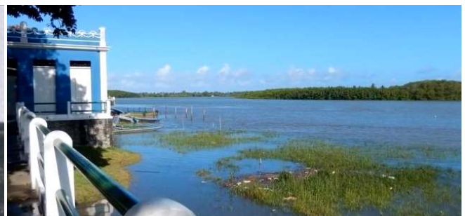
Figura 10b: Porto de Canavieiras- BA, 2019.