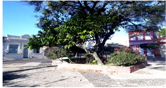
Figura 9b: Praça do Cacau, Canavieiras-BA, 2019.

Já nas mudanças em sua estrutura física destacam-se a construção de canteiros com bancos acoplados, para que as pessoas possam se sentar em seus momentos de lazer, o plantio de cacaueiros fazendo jus ao novo nome da praça e elevando a representatividade de um dos símbolos que marcaram a história do município, além de oferecer sombra para o descanso e contribuir para o bem estar nesse espaço.