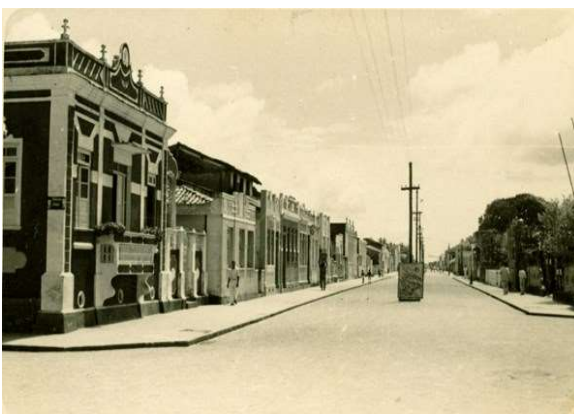
Figura 8a: Avenida Coronel Augusto Luiz de Carvalho, Canavieiras-BA, [19...].

O 6º ponto a ser visitado é o casarão (Figuras 8a e 8b) localizado na esquina da Avenida Coronel Augusto Luiz de Carvalho. Segundo Schommer e França Filho (2011), em sessão do Conselho Municipal, de 08 de julho de 1912, foi proposta a denominação da avenida em homenagem ao Coronel da Guarda Nacional, que foi também presidente da Câmara Municipal, ainda no período do Império, e presidente do Conselho Municipal que substituiu a Câmara na primeira República, por várias vezes, e duas vezes intendente municipal (1899-1904 e 1909-1911). Durante cerca de 20 anos foi figura proeminente nos destinos do município.