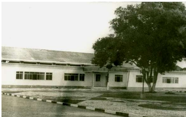
Figura 6a: Fórum de Canavieiras-BA, [19...].

O 4º ponto, também localizado na Praça da Bandeira, é o prédio onde antes funcionava o Fórum da cidade, sediando o poder judiciário (Figura 6a), que deu lugar à atual Secretaria Municipal de Educação (Figura 6b).