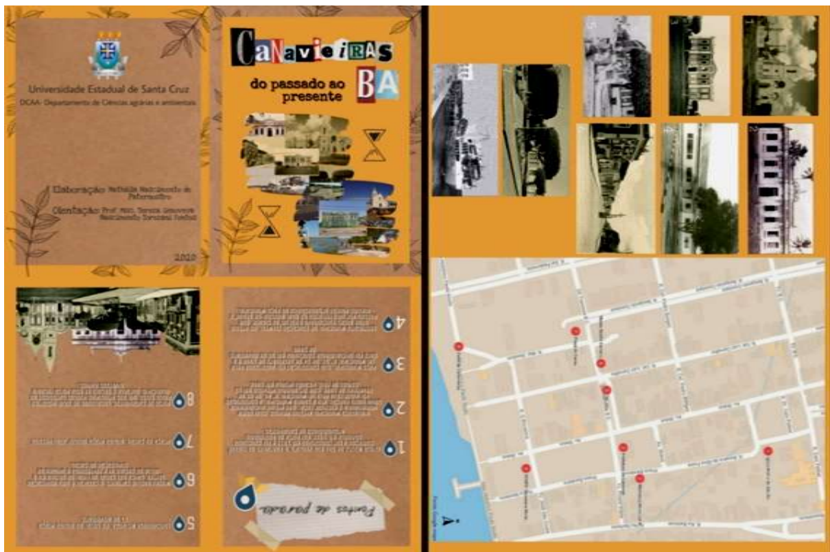
Figura 11: Folder para aula de campo na cidade de Canavieiras-BA (frente e verso, respectivamente).