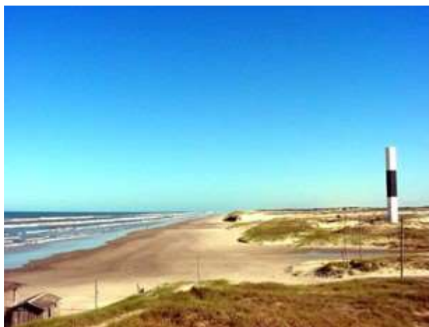
Fig 4 - (a) Vista para sul a partir da praia de Dunas Altas, local com dunas frontais bem desenvolvidas, (b) Farol da Conceição tombado, lado esquerdo. O farol foi construído em 1929, e substituído por uma nova estrutura, lado direito (TOLDO et al. , 2013).

(trechos com erosão), e também, os sumidouros de sedimentos arenosos (trechos com deposição), (TOLDO et al. 2013, MOTTA et al. 2014).