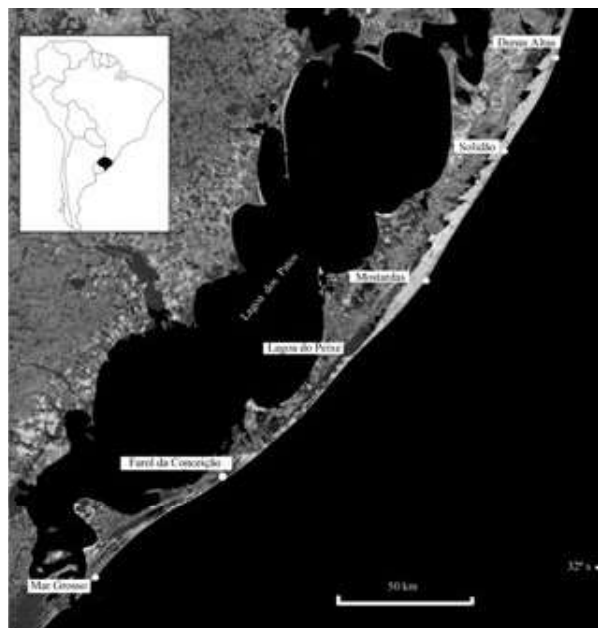
Fig 1 - Localização da área de estudo ao longo do litoral médio do estado do Rio Grande do Sul numa extensão aproximada de 275 km (modificado de TOLDO et al. , 2013).

Para a identificação da LPM na região de estudos há necessidade de integrar os estudos de geologia costeira ao sistema Geodésico Brasileiro. Neste trabalho adotou-se como Sistema Geodésico Brasileiro o SIRGAS - 2000, Sistema de Referência Geocêntrico para as Américas.