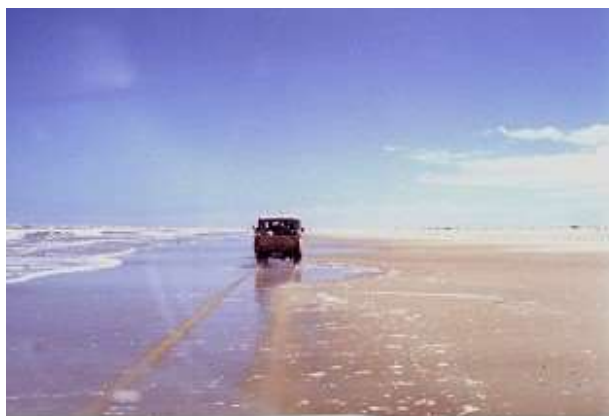
Fig. 3 - Levantamento da linha de praia com sistema de posicionamento global – GPS, fixado num veículo que se desloca ao longo da linha de água associada ao espraiamento da onda (TOLDO & ALMEIDA 2003).

Entre todos os indicadores possíveis de serem empregados na área de estudo, a linha da água é o mais prático, principalmente, por causa de sua continuidade e também porque se constitui num indicador que possibilita a repetição das medidas. Segundo MORTON E SPEED, (1998, apud . PAJAK E LEATHERMAN, 2002), a principal desvantagem é que a linha não é um indicador morfológico. E, também, é um indicador que não mantém o mesmo plano horizontal ao longo do tempo. As principais imprecisões decorrentes desse método estão associadas à amplitude das marés astronômica e meteorológica, ao run up da onda e as variações da declividade da face praial.