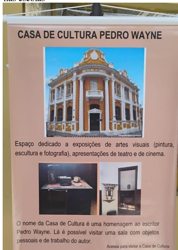
Imagem 1 – Banner produzido para o evento nas escolas

Nesse horizonte, as imagens seguintes mostram como os recursos tecnológicos foram empregados, sendo que a Figura 1 apresenta um dos banners construídos para mostrar o espaço cultural na escola e a Figura 2 apresenta o jogo de quebra-cabeças produzido na impressora 3D da universidade.