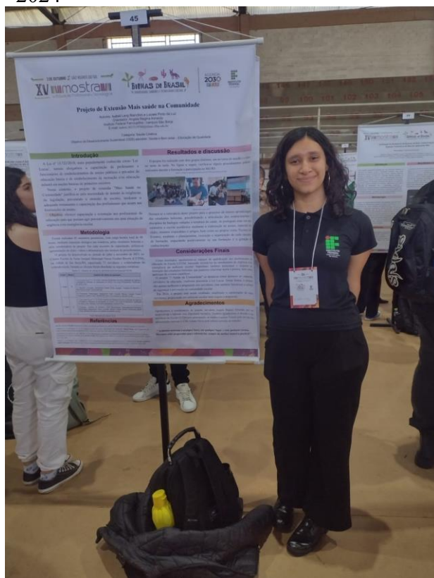
Figura 5 – Participación en la XV Mept, en 2024