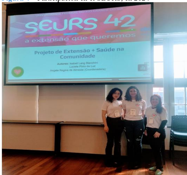
Figura 4 – Participación en el SEURS, en 2024