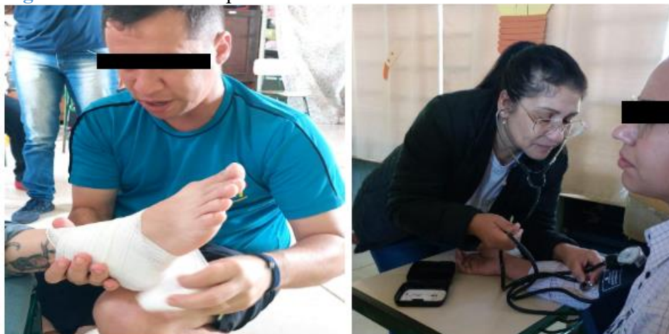
Figura 2 – Talleres de capacitación realizados en la escuela Cetim