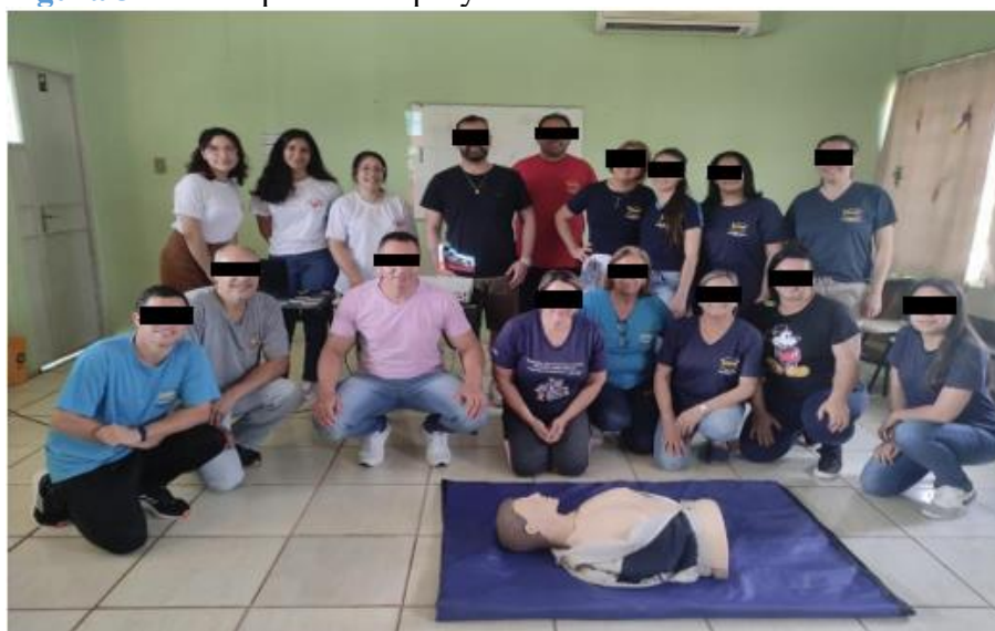
Figura 3 – Participantes del proyecto en la escuela Cetim