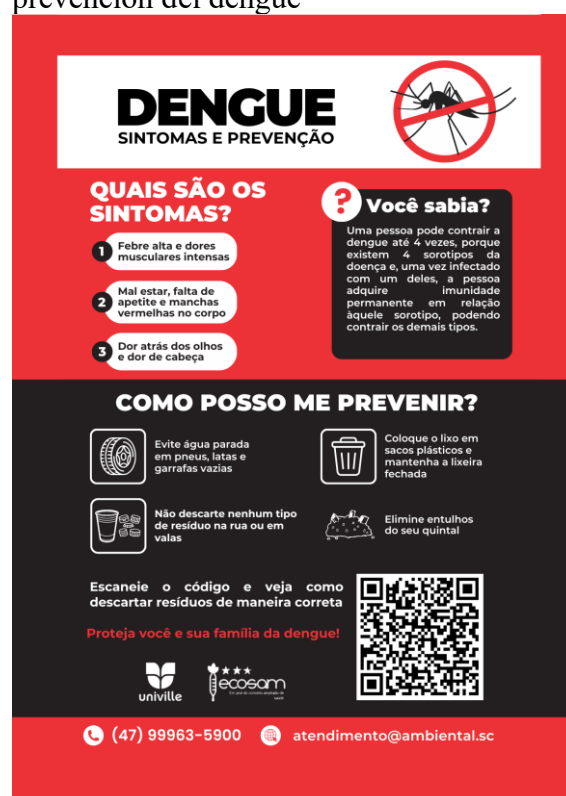
Figura 3 – Folheto sobre los síntomas y prevención del dengue