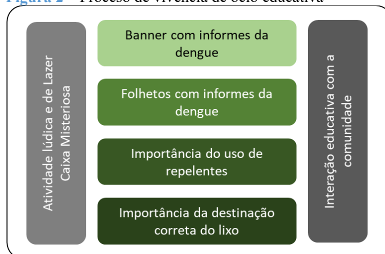
Figura 2 – Processo de vivencia de ocio educativa