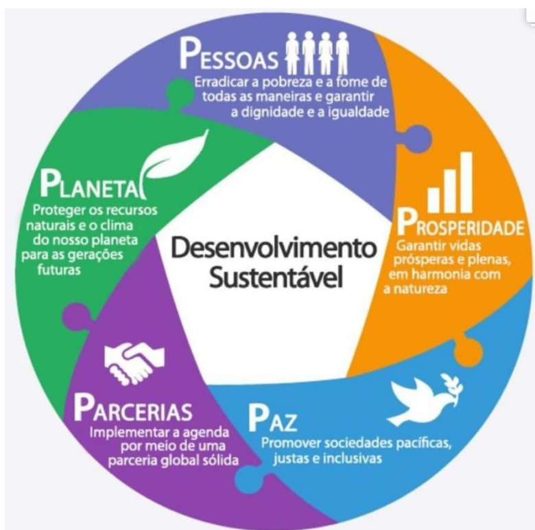
Figura 1 – Objetivos de Desarrollo Sostenible (ODS) y sus impactos directos