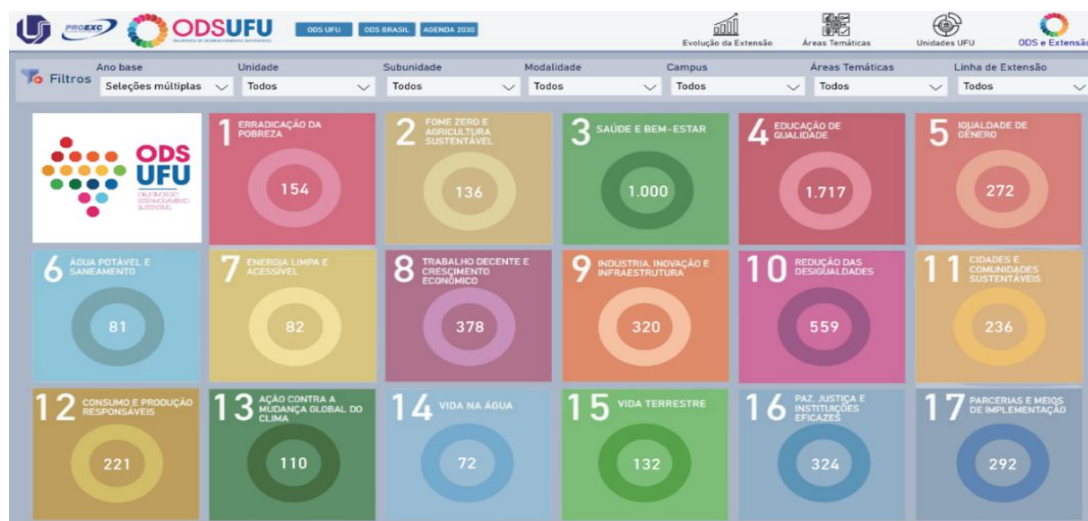
Figura 5 – Quantidade de ODS impactados no desenvolvimento das atividades de extensão da UFU no ano 2023