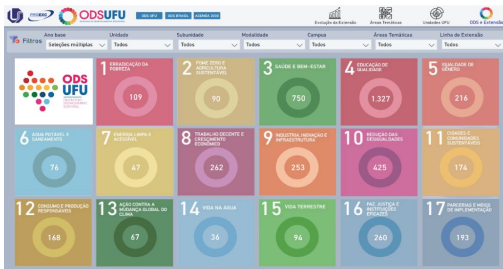
Figura 4 – Quantidade de ODS impactados no desenvolvimento das atividades de extensão da UFU no ano 2022