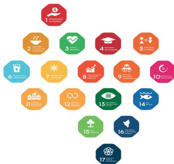
Figura 7 – Nuestrs esfuerzos acercándonos a nuestra misión