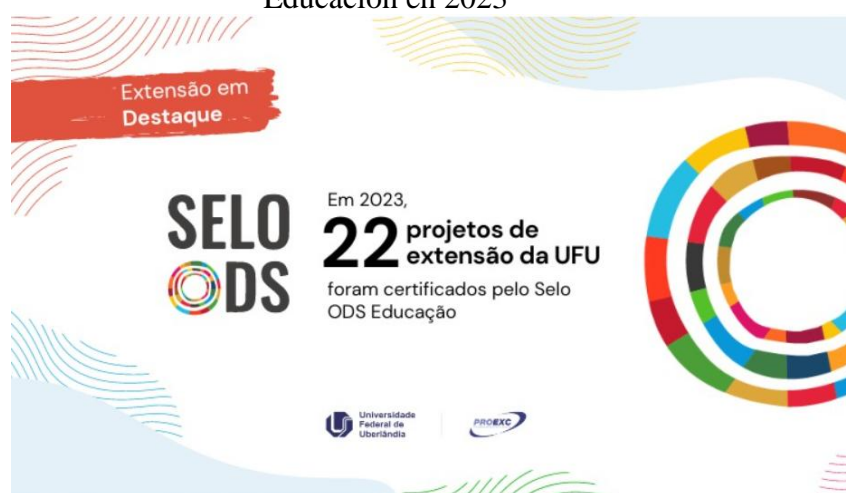
Figura 6 – Resultados de la Extensión UFU en la certificación del Sello ODS Educación en 2023