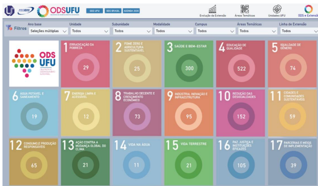
Figura 3 – Quantitativo de ODS impactados en el desarrollo de las actividades extensionistas UFU en el año 2021