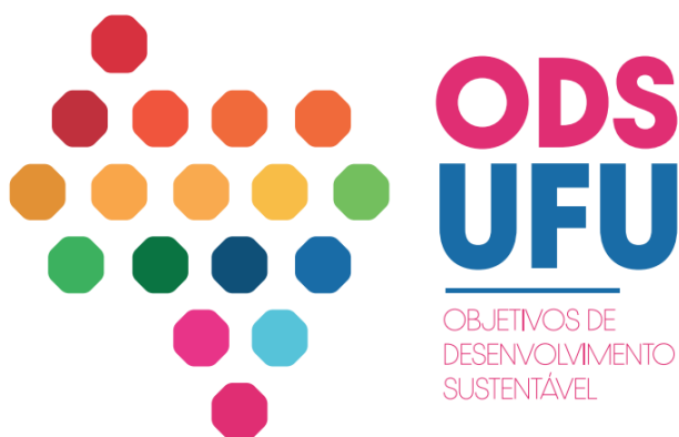
Figura 2 – ODS UFU

La Extensión UFU, con el objetivo de trabajar en la internacionalización de la extensión de la institución en sinergia con los ODS, ha estado intensificando sus acciones hacia el propósito de promover, de forma articulada y en red, la inserción de los ODS en las actividades de extensión de la Institución, asociadas con la enseñanza, la investigación y la gestión institucional.