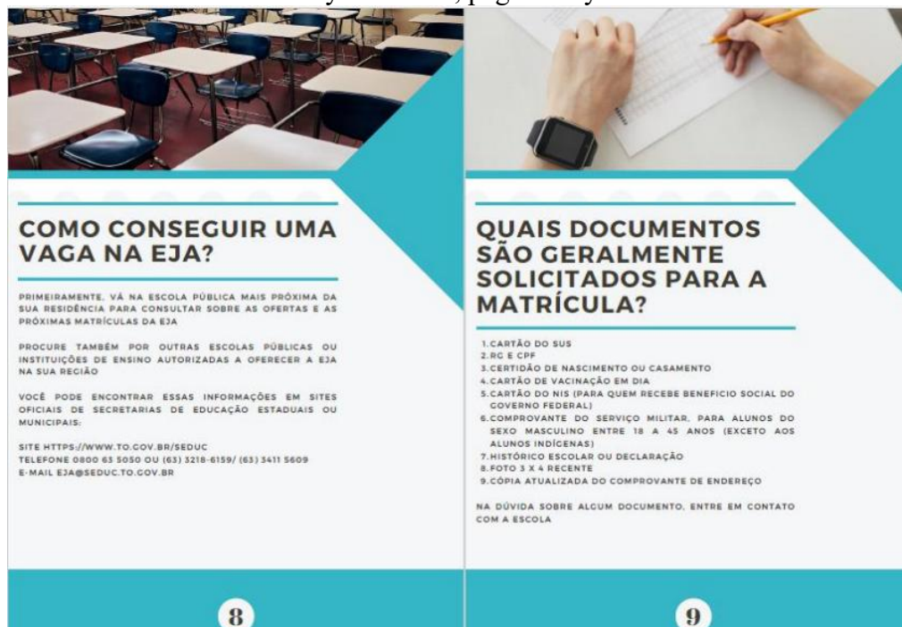
Figura 5 – “Cartilla del Adulto Mayor – EJA”, páginas 8 y 9