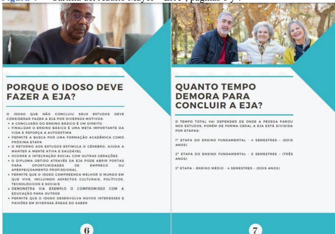
Figura 4 – “Cartilla del Adulto Mayor – EJA”, páginas 6 y 7