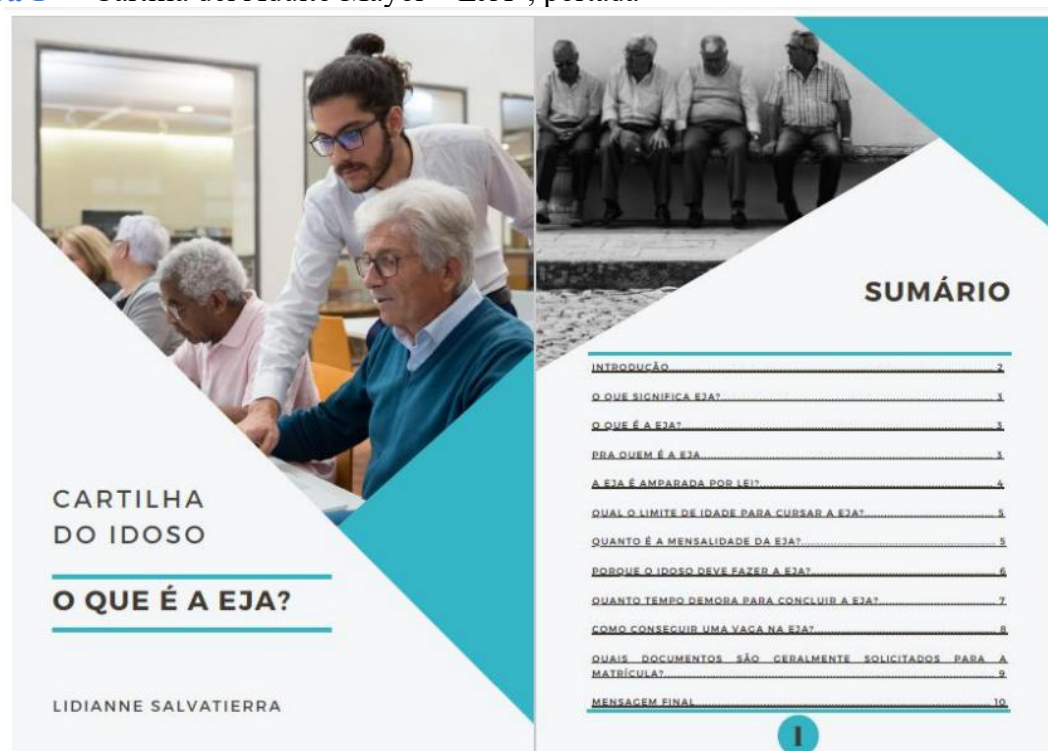
Figura 1 – “Cartilla del Adulto Mayor – EJA”, portada

La necesidad de acciones más dirigidas a la población adulta mayor, especialmente en el ámbito universitario, debe partir de la comprensión de que este grupo enfrenta desafíos específicos. De esta forma, el enfoque de estas iniciativas debe ser diferenciado. Estas acciones deben, en particular, enfatizar la valorización y el reconocimiento social de la persona mayor, destacando su importancia en el proceso educativo brasileño.