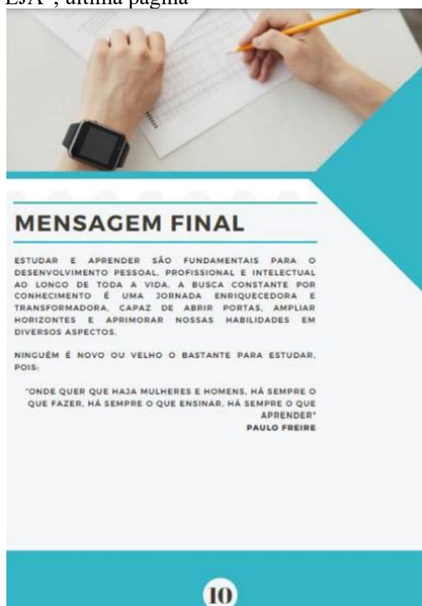
Figura 6 – “Cartilla del Adulto Mayor – EJA”, última página