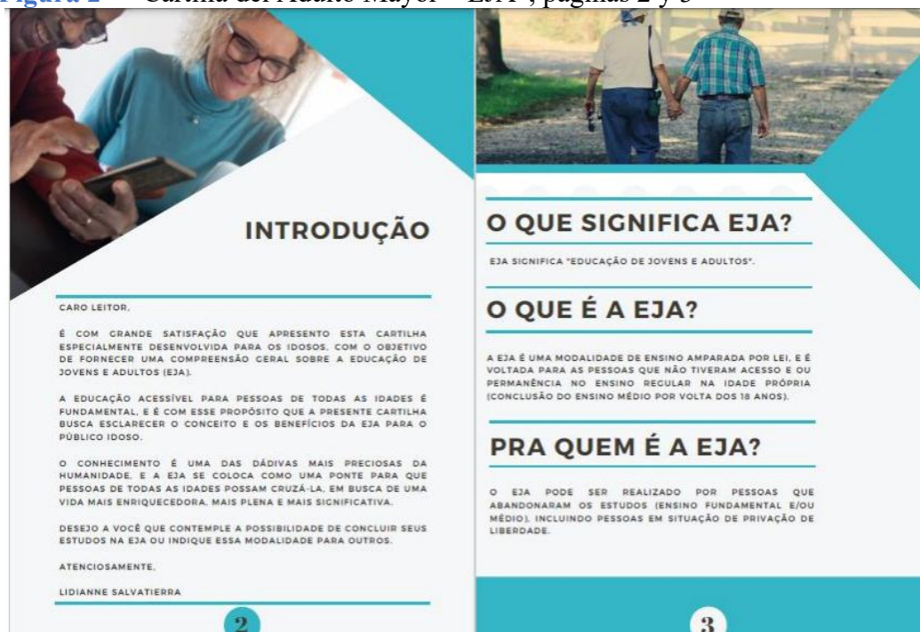
Figura 2 – “Cartilla del Adulto Mayor – EJA”, páginas 2 y 3