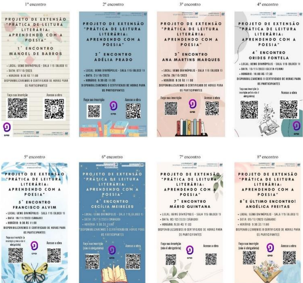
Figura 1 – Artes de divulgação de los encuentros