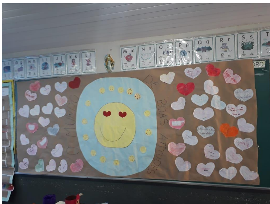
Figura 3 – Cartaz ”Um mundo de boas atitudes”

Fonte: Alunos de uma escola pública do Estado de Minas Gerais.