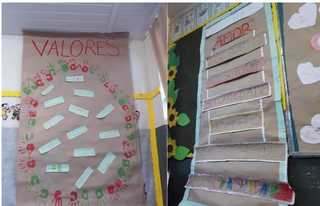
Figura 4 – Segundo Cartaz: Valores e Terceiro Cartaz: Pirâmide dos Valores