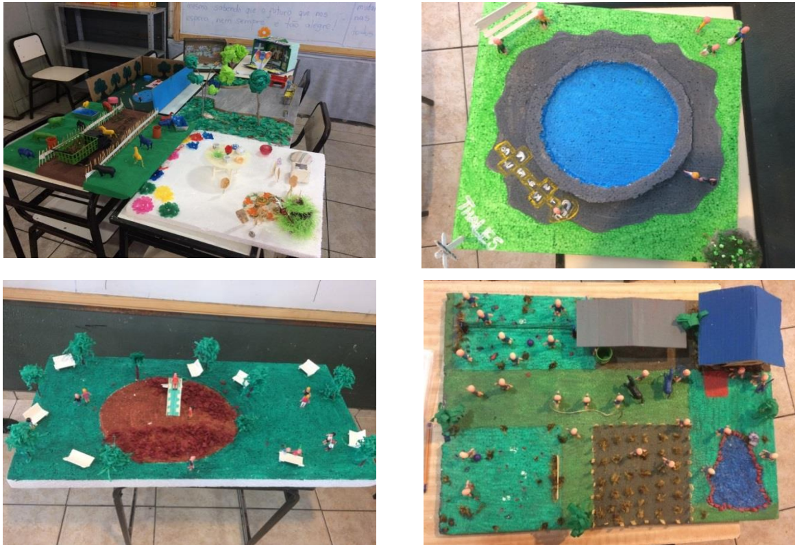
Figura 5 – Maquetes: Valores e Direitos