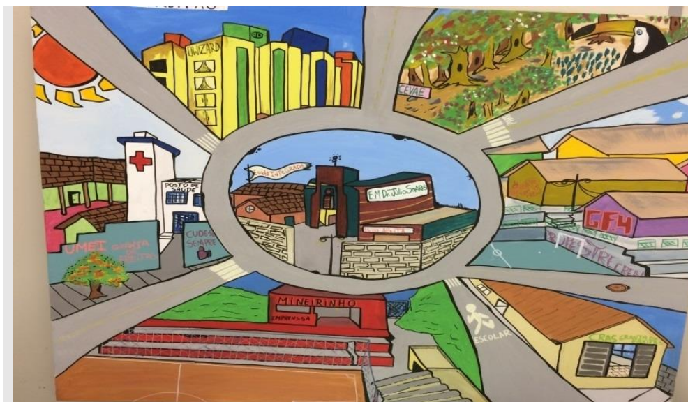
Figura 2 – Painel Cartográfico da escola com a comunidade local e equipamentos parceiros