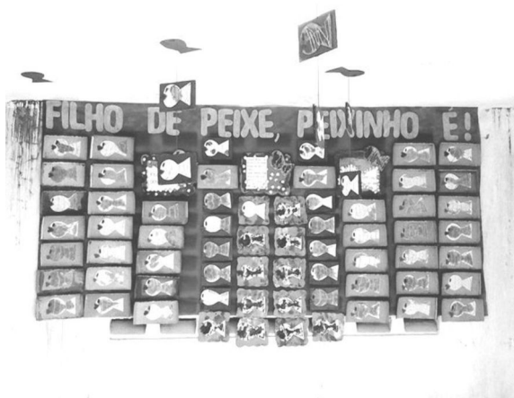
Figura 1 – Painel confeccionado com sucata em comemoração ao Dia dos Pais feito por crianças com idades entre três e cinco anos.

Vejamos algumas atividades de artes produzidas por crianças com idades entre três e seis anos, no município de Caucaia, onde se realizam as práticas de ensino dos professores de atividades interdisciplinares: