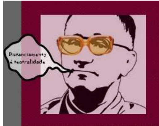
Figura 9 - Fotomontagem da autora.