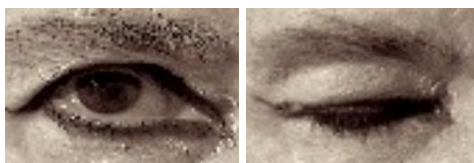
Figura 6 - Deu pra compreender?

Como Evreinov observa, esta transformação pode ter lugar todos os dias na vida. Sobre esse ponto, o limite entre o teatro e a vida cotidiana é mínimo. Desta forma a teatralidade é definida num sentido mais amplo e democratizado: compreende a antropologia, a etnologia, a psicologia. Na tentativa de unir teatralidade e cotidiano, Evreinov arriscou fazer desaparecer o que existe de específico na teatralidade cênica (já que coloca a teatralidade no cotidiano); mas, procedendo desta forma, confere ao termo teatralidade uma grandeza que merece ser explorada. Evreinov percebeu que a teatralidade, antes de ser um fenômeno teatral, é uma propriedade transcendental que pode ser percebida sem que haja necessidade de passar pelo estudo empírico das diversas práticas teatrais. Ufa!!