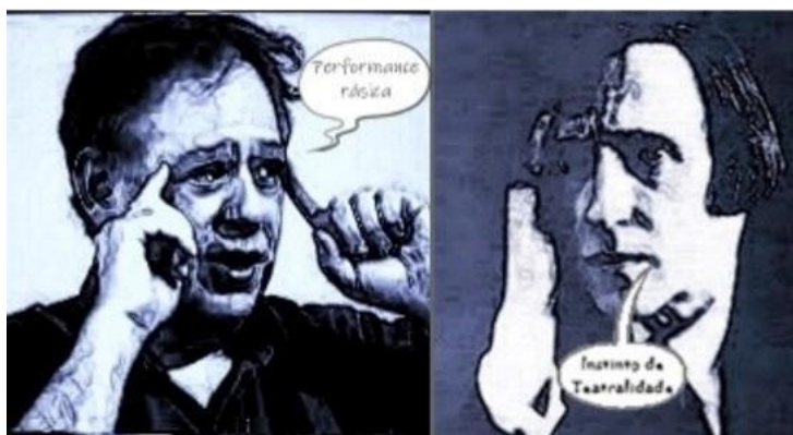
Figura 7 - Richard Schechner e Nicolai Evreinov.

Fonte: Montagem feita pela autora a partir de imagens sem direitos autorais, 2025.