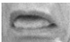
Figura 3 - Repugnante!