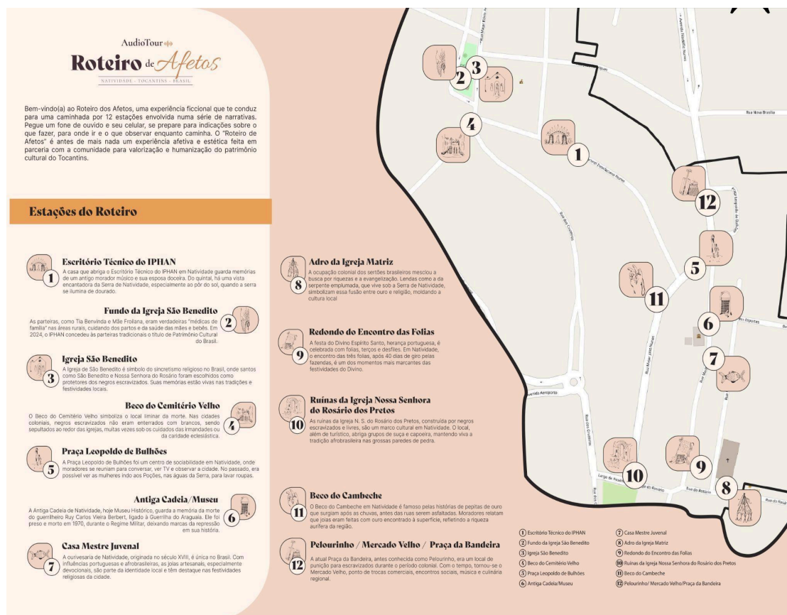
Imagem 1: O território demarcado

aquele em que as ideias circulam em forma de fluxo e fricção entre pessoas com formações diferentes, provocando a ruptura com as categorias estabelecidas. Os relatos se tornam índices de singularidade. O que pode a escrita da vida? Análogos à dramaturgia, esses relatos são divididos em cenas (dinamismos espaço-temporais) dentro de um ato. Ao invés de seguir uma linha reta (como um caminho pré-determinado), o texto cria linhas de fuga, abrindo novos trajetos e possibilidades de pensar o vivido. A escrita tenta dramatizar a experiência pela articulação de diferentes campos de investigação, as artes e a antropologia. Tal como aponta Deleuze (2006, p. 134) é o conhecimento científico, mas é também o sonho, e são também as coisas em si mesmas que dramatizam.