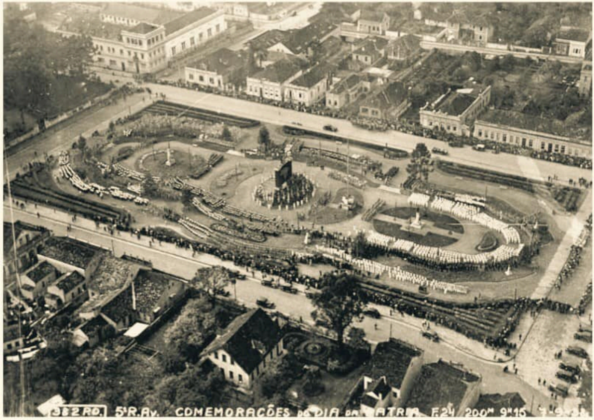
Praça Santos Andrade em 1938, durante festejos de comemoração do Dia da Pátria. Foto: João Batista Groff 6 .

Benedict Anderson (2008) aponta que o nacionalismo é uma invenção dos Estados-nação modernos, forjada a partir dos interesses políticos da burguesia de instituir a ideia de um povo único num domínio territorial. Assim, dentro da concepção nacionalista há uma unidade idealizada que apaga as desigualdades decorrentes das divisões em classe gênero e raça.