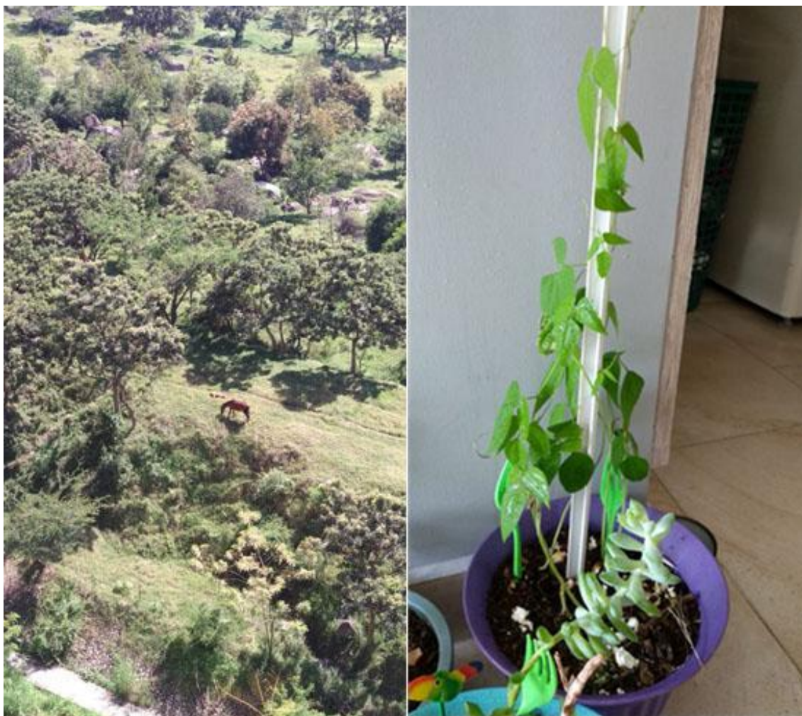
Imagen 2. Interior-exterior como pliegues de la casa-diagrama

No es posible olvidar que, desde la infancia más temprana, hasta la adultez, siempre hubo momentos en los que lo que se veía por la ventana era más interesante que lo que ocurría dentro de la sala de aula. Quizás porque la ventana es el lugar de los posibles, de las fabulaciones, mientras que la sala de aula es el lugar de los deberes y las adecuaciones.