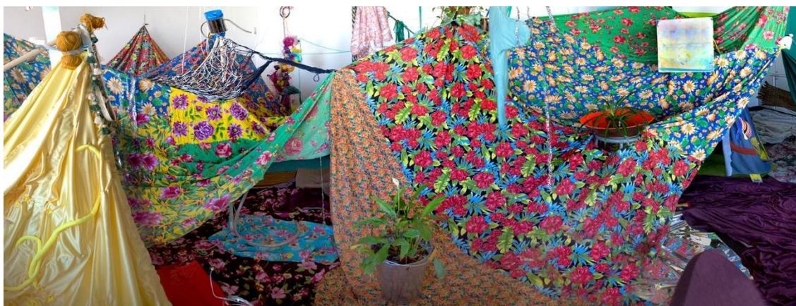
Imagen 3. Sala de aula como proceso y obra por hacer

Esta imagen, que muestra la sala de aula del SenseLab – Laboratorio de pensamiento en movimiento de la Universidad de Concordia en Canadá. 12 Pensar en cómo la sala de aula, no es y en todo caso acontece. Es decir, no es un lugar dado, mas, sí un lugar que constantemente se está re-creando a partir de los pliegues que se disponen en los co-aprendizajes entre agencias humanas y más que humanas. La sala de aula como el espacio emanado y secretado por el