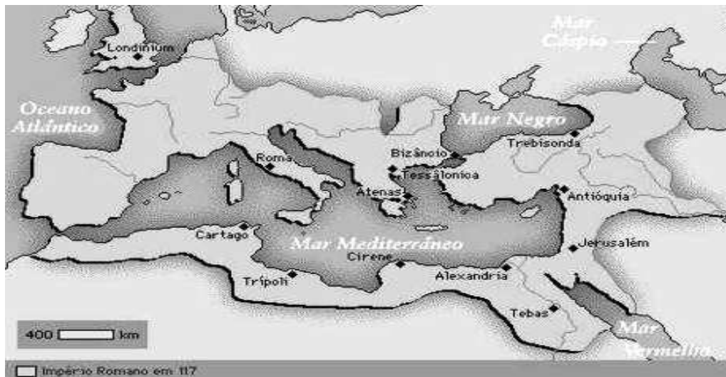
(Imagem 1: Mapa que mostra toda a România ou o Império da Roma antiga.)

România equivale a todo o Império Romano: Roma e todas as regiões conquistadas. É importante, neste momento, fazermos uma distinção entre România Atual e România Perdida . Para Marinho (2009), a primeira corresponde às regiões do mundo onde se falam língua neolatina, nesse aspecto, segundo o autor mencionado, a América do Sul não faz parte do Império Romano, mas está inserida na România Atual, devido ao fato de uma extensa maioria de seus habitantes falar português ou espanhol. A segunda, por sua vez, corresponde à parte do Império que não preservou a tradição da língua latina, como é o caso da Grã-Bretanha que fala inglês, língua essa derivada do tronco germânico.