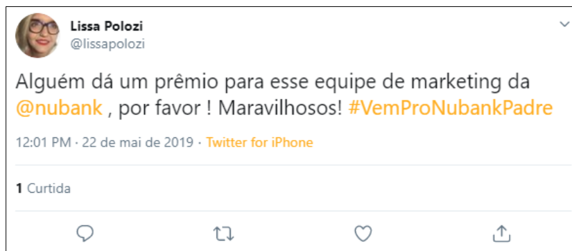
Figura 02 – Tweet elogiando a campanha da Nubank