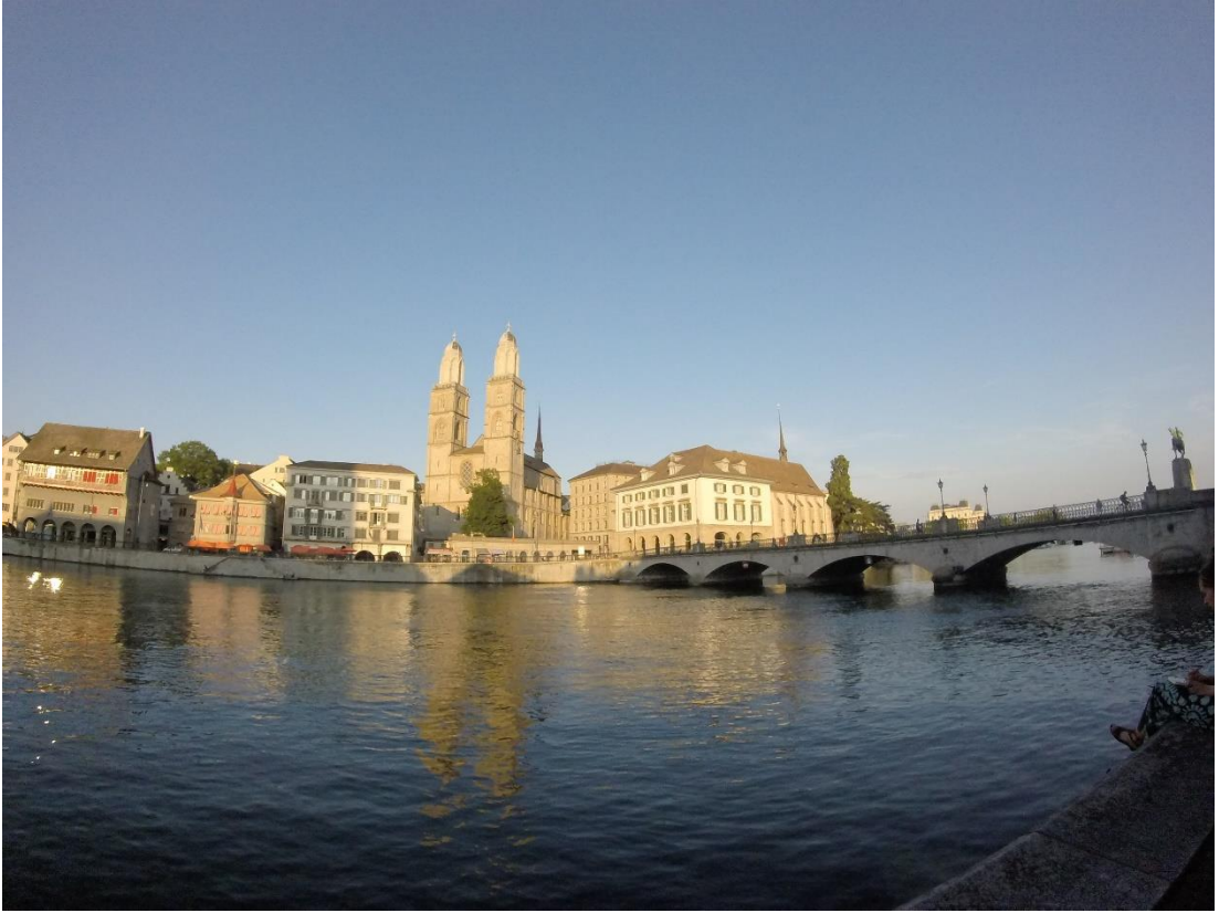
Lago Zurique, Zurique. 2015