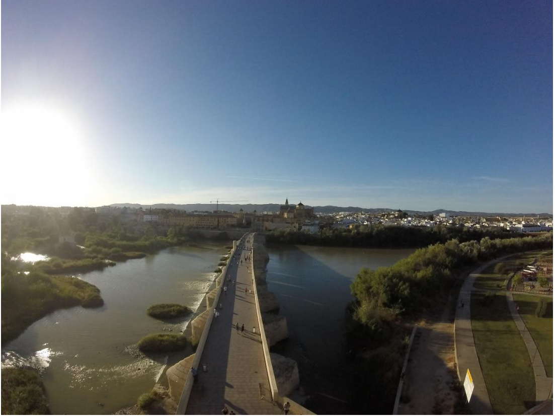
Rio Guadalquivir, Cordoba. 2016.