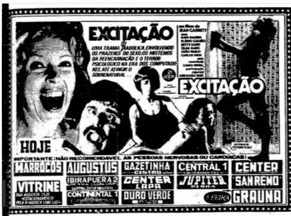
Figura 1. Tijolinho de divulgação de “Excitação” (1976).

No centro do anúncio (Figura 1) se lê: “Uma trama diabólica envolvendo os prazeres do sexo, os mistérios da reencarnação e o terror psicológico na era dos computadores, até atingir o sobrenatural”. Essa propaganda já carrega em si uma multiplicidade de elementos de gênero, revelando que seu emprego se deu de forma consciente. O movimento de atrelar o filme ao máximo de categorias é efetuado visando atingir um número maior de público. “Trama diabólica”, “sexo”, “reencarnação”, “terror psicológico” são algumas das palavras ou expressões utilizadas para retratar o hibridismo arquitetado.