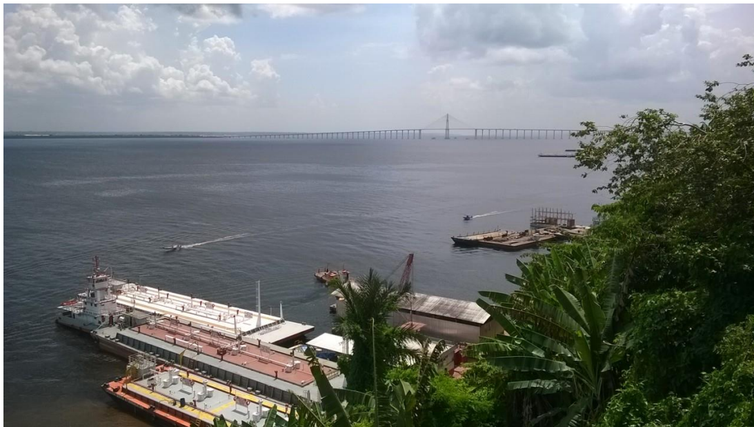
Rio Negro, Manaus. 2017.