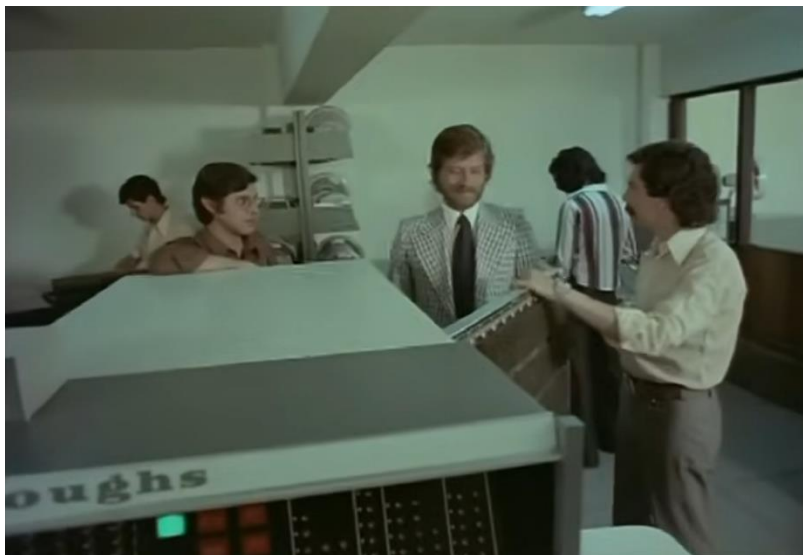
Figura 6 - Cena de “Excitação”

tecnológicas e aficionado pela cibernética – e a lei de Clarke salienta a lucidez de Renato frente a suas crenças materialistas e consolida sua ligação existencial à tecnologia.