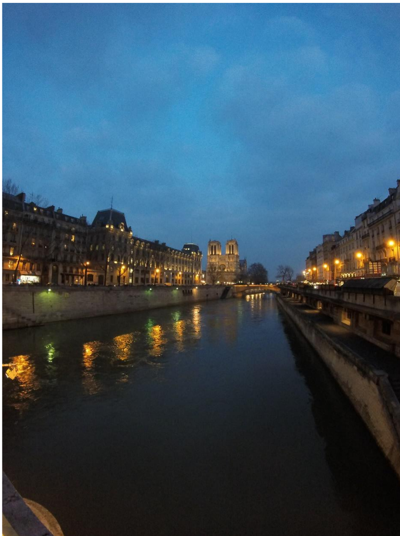
Rio Sena, Paris. 2016