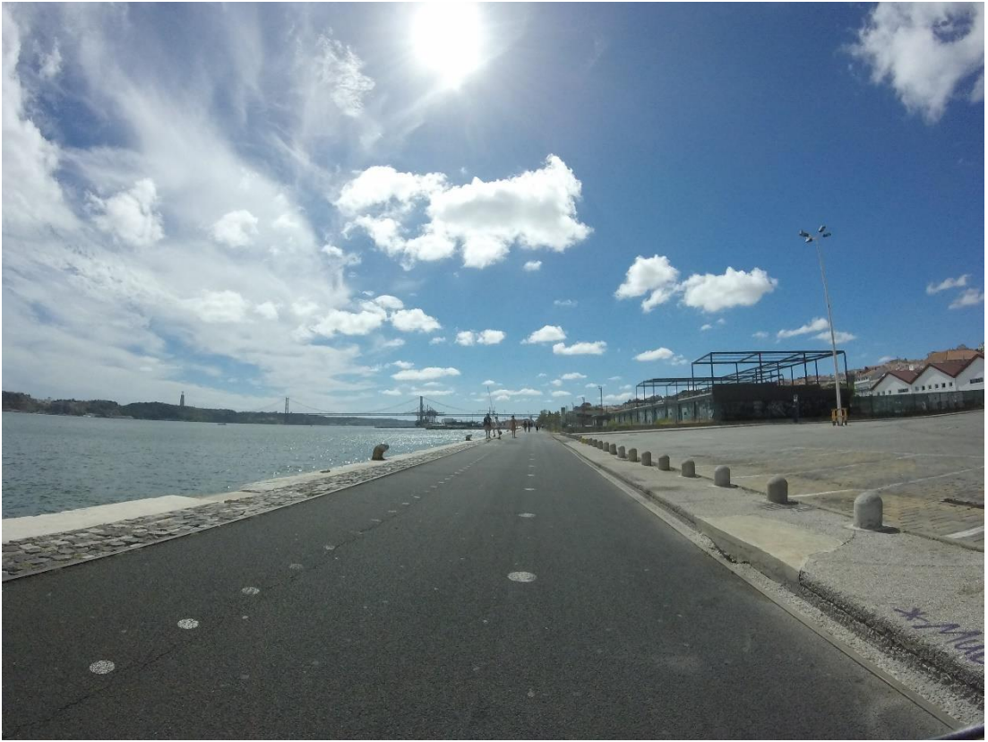
Rio Tejo, Lisboa, 2015.