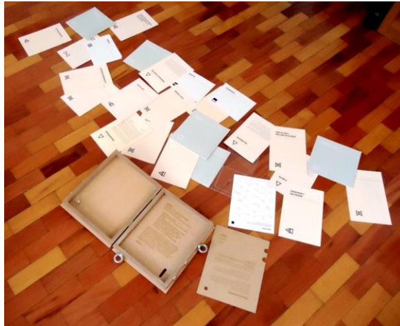
Figura 4. Tese, conteúdos espalhados. É possível ver duas proposições e três componentes em cores diferentes: Índices, Encartes e Cadernos.