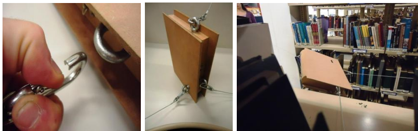
Figuras, 5, 6, 7 (esquerda para direita). Ativação da tese na Biblioteca da ECA/USP realizada no dia 14 de maio de 2012. Demonstração de sistema de sustentação com encaixe de mosquetões nas argolas na caixa 1.