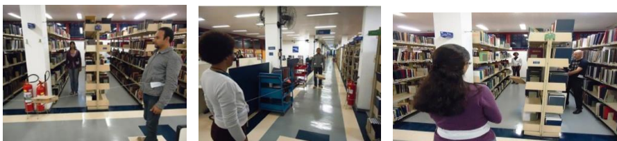
Figura 8, 9, 10 (esquerda para direita). Ativação da tese, sustentação da caixa da tese através do peso corporal dos participantes na Biblioteca ECA/USP.

A proposta foi elaborada para inserir o objeto/tese no espaço da biblioteca da ECA/USP e pode ser utilizada em outras bibliotecas. Participantes (performers/leitores/colaboradores) são convidados a fazer parte no jogo de sustentar a tese/obra e se tornar performers. A proposição foi criada para incentivar as pessoas a performar efetivando uma mudança comportamental no/a leitor/a e no espaço da biblioteca. Tal espaço é normalmente restrito a atividades de estudo, pesquisa e leitura que se baseiam na relação entre atividade mental e a absorção através do sentido do olhar. A proposta sugere uma relação corporal com a leitura, como ato de incorporação. No seu livro Arqueologia do Saber , Michel Foucault (2004, p.26) afirma que: “as fronteiras de um livro nunca são claras: para além do título, das primeiras linhas e do último ponto final, para além de sua configuração inteira e sua forma autônoma, ele está preso a um sistema de referências”.