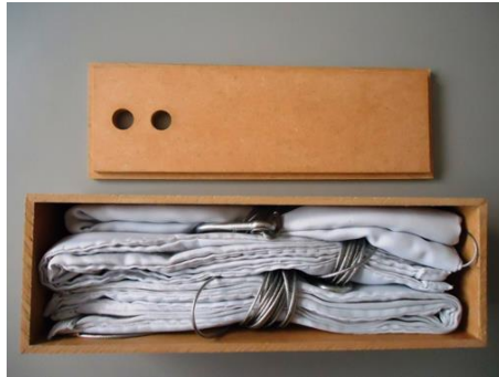
Figura 3. Tese, caixa 2 aberta revelando três cabos, cintos e mosquetões.

A tese abre com a Proposição S do lado esquerdo da caixa que recebeu essa dominação pelo S representar a palavra Suspensão.