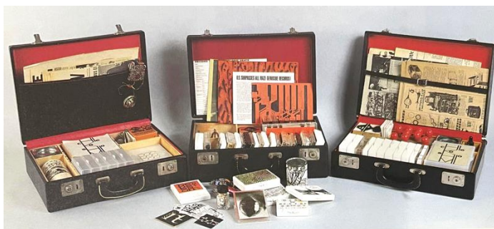
Figura 15. Fluxkits, malas com proposições de artistas. Projeto organizado por George Maciunas, 1965.

Pode-se afirmar que ali foram localizadas as primeiras práticas de relação escrita/ performance, estimulando um novo fluxo de ações entre os participantes. Maciunas organizava as propostas dos artistas e aplicava seus conhecimentos como designer gráfico fazendo modificações nas mesmas. Como na proposta dos Fluxkits, as partes da leitura composicional na minha tese oferecem uma possibilidade fragmentada de leitura que se realiza nas múltiplas formas de aproximação e de organização do material pelo/a leitor/a e nas performances executadas pelos visitantes. Suas caixas incluíam uma relação de uso escrita/objeto e convidava/ incorporava outros artistas.