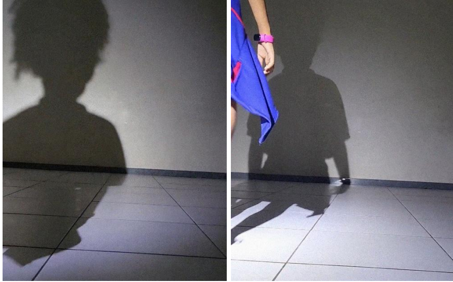
Figura 1. Ação performática – Fico grande.