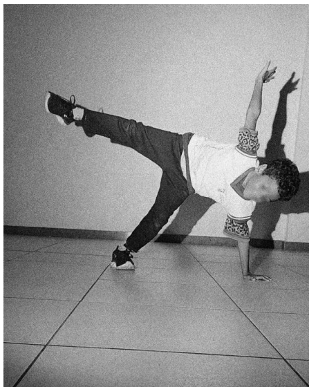
Figura 4. Ação performática – Outra virada de estrela. Fotografia da autora, 2024.