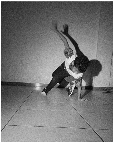
Figura 5. Ação performática – Movimentos fabulados I.