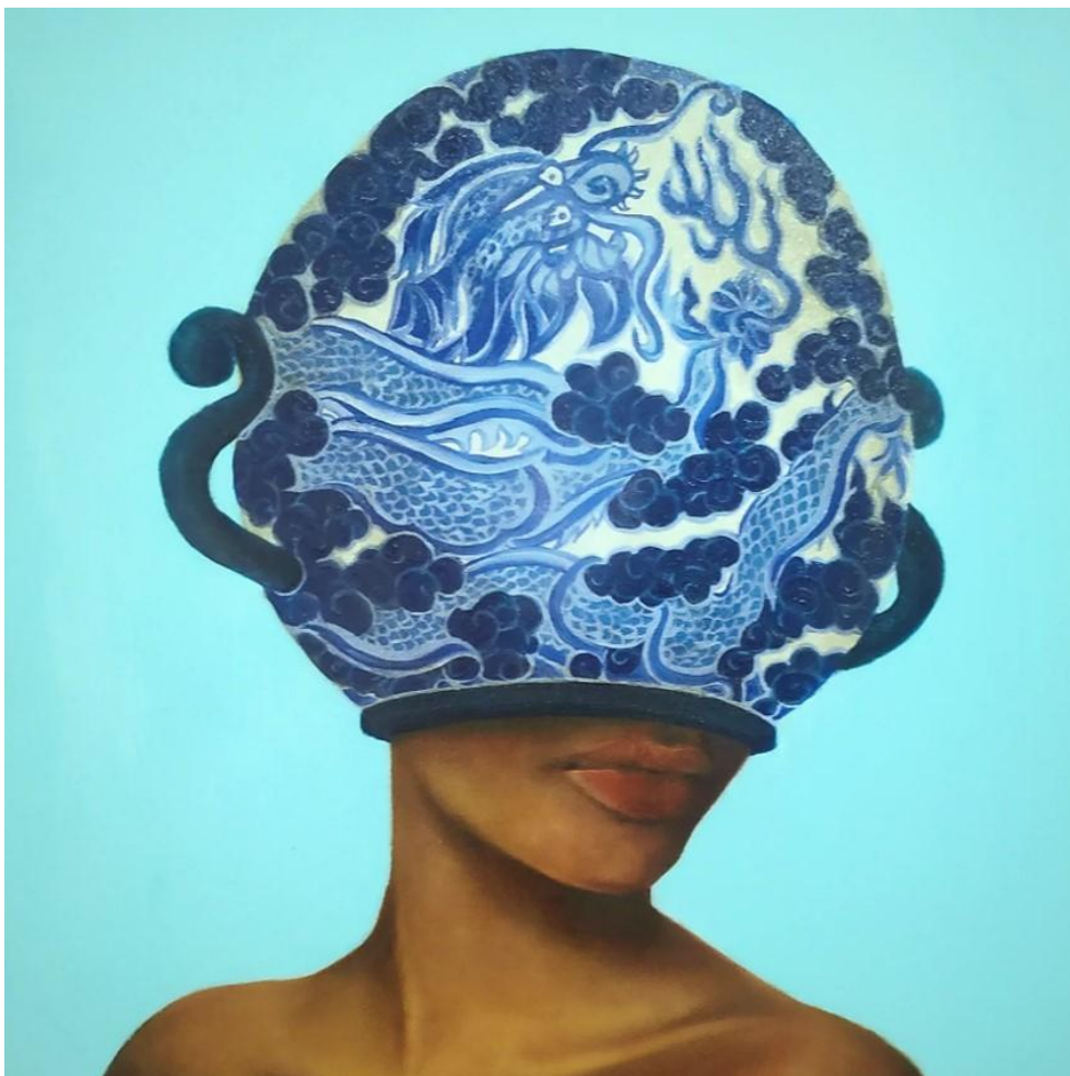
Fábula Instantânea 43 , óleo sobre tela, 40x40 cm, 202.