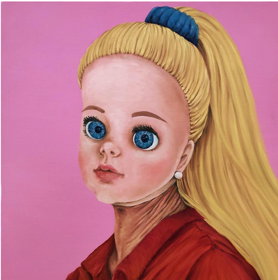
Fábula Instantânea 29 , óleo sobre tela, 40x40 cm, 2023.