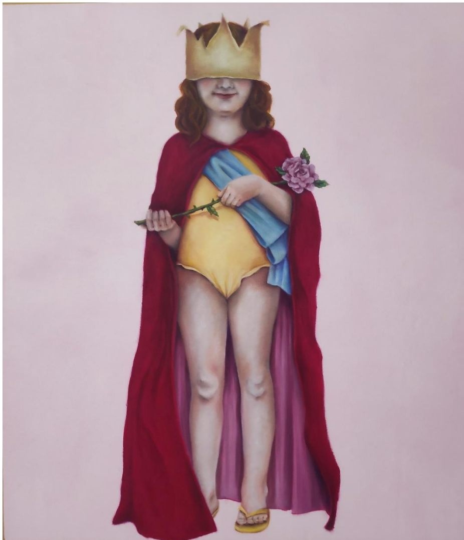
Fábula infantil , óleo sobre tela, 80x70 cm, 2024.