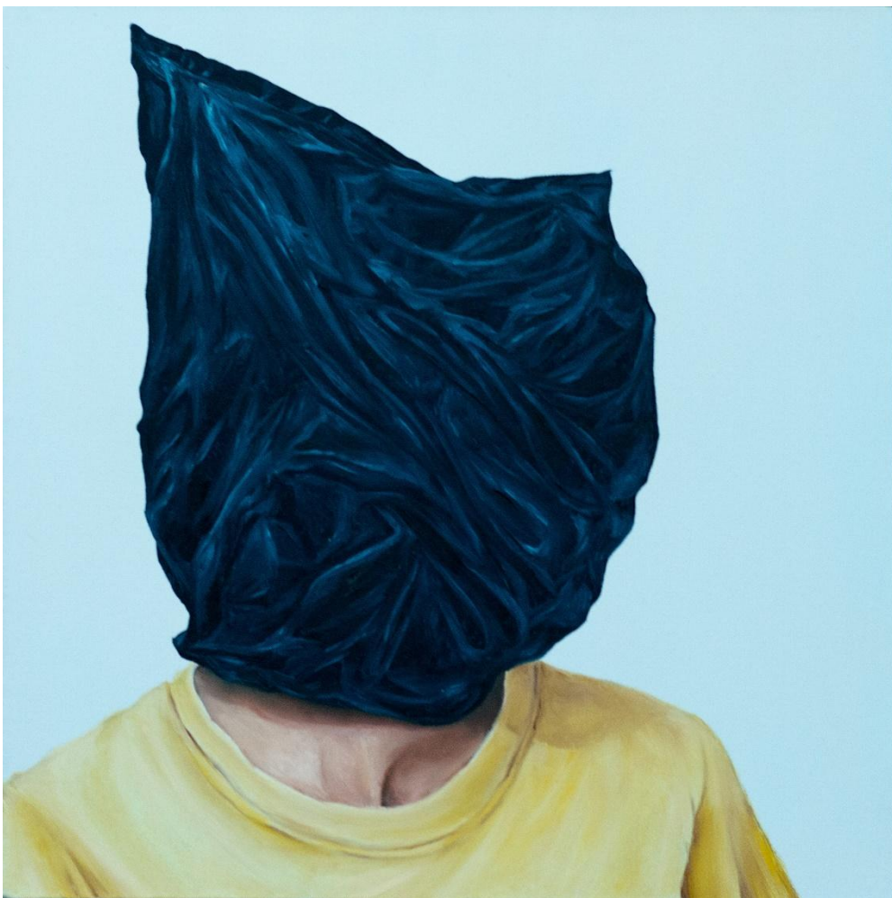
Fábula Instantânea 28 , óleo sobre tela, 40x40 cm, 2023.