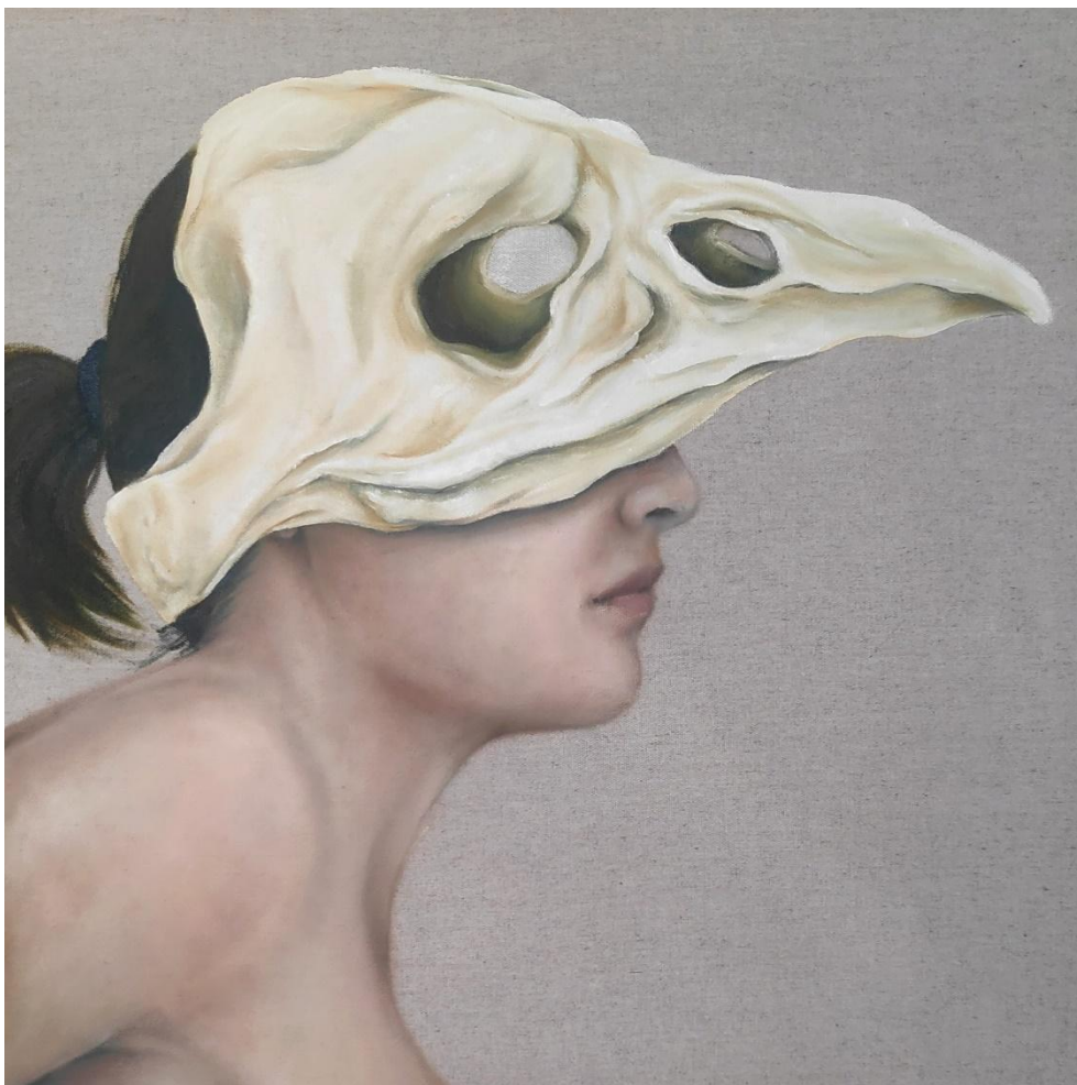
Fábula Instantânea 44, óleo sobre tela, 40x40 cm, 2025.