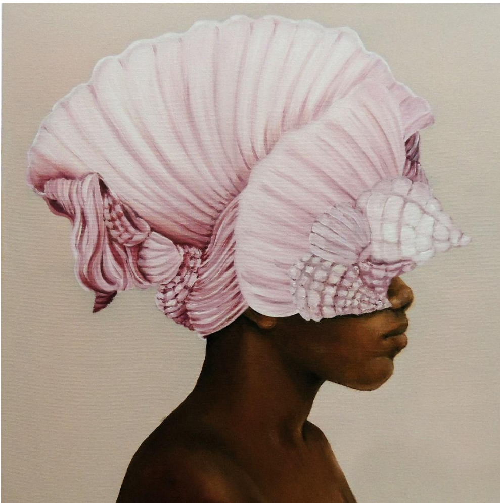
Fábula Instantânea 30 , óleo sobre tela, 40x40 cm, 2023.