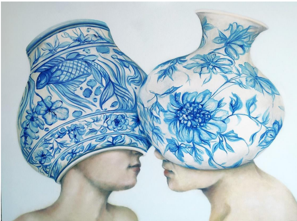
Fábula cotidiana 1 , óleo sobre tela, 75x90 cm, 2023.