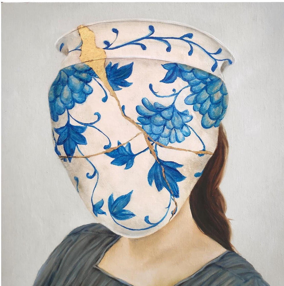
Fábula Instantânea 42 , óleo e folha de outro sobre tela, 40x40 cm, 2024.