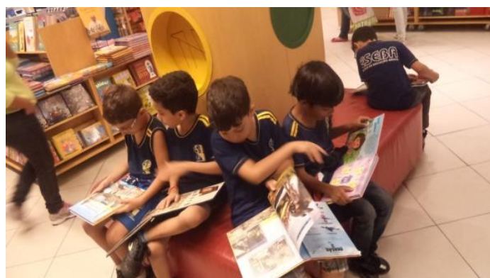
Visita à livraria Saraiva/Center Shopping, Uberlândia/MG.