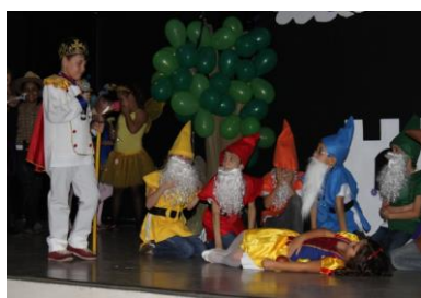
Apresentação do roteiro readaptado do conto de fadas: Branca de Neve e os Sete Anões , 2014. Alunos do 1º ano “A” da Escola de Educação Básica da UFU.