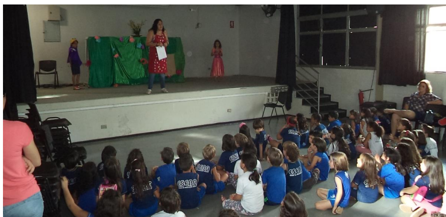
A primeira apresentação do conto de fadas readaptado foi realizada no anfiteatro da Eseba/UFU, para as demais turmas de 1º anos.

Todos: felizes para sempre. (todos juntos erguem as mãos dadas).