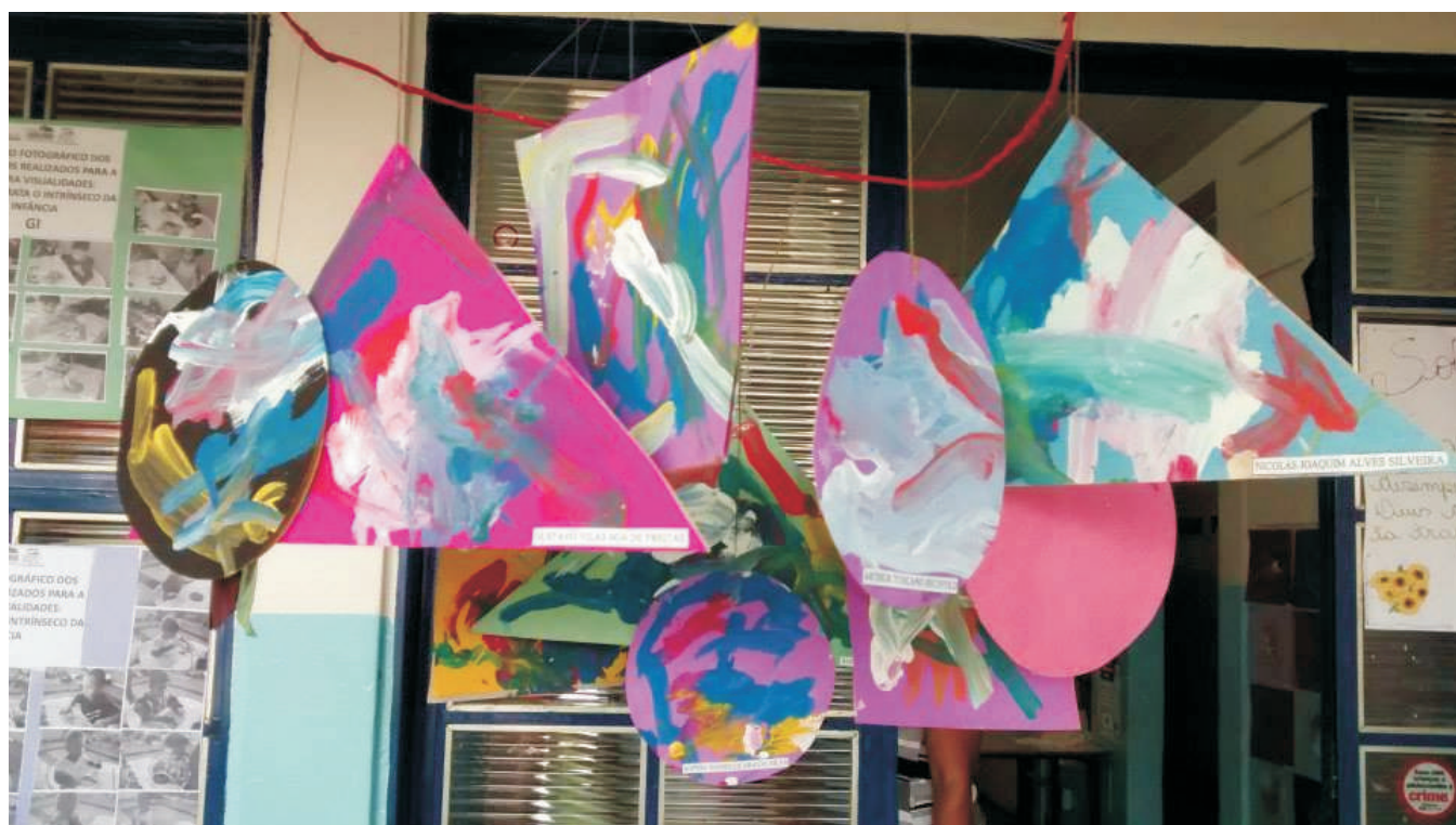
Experimentação de pintura sobre papel color set para construção de móbile.