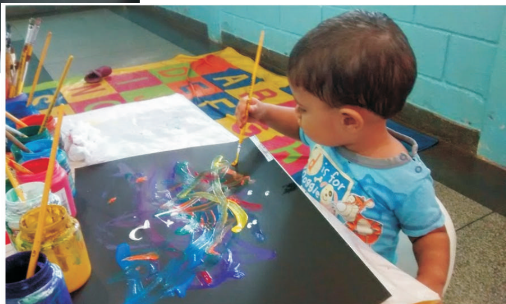
Expressão plástica através da pintura.