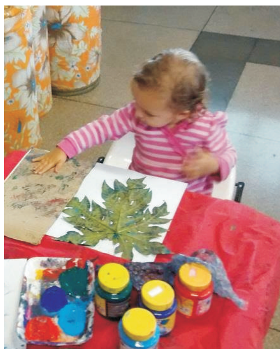
Alunos em processo de pesquisa de texturas por meio de frotagem.