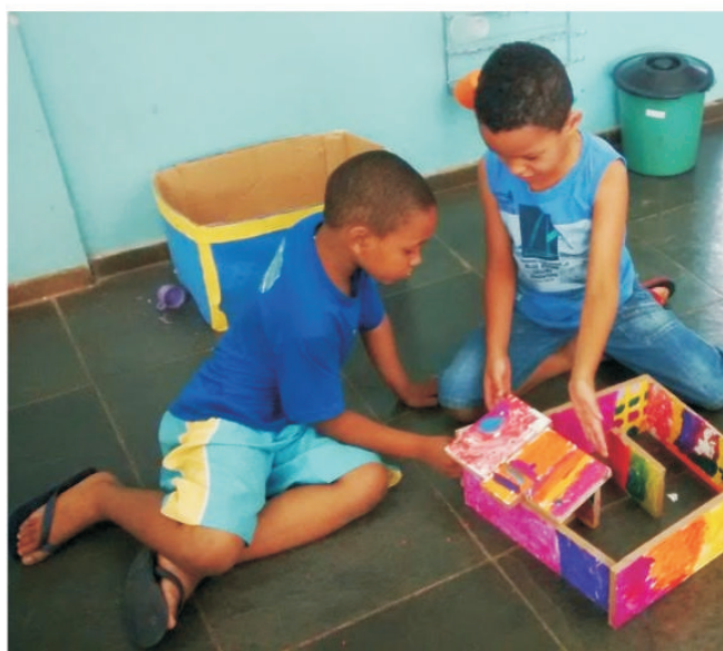
Alunos montando composições e experimentando possibilidades com os blocos de MDF.