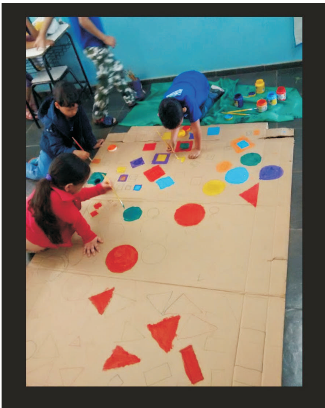
Estudantes da Educação Infantil durante o processo de exploração de pintura sobre papelão.