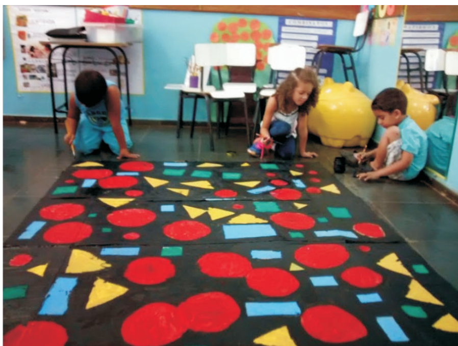
Processo de finalização da pintura sobre papelão do projeto "Arte Abstrata: o intrínseco da infância".