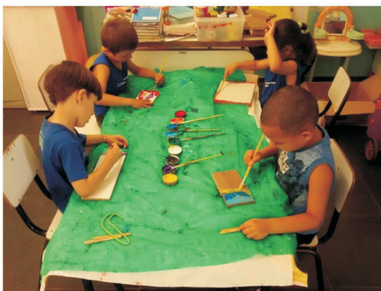
Alunos realizando pinturas sobre MDF.