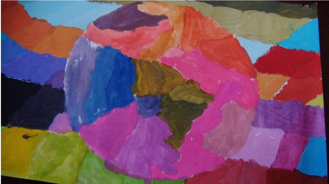
Imagen Nro. 2: “Colores de la naturaleza”

que parezca hay algo que desborda la figuración 10 y la narración, la profundidad de los colores dibuja otros territorios mas allá de la representación de la esfera terrestre; la relación entre imagen y figura manifiesta una trama que encubre un hecho “Colores de la naturaleza” fabrica otros lugares estéticos donde vivir, y denota la imaginación e invención de hacer visible lo que no tiene nombre.