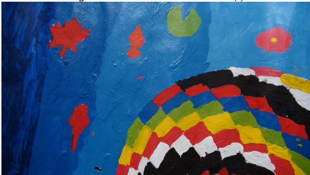
Imagen Nro. 1: “Permanecer en Primavera (s)”