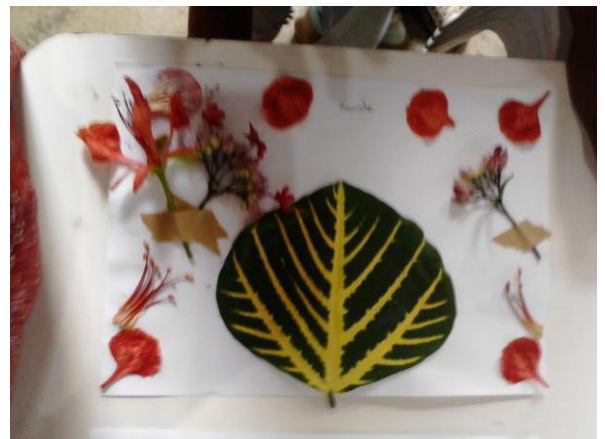
Matrizes para Xerogravura, tema: Folhas do nosso chão, "Oficina de Xilogravura" 2015.