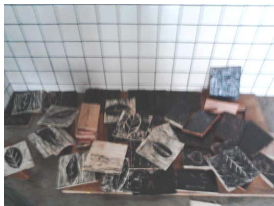
Processo de entalhe e impressão em xilogravura. "Oficina de Xilogravura", 2015.