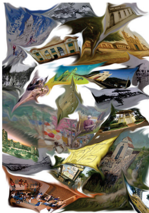
Marileusa Reducino, «Rizomatizando». Manipulação digital de imagem fotográfica. 40x60cm, 2011.