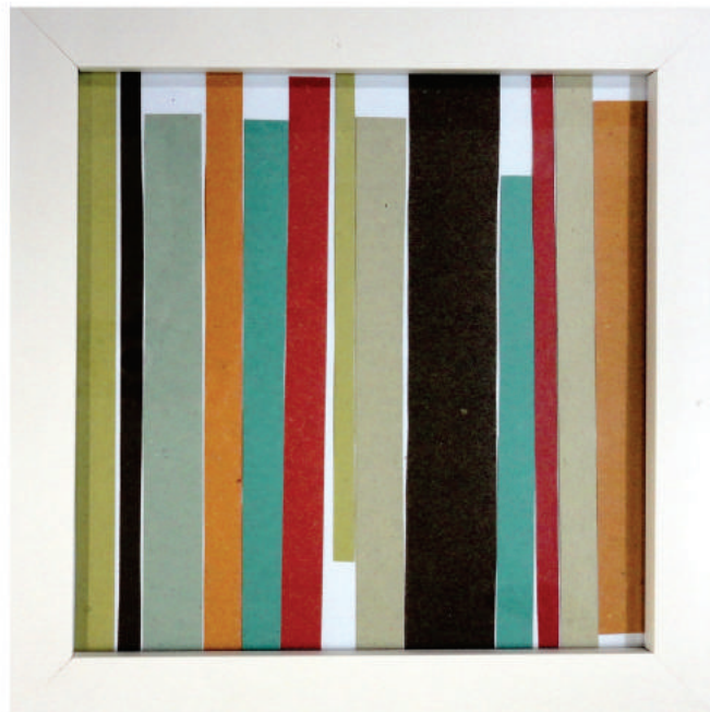
Marcia Sousa, «Intervalo». Composição com papel colorido. 20x20cm, 2010.