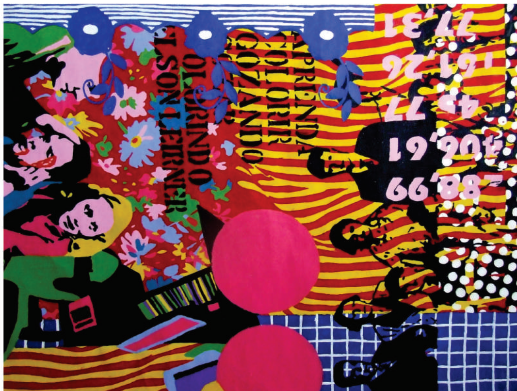
Vitor Marcelino, «Eu sou tudo isso nº 2». Acrílica sobre tela. 143x192cm, 2007.