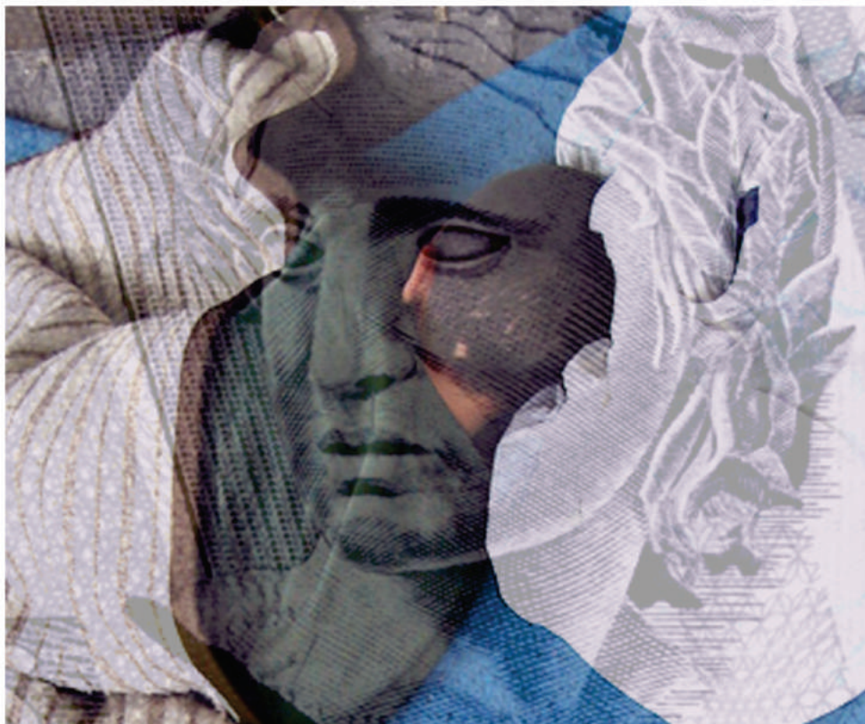
Manuel Rocha Neto, «Papel de Bala II». Manipulação digital de imagem fotográfica. 150x150cm, 2007.