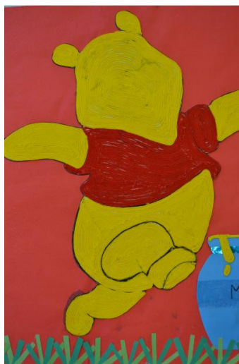
Pooh – Linha e papel