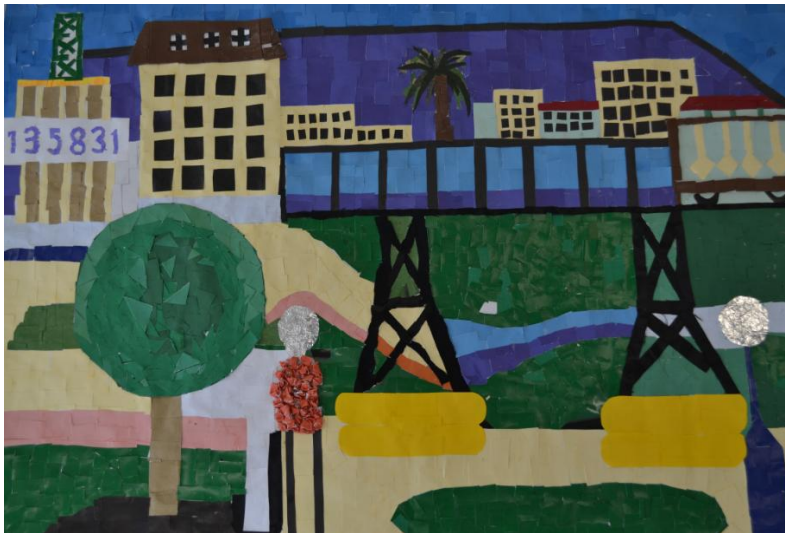
Tarsila do Amaral – Papel

Trabalhos finais das Paródias Visuais, 2014. Alunos 9º anos.