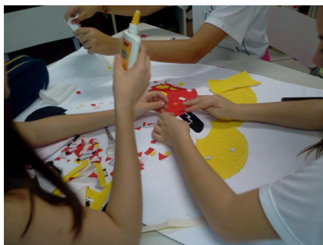
Processo de criação e execução das Paródias Visuais, 2014. Alunos 9º anos.