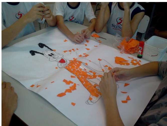
Alunos dos 9º anos durante a realização do processo artístico do projeto “Paródias Visuais”, 2014. Colégio Salesiano Região Oceânica