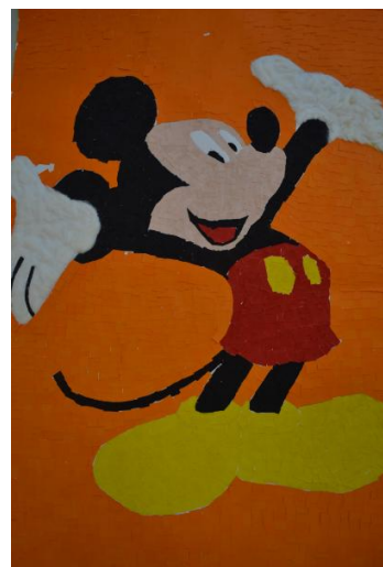
Mickey – Papel