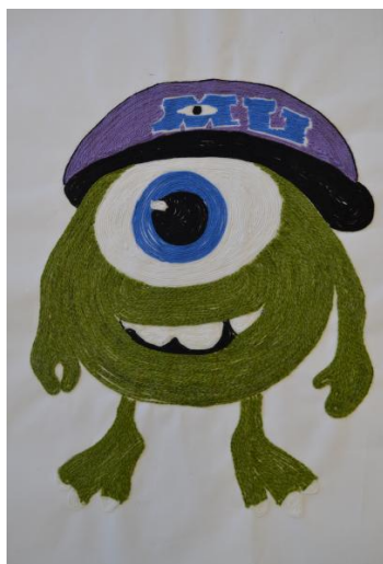
Mike Wazowski – Linha e papel