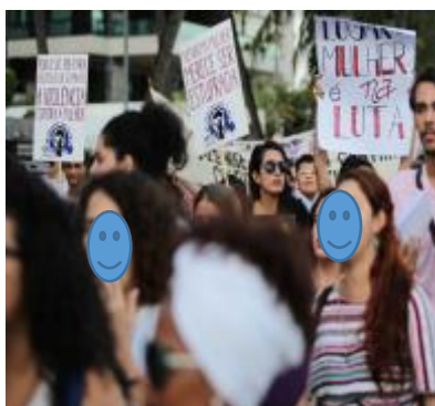
Figura 8 - Mulheres gritaram palavras de ordem durante passeata em Alagoas.

O portal G1/globo noticiou muitas mobilizações ocorridas no Brasil, após o conhecimento público do caso de estupro coletivo. As manifestações aconteceram em todas as regiões brasileiras, espalhadas por várias cidades. O tom dos encontros foi pintado por cores distintas, os cartazes eram feitos nas ruas com frases questionadoras da ordem binária de gênero, mensagens claras que evocavam a desnaturalização do controle do corpo feminino e da violência contra as mulheres. Gritos de guerra contra a cultura do estupro foram entoados ao som da contagem regressiva dos 33 estupradores do crime que chocou o Brasil. As mobilizações em torno deste crime sustentaram-se no elevado número de violências contra as mulheres no Brasil, pautaram-se também numa história de negações de direitos às vítimas repleta de violências simbólicas e institucionais. Seguem algumas imagens das mobilizações no Brasil: