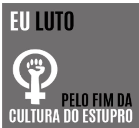
Figura 1 – Imagem usada nas redes sociais contra a cultura do estupro

que através da cultura do estupro existe um conjunto de crenças que encorajam a violação sexual contra a mulher. A cultura do estupro está nas imagens, na linguagem, nas piadas, nas expressões, nos programas televisivos, enfim, em toda a sociedade que compactua com essa forma de violência. Adeptos/as de perfis nas redes sociais como facebook e Twitter aderiram à campanha, “Eu luto pelo fim da cultura do estupro”, mudando as fotografias dos perfis e acionando um intenso debate nas redes, com imagens que explicam, por exemplo, o que significa a cultura do estupro, e como ela está presente no cotidiano das pessoas, conforme figuras abaixo: