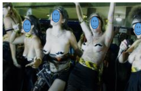
Figura 9 - Mulheres participam do ato 'Por Todas Elas' em prol do feminismo, contra a cultura do estupro e a violência praticada contra as mulheres, na região da Candelária, no Centro do Rio de Janeiro