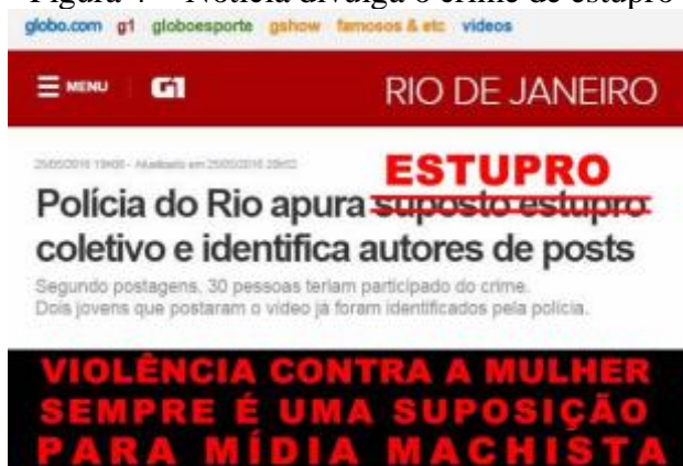
Figura 4 - Notícia divulga o crime de estupro

A forma como algumas notícias foram publicadas, através de sites jornalísticos brasileiros, também chamou a atenção de internautas, especialmente, quando o viés da notícia, através das palavras escritas, amenizava ou distorcia a violência sofrida pela jovem. Além disso, as críticas também se impuseram ao sensacionalismo incorporado pela mídia ao divulgar o crime: