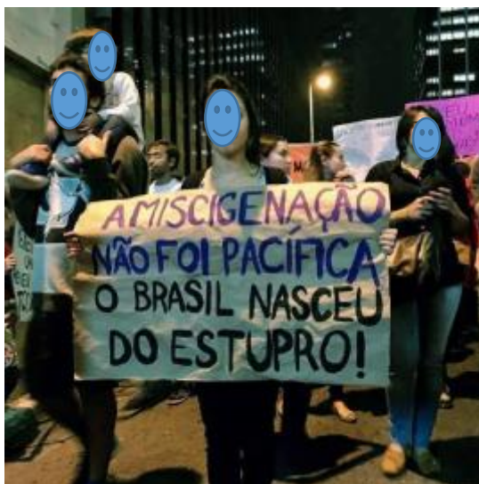
Figura 12 - Protesto contra a cultura do estupro

foi evocada nas manifestações de ruas para mostrar que são formas distintas de violências que legitimam historicamente o estupro, como apresentado na imagem abaixo: