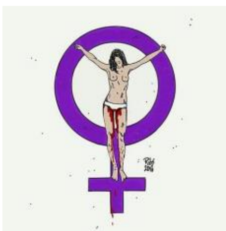
Figura 5 – Imagem simboliza a vítima do crime de estupro

Muitas imagens que denunciavam as agressões contra a vítima do estupro coletivo do Rio de Janeiro estiveram presentes nas redes sociais. Criadas para simbolizar o sofrimento da adolescente, o compartilhamento das figuras serviu também para denunciar a violência sofrida cotidianamente por muitas mulheres. A imagem símbolo deste crime pode ser apresentada através da figura abaixo. Esta faz menção ao vídeo divulgado nas redes sociais com cenas do estupro, e que mostrava os supostos agressores manipulando a genitália de vítima que estava sangrando: