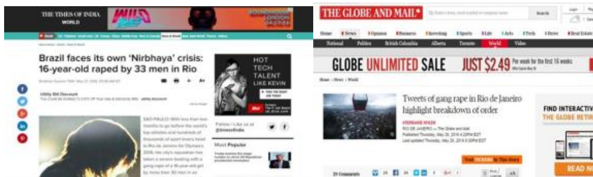
Figura 3 – Imagem jornalística internacional sobre o estupro no Brasil

Um site de notícias indiano chamado The Times of India chamou atenção para o caso. Segundo a notícia publicada, “O Brasil encara sua própria crise de Nirbhaya”, escreveu o jornal em referência ao episódio de 2012 em que uma estudante indiana foi estuprada por uma gangue em um ônibus em movimento em Nova Déli e morreu em decorrência de graves ferimentos internos, seguem algumas notícias em sites internacionais divulgando o episódio: