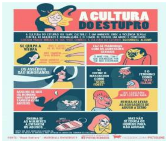
Figura 2 – Imagem explicativa sobre o que significa a cultura do estupro