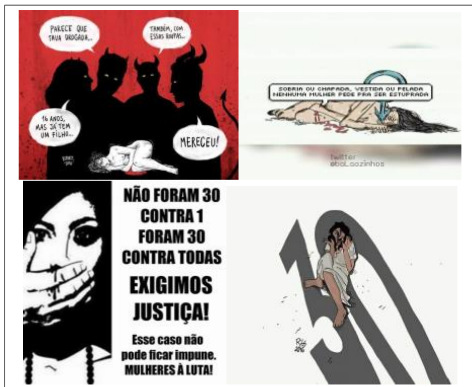
Figura 7 -Imagens simbolizam o crime de estupro