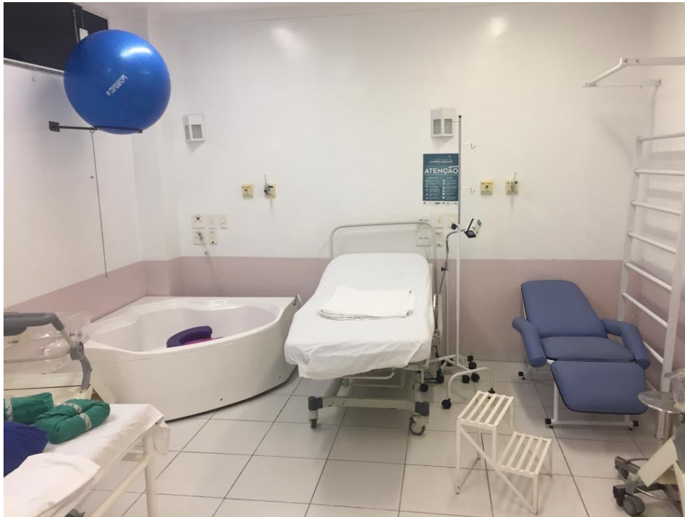
Imagem 3 – Sala de parto.