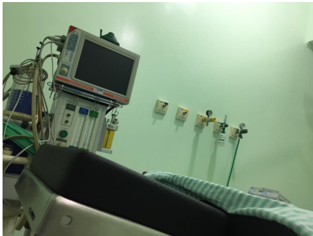
Imagem 1 e 2 – As simulações da percepção do olhar da gestante durante a cirurgia.