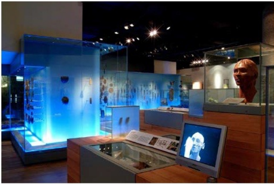
Figura 3 – Imagem da exibição “London before London” (Museu).

No que se refere a um museu como um espaço multissemiótico de construção de sentido, Bezemer et al. (2012) chamam atenção para o fato de que se busca planejar este espaço para o envolvimento e interação dos visitantes. Para tanto, os sentidos são produzidos a partir da combinação de inúmeros recursos, sejam eles objetos culturais, textos, réplicas, rótulos, telas de computador, sons, iluminação, painéis, etc., como pode ser observado na figura 3.