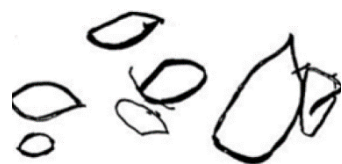
Figura 2 – Desenho de uma criança de três anos.

Ressaltamos que embora haja a preocupação de como o texto multimodal é organizado e seus possíveis efeitos de sentido, chamamos a atenção para o fato de que os textos multimodais vão determinar sentidos de acordo com os recursos internos, da perspectiva e do interesse de quem está os lendo e não são pré-estabelecidos. Nessa direção, para exemplificar o processo de construção de sentido como um processo situado e contextual, Bezemer et al. (2012) discutem como o aprendizado de uma criança de três anos ocorreu ao desenhar sua representação de um carro na forma de sete círculos, conforme a ilustração a seguir (figura 2).