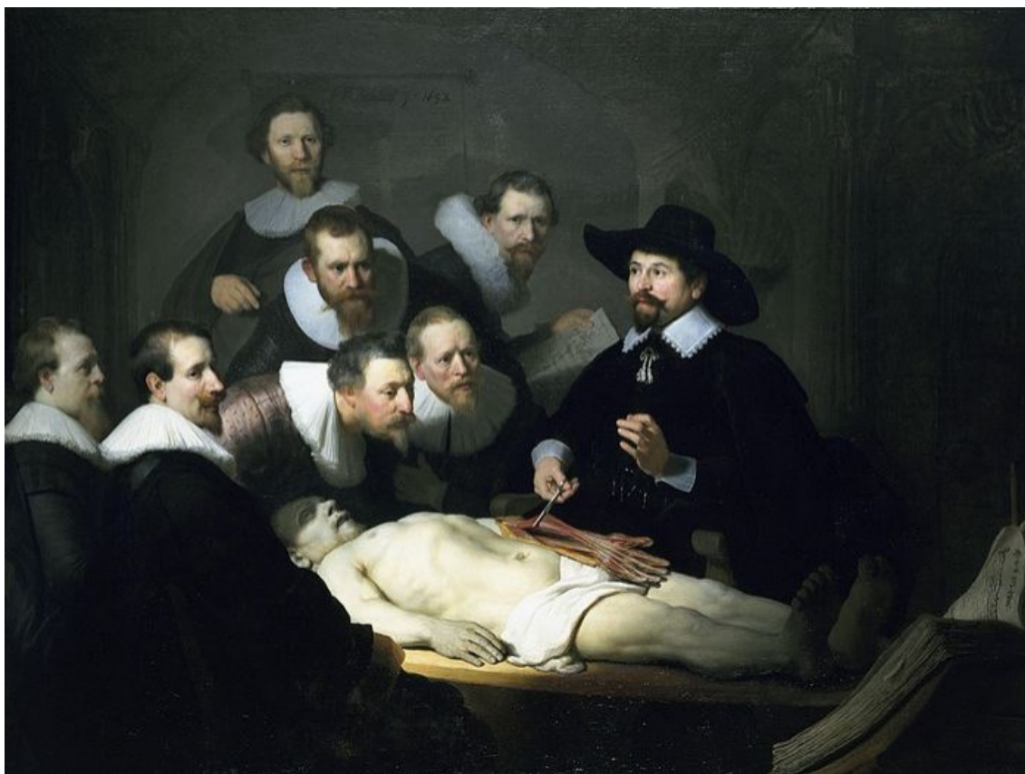
Figura 1 - Aula de Anatomia do Dr. Tulp

Fonte: Rembrandt van Rijn (1632) - Museu de Mauritshuis.