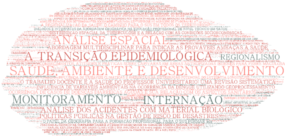
Figura 2 – Nuvem de palavras organizada com as temáticas publicadas na Hygeia (2005-2020).

Fonte: Hygeia (2005-2020). Org.: WordArt e autores (2020).