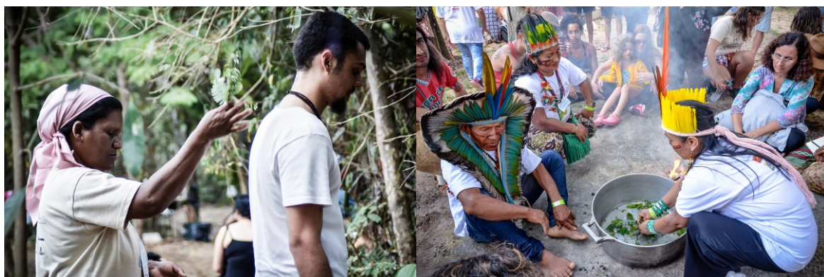
Figura 2 – Encontro Raízes (2019 - Chapada dos Veadeiros). Práticas e cuidados alternativos e tradicionais para os males do corpo e alma.

Ademais, a “nebulosa místico-esotérica” (CHAMPION, 1993) substancia que a transformação do mundo só é possível se nos direcionarmos para uma transformação individual nos domínios da saúde, do corpo e da psique. Pesquisadores(as), terapeutas, “não-médicos”, indígenas, raizeiros(as), benzedeiros(as) (F), holísticos etc., fortalecem a nebulosa místico-esotérica com grupos e discussões que compreendem as causas das doenças como desequilíbrios entre corpo-mente-espírito, ou ainda, que são avisos de um plano astral, para que o doente volte-se para o seu interior e resgate um equilíbrio natural, que está em perfeito acordo com os ciclos da natureza e cosmos.