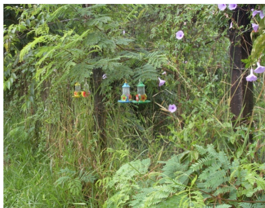
Figura 1: Áreas de estudo. A- Campus Umuarama da Universidade Federal de Uberlândia; B- Parque Municipal do Sabiá.