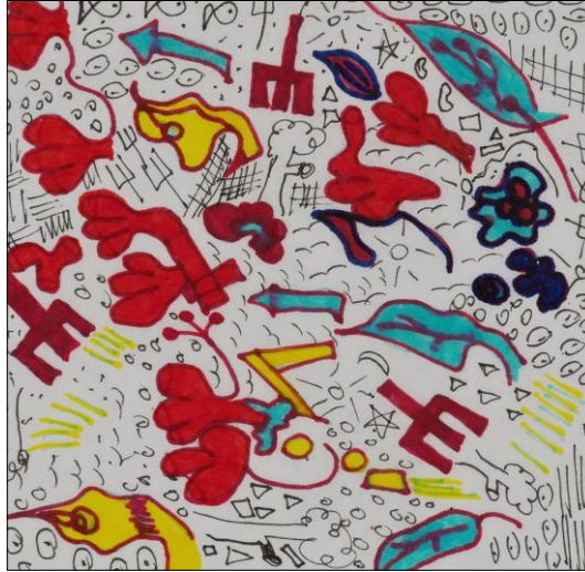
FIGURA 2: Quarto Logos – Déa Trancoso